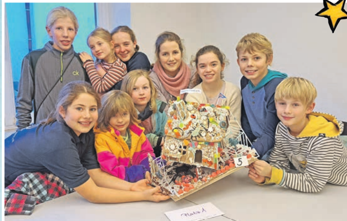
Die Jugendgruppe des Segelclubs Preetz räumte mit ihrem prächtigen Lebkuchenhaus ganz groß ab. Für diese Gemeinschaftsproduktion gab es den ersten Preis.