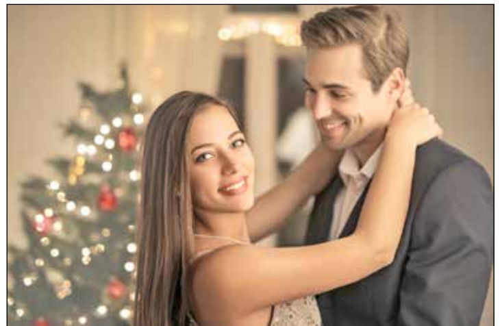
Bewegendes Weihnachtsgeschenk: ein Gutschein der Tanzschule Tessmann

ben Euch schnell Sicherheit auf dem Tanzparkett. Mit viel Spaß könnt Ihr die Leichtigkeit des Gesellschaftstanzes erleben. Nur wenige Tage vorher bieten wir wieder mehrere Termine für eine kostenlose und unverbindliche Schnupperstunde an. Hier könnt Ihr ausprobieren, wie schnell man sich unter professioneller Anleitung auf dem Tanzparkett wohlfühlt. Ab dem 18. Januar starten auch neue Grundkurse für Schüler und Jugendliche. In unseren Schüler-Tanzkursen werden auf einfache Weise und mit viel Spaß die Standard- und