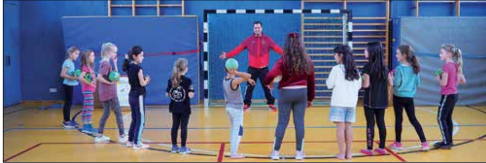
Die Preetzer Grundschüler waren mit Eifer bei der Sache und nahmen die Handball-Tipps der Profis gerne an.

Unter dem Motto „Bewegung, Spiel und Spaß“ hatten die insgesamt 75 Kinder die Möglichkeit, sich an verschiedenen Stationen im Pellen, Werfen und Fan-