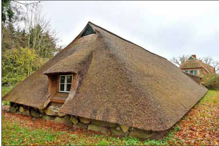
Das tiefgezogene Dach ist die bauliche Besonderheit des Schafstalls aus dem 19. Jahrhundert. In dieser Region ist er das letzte Gebäude dieses Typs.

seiner Restaurierung hat die Familie Reher das letzte Gebäude dieser Art in der Region erhalten. Dr. Nils Kagel würdigte die buchstäbliche Rettung des Schafstalls Schönweide vor dem Abriss – ein bescheidenes Gebäude. Doch in seiner kulturgeschichtlichen Bedeutung dürfe es nicht unterschätzt werden, betonte er in seiner Laudatio. Es handelt sich um den Schafstall des gutsherrlichen Forsthauses „Liebeseele“ in der Nähe des Gutes Schönweide, ei-