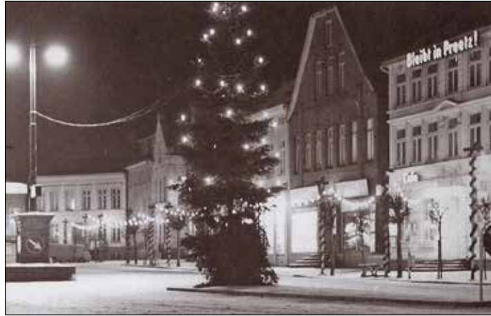
Den festlich geschmückten Weihnachtsbaum auf dem Preetzer Marktplatz hat es bereits 1949 gegeben.