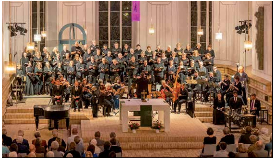
Im Herbst sang die Plöner Kantorei bei großen Bachfest.

Tickets gibt es vormittags im Kirchenbüro Plön, Telefon 04522-2235, und online auf www.ploener-kantorei.de oder www.reservix.de .