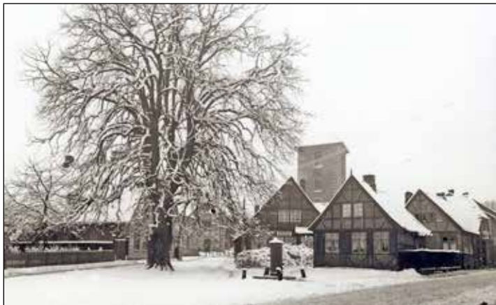
Der Winter in Preetz konnte weiß sein, wie auf dem Bild. 1949 aber hoffte man vergebens auf Schnee.

Erhältlich ist das neueste Heft zum Preis von 4 Euro in der Preetzer Bücherstube, der Buchhandlung am Markt, bei Tabakmüller im Fachmarktzentrum und in der Kührener Straße, bei Edeka-Schröder, in der Gärtnerei Möller sowie in der Tourist-Info in der Mühlenstraße.