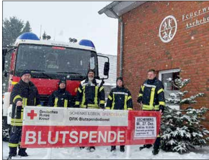
Freiwillige Feuerwehren und Deutsches Rotes Kreuz arbeiten erfolgreich zusammen.

„Wir sind den vier Wehren und ihren Helferteams sehr dankbar für dieses Engagement. Die Ascheberger Spendetermine werden jedes Mal von rund 70 Spenderinnen und Spendern wahrgenommen. Das ist ein wichtiger Beitrag für die Patientenversorgung im Norden. Bei generell rückläufigen Blutspendenzahlen wäre ein Wegfall dieses Spendeortes im Kreis Plön nicht zu ver-