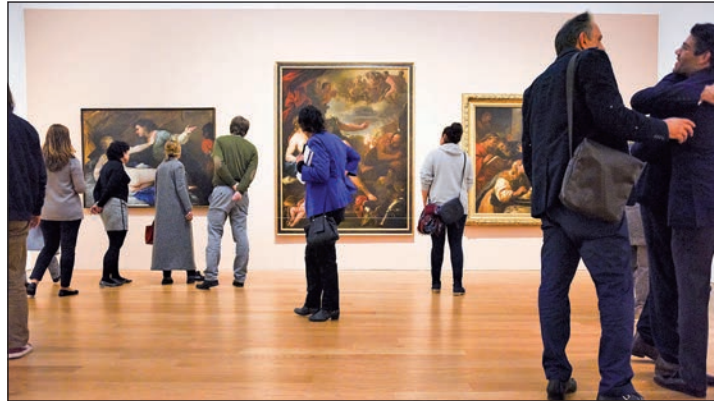
Das derzeit berühmteste Kunst-Museum Europas erwartet unsere Leser in Potsdam mit dem Barberini-Museum mit der sensationellen neuen Munch-Ausstellung.

und der Möglichkeit zur Nutzung der großen Wellness-Abteilung mit Hallenbad, Sauna und