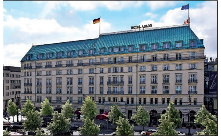
Das „berühmteste Hotel der Welt“ am Pariser Platz in Berlin können die Reporter-Leser im Februar 2024 ausführlich genießen.

Fitnessraum. Als kulturellen Höhepunkt der dreitägigen Sonderreise zum Top-Termin vom 25. bis 27. Februar 2024 zum sehr günstigen Komplettpreis von nur 475 Euro genießen unsere Leser inklusive Eintritt ohne Warteschlangen und inklusive Hin- und Rücktransfer das weltberühmte Barberini-Museum in Potsdam mit der gerade frisch eröffneten großen Sonderausstellung „Munch. Lebenslandschaft“ mit Leihgaben aus Museen in aller Welt