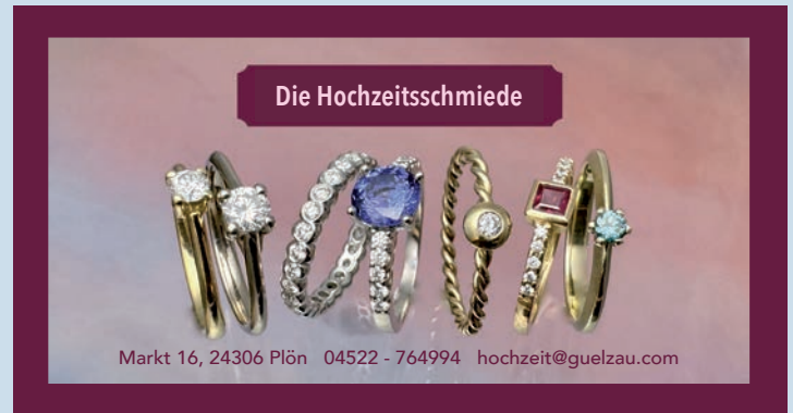
Markt 16, 24306 Plön 04522 - 764994 hochzeit@guelzau.com

Wir wünschen allen Kunden, Freunden und Bekannten ein schönes Weihnachtsfest und einen gesunden Start ins neue Jahr!