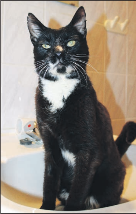
Der schwarze Kater Boris sucht ...

Kossau/Lebrade (t). Auch in dieser Ausgabe wollen wir unseren Lesern wieder tolle Bewohner des Tierheims Kossau vorstellen, die ein neues und liebevolles Zuhause suchen. Den Anfang macht Kater Boris.