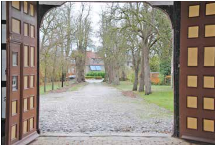
Wie eine Allee säumen die Birnbäume die Hofzufahrt. Sie führt direkt auf die alte Diele des Niederdeutschen Hallenhauses zu.

Kachelöfen neu aufgesetzt worden. 1985 erfolgte die Teilnahme an einem Lehmbauseminar der IG Bauernhaus. Zwischen 1986 bis 89 habe Familie Bern im Zuge des Dorferneuerungsprogramms Dreiviertel der Dachflächen neu mit Reet eindecken lassen; 1996 folgte das letzte Viertel. Die 1978 eingebauten Kunststofffenster wurden 2021 durch denkmalgerechte Holzfenster ersetzt. 2022 ließ Familie Bern die bemalten Tapeten restaurieren. Zuzüglich zu den großen Projekten wurden die Lehmdele im Hallenhaus sowie die Gartenanlage instandgesetzt und Baumpflege betrieben. „Im Vergleich mit der allgemeinen baulichen Entwicklung in gesellschaftlichen Diskurs muss man feststellen, das aktuelle Kriterien oder Eigenschaften wie Schadstofffreiheit, ökologische Bauweisen, Nachhaltigkeit und Recyclingfähigkeit diese Gebäude schon seit Jahrhunderten mitbringen“, warf Edgar Schwinghammer einen Blick über den Tellerrand. „Auch diese Tatsache spricht für die weitere Erhaltung und Pflege unserer Kulturdenkmäler.“ Lesen Sie mehr in unserer nächsten Ausgabe über den Schafstall, der von Familie Reher vor dem Abriss bewahrt wurde.