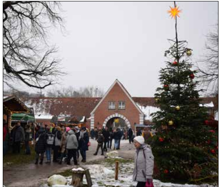
Der klösterliche Weihnachtsmarkt ist auch in diesem Jahr gut besucht.