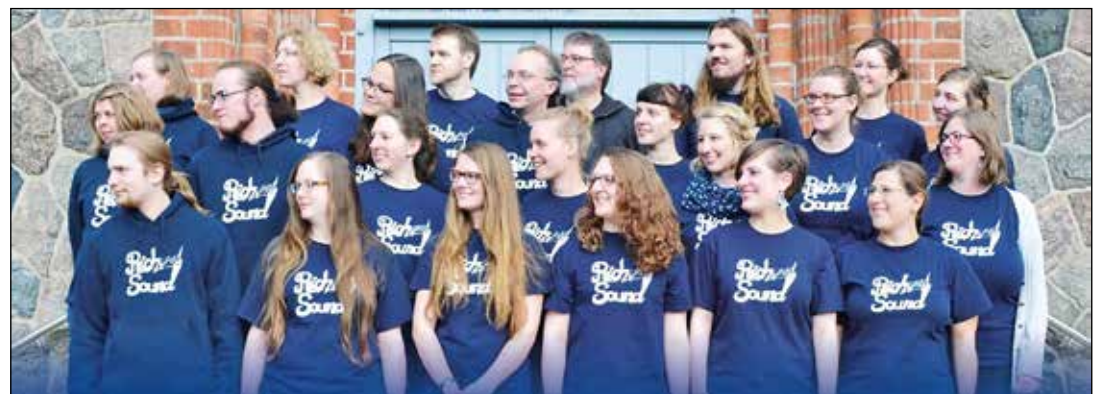
Der „RichSound“-Chor bringt lebendige Musik in die Stadtkirche