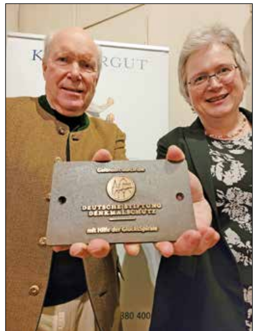
Das Bronzeschild hängt nun im Eingangsbereich der Marienkirche.

lern für die Öffentlichkeit kostenlos zugänglich sind. Die Gelder der privaten Stiftung kommen von Spenden, aus den Treuhandstiftungen und durch die Mittel der Lotterie „GlücksSpirale“. Eine der jüngsten regionalen Förderungen war der Pferdestall auf Gut Helmstorf, bei dem unter anderem der Uhrenturm grundlegend saniert wurde. Doch gerade die Kirche in Kirchnüchel fasziniert den Ortskurator Wolfgang von Ancken: „Ich bin verblüfft über die Akustik der Kirche“, die nun beim Singen