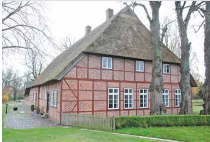
Der Wohnbereich des Niederdeutschen Hallenhauses schließt sich rückwärtig an den Wirtschaftsteil des Gebäudes an.

Hufe 8 – heute ist es je zur Hälfte in Wohn- und Wirtschaftsteil unterteilt - weist zahlreiche Besonderheiten auf. Errichtet auf einer 14 mal 32 Meter großen Grundfläche, habe es ursprünglich zu einer als Rundlingsdorf angelegten Siedlung (zwischen Probsteierhagen und Schönberg) gehört. Neben der imposant großen Wirtschaftsdiele seien Gesellschaftsräume erhalten, darunter eine getäfelte Probsteier Bauernstube. Ungewöhnlich auch: zwei wandfeste handbemalte Tapetenflächen. Sie stammten aus der Zeit um 1850 und seien von Wandmalern gegen Austausch von Kost und Logis angefertigt worden. Die Hofzufahrt ist von alten Birnbäumen alleearig gesäumt, der Hof mit Kopfsteinen gepflastert, was als Außenanlage gesondert unter Denkmalschutz gestellt worden sei. „Das war keineswegs die übliche Praxis bei denkmalrechtlichen Unterschutzstellungen zu jener Zeit und betont