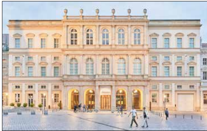
Europas spektakulärstes Kunst-Museum: Das „Barberini“ im Herzen von Potsdam

Preetz/Plön (t). Weltklasse-Kunst vom Feinsten genießen unsere Leser*innen auf Grund großer Nachfrage bei der dritten großen Zusatz-Kunst-Weekend-Sonderreise direkt ab Preetz und Plön nach Potsdam und Berlin vom 9. bis 10. März 2024 zum Sonderpreis von nur 199,90 Euro mit Europas derzeit spektakulärstem Kunstmuseum in Potsdam, dem Barberini-Museum mit der nagelneuen, sensationellen Sonderausstellung „Munch – Lebenslandschaft“. Die einmalige Bilderschau versammelt mehr als 90 spektakuläre Leihgaben-Kunstwerke aus dem Munch-Museum Oslo, dem MOMA New York, dem Dallas Museum sowie zahlreichen deutschen Top-Museen. Außerdem lockt die in Europa einmalige Impressionisten-Ausstellung von Hasso Plattner im „Barberini“ mit über 100 Meisterwerken von Claude Monet, Auguste Renoir, Camille Pissarro und vielen anderen. Bereits am Vormittag des An-