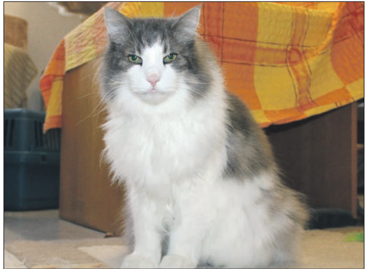
... genauso wie Kollege Rudolf ein neues Zuhause.

An der B430 · 24306 Kossau/Lebrade · Tel. 04522 / 2389