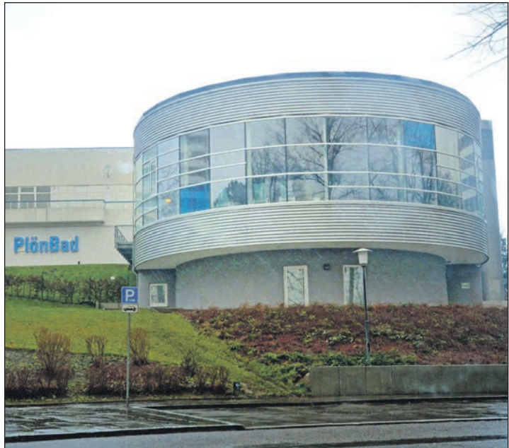
Im Plönbad ist zum Jahresanfang Disco – ein Veranstaltung für Kinder und Jugendliche.

Die Anmeldung erfolgt online unter www.unser-ferienprogramm.de/ploen - weitere Informationen gibt es bei Bedarf telefonisch unter 04522-3695. Die Anmeldung muss jedoch schon bis Donnerstag, 21. Dezember erfolgt sein. Der Eintritt zur Disco kostet 3 Euro. Die Teilnehmer der Plönbad-Disco dürfen sich auf DJ Mr. Launy freuen, der am Beckenrand für Stimmung, den guten Ton und die richtigen Beats sorgt. Eine Lichtshow rundet das musikalische Programm