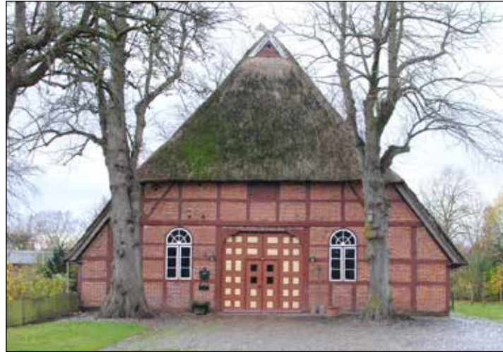
Zwei alte Linden flankieren die Dielentür, die „Groot Döör“, hinter der sich der historische Wirtschaftsbereich des Niederdeutschen Hallenhauses verbirgt.

In dieser Ausgabe lesen Sie über die Fiefbergener Hofstelle, die