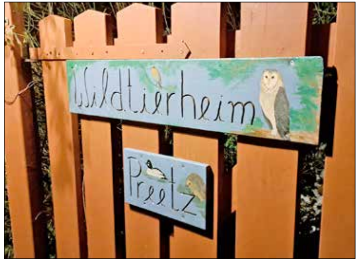
Das Wildtierheim Preetz lädt am Sonnabend erneut zum „Tag der offenen Tür“ ein.

der sich sein Wissen um die Tierpflege selbst angeeignet hat. „Ich bin auf einem Bauernhof groß geworden und habe mir auch viel von der Natur abgeguckt“, erzählt er. Bock ist seit knapp drei Jahren im Wildtierheim aktiv und macht zurzeit seinen Falknerschein. „Unsere Quote bei der Auswilderung ist hoch. Betreute Tiere, die vital sind, aber nur noch in Gefangenschaft leben können, vermitteln wir an Wildtierparks oder in