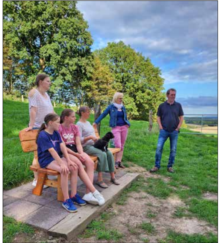
Dank einer neuen Bank lädt dieser Platz zum Verweilen ein.