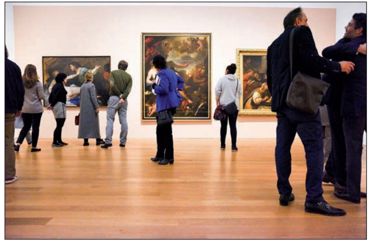
Spektakuläre Welt-Kunst an der Weser präsentiert die große Geburtstags-Ausstellung in der Kunsthalle Bremen.

auf dem Handy am 7. Dezember 2023 und am 14. Dezember 2023 zum Sonderpreis von nur 49,90 Euro an. Außerdem verbleibt Freizeit zum Besuch der traumhaften Weihnachtsmärkte in der Altstadt und an der Weser.