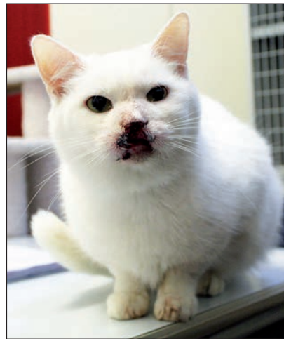
Das sind Rudolf (li.) und Kyra.

An der B430 · 24306 Kossau/Lebrade · Tel. 04522 / 2389