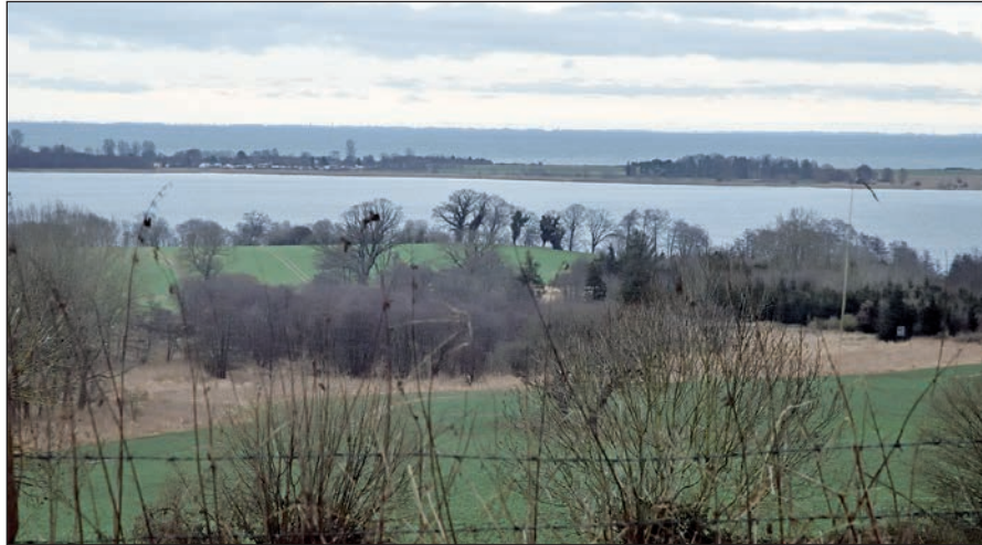
Blick von Stöfs Richtung Lippe. Am kommenden Sonntag genießen die Halbmarathonläufer auf ihrem Weg „Rund um den Großen Binnensee“ eine der schönsten Laufstrecken in Schleswig-Holstein.

Start ist am Sonntag, dem 5. November 2023 um 10 Uhr im Lütjenburger Gewerbegebiet Bunendorp. Von dort führt die Halbmarathonlaufstrecke über Darry, Stöfs, Lippe, Hohwacht und Neudorf zurück nach Lütjenburg. Gewalkt wird auf gleichem Weg bis Stöfs, dann geht es auf direktem Weg zum Ziel, dem Lütjenburger Sportplatz an der Kieker Straße.