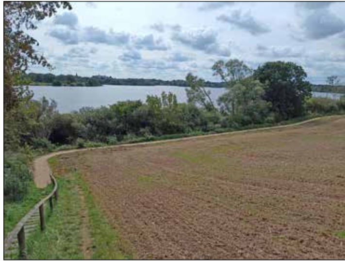
Der Weg von Rathensdorf nach Tramm wurde entlang des Trammer Sees saniert und aufgewertet.

Außerdem wurde ein Teilstück des Wanderweges, das sich in einem schlechten Zustand befand, grundlegend saniert. Es gewährt dadurch den Wanderern einen