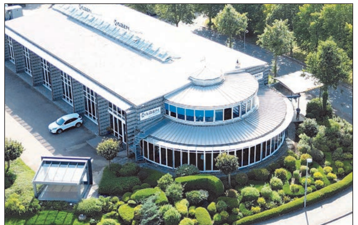
Am Freitag und Samstag lädt Firma Kaben zu den Solar-Tagen ein.

Bad Segeberg (t). Das renommierte Familienunternehmen Kaben, bekannt für seine hochwertigen Glas- und Aluminium-