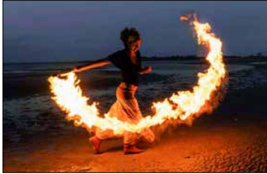
Eine kleine Feuershow wird den Besuchern auch geboten.