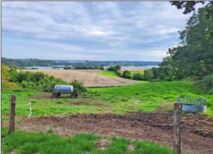
Der Aussichtspunkt mit Blick über die Seenlandschaft.

Rathjensdorf weiter, dann kommt man an einem besonders schönen Aussichtspunkt vorbei, die sogenannte Blink. Hier bietet sich ein atemberaubend schöner Blick auf Plön und die umgebende Seenlandschaft. Dankenswerterweise stellen der Eigentümer und der Bewirtschafter der Weide dieses schöne Plätzchen für die Allgemeinheit zur Verfügung. An dieser Stelle befindet sich nun eine neue Bank. Da die bisherige Bank altersschwach war, hat die Kommunale Wählergruppe Rathjensdorf aus Mitgliedsbeiträgen und Spenden eine neue finanziert und der Gemeinde übergeben.