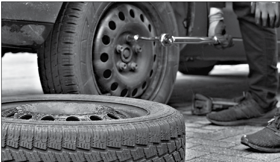
Winterreifen: Autofahrer sollten jetzt schon an den Reifenwechsel denken.

Ostholstein (t). Der Blick auf den Wetterbericht macht es deutlich: Nicht nur kalendrisch hat die Herbstsaison begonnen. Dichte Regenwolken, herabfallendes Laub und ein Temperaturschwung läuten nach den letzten Spätsommertagen endgültig die kalte Jahreszeit ein. Höchste Zeit also, das Auto fit für Herbst und Winter zu machen. Welche Handschläge jetzt getan werden müssen, verrät der TÜV-Verband (VdTÜV).