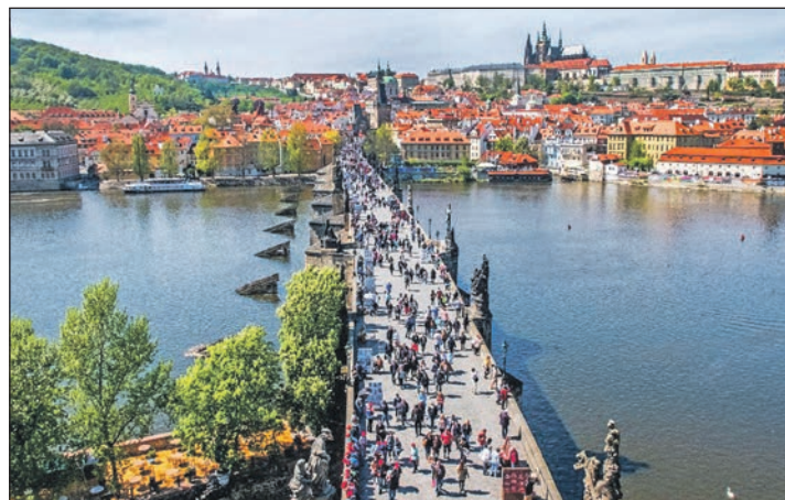
Die „Goldene Stadt“ Prag genießen unsere Leser zum Superpreis zu Top-Terminen.

Genießen Sie auf Schritt und Tritt Geschichte und Kultur, denn nirgendwo auf der Welt ist ein historischer Stadtkern in derartiger Vollständigkeit und Schönheit erhalten geblieben und zu bewundern: Bei unserer großen Stadtrundfahrt / Stadtführung mit unserer so beliebten deutschen