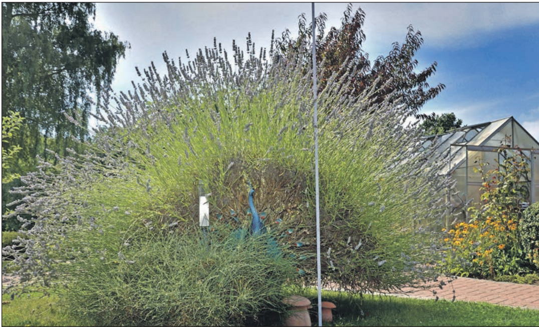
Manche Lavendelsorten können so groß werden, dass sie sich auch als Hecke und Sichtschutz eignen.

Lavendel kann abhängig von dem Grad seiner Verholzung etwa um ein Drittel bis zur Hälfte gekürzt werden, junge Pflanzen mehr als ältere, und stets im frischen belaubten Teil der Pflanze. Ein zweiter Korrekturschnitt kann auch noch einmal Ende April sinnvoll sein, um den Lavendel in eine schöne runde Form zu bringen.