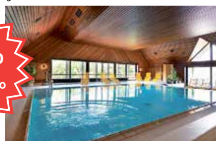
Hallenbad im Hotel