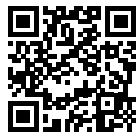
Angebot online Autohaus-Ost.de/polo

Polo Life 1,0 I 59 kW (80 PS) 5-Gang Kraftstoffverbrauch (Benzin) in l/100 km innerorts – (NEFZ), außerorts – (NEFZ), kombiniert – (NEFZ) / 5,4 (WLTP). CO 2 -Emissionen kombiniert in g/km: – (NEFZ) / 123 (WLTP). Effizienzklasse: –.