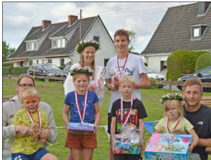
Die Muchelner Kinder und Jugendlichen wetteiferten um die Königswürde 2023.

Jedes Kind hatte sich einen Superpreis verdient. König und Königin