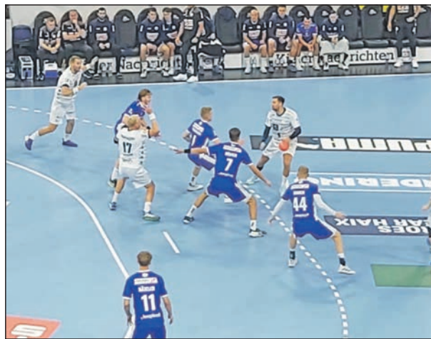
Drei Siege: Weiße Punkteweste beim THW.