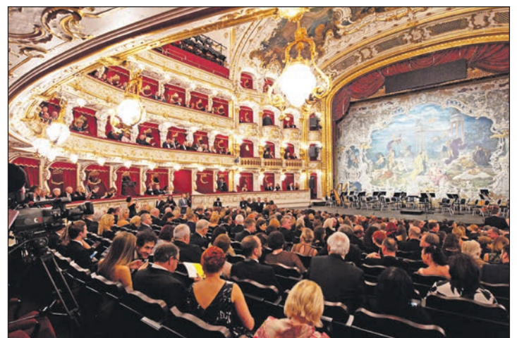
Eines der schönsten Opernhäuser in Europa: Die komplett restaurierte Oper Prag im Herzen der Stadt.

Bei beiden Terminen sind nach Verfügbarkeit Eintrittskarten in allen Kategorien für Mozarts „Zauberflöte“ in opulenter Ausstattung und in deutscher Sprache bei den Kurier-Leser-Reisen zusätzlich zur Reise zu buchen.