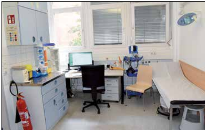
Ambulante Fälle werden direkt in der Anlaufpraxis hausärztlich behandelt.

versehen in der Anlaufpraxis ihren Dienst. Den Umbau des zentralen Ambulanz- und Aufnahmebereiches, inklusive der Anlaufpraxis, hat die Preetzer Klinik in Eigenregie übernommen, unter Einbeziehung externer Firmen. Verbunden damit war auch die Vorbereitung einer Infektionsambulanz, im vorderen Bereich im Erdgeschoss. „Hier können wir im Pandemiefall ein Behandlungszimmer jederzeit und sofort als zentralen Raum für