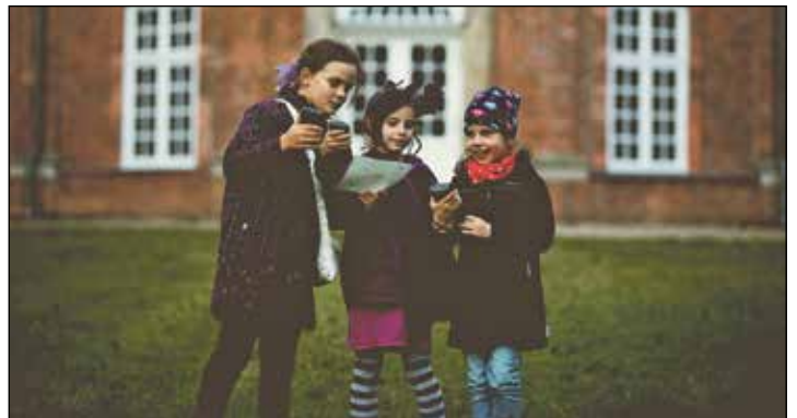
Am Sonnabend, 12. August, beginnt um 20.30 Uhr die nächste „Fledermaus-Safari“ durch das Plöner Schlossgebiet.

Die Anmeldung erfolgt wochentags im Naturparkhaus in Eutin, Robert Schade Straße 24, telefonisch unter 04521 - 77 56 540. Erwachsene zahlen 6 Euro, Kinder 3 Euro, Familien 13 Euro für die Teilnahme.