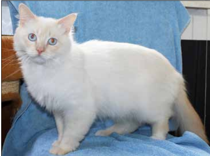
Zwei bildhübsche Kater - aufgefunden in Schellhorn.

Daher liegt es nahe, dass die beiden Kater entweder ausgesetzt wurden oder ausgebüxt sind und nicht mehr nach Hause zurück gefunden haben. Bis sich jemand meldet oder Angaben zu den Tieren machen kann, wohnen sie bei uns im Tierheim. Wann immer