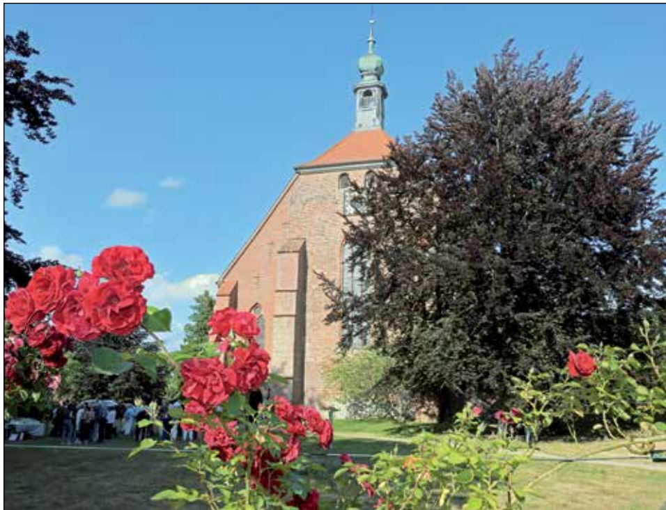
Die vierteilige Konzertreihe des Kreises der Musikfreunde beginnt am Montag, 7. August. In der Preetzer Klosterkirche musiziert das Holzbläserensemble „Sigandor Quintett“.