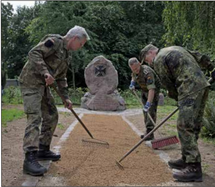
Die Reservistenkameradschaft half bei der Wiederherstellung der Wege, Soldaten der MUS reinigen die Kreuze der Kriegsgräber...

niskirche wurde 1871 die Friedenseiche gepflanzt. Noch fünf Jahre zuvor war Schleswig-Holstein ein Teil Dänemarks gewesen. Wo sich der Apfelgarten und der Kadettenfriedhof befinden, war die Halbinsel vor 1870 als Teil des Landschaftsparks ganz anders ausgestaltet. Hierfür hatte König Christian VIII gesorgt, der in Plön in den 1840er Jahren seine Sommerresidenz hatte. Seinetwegen erhielt auch das ehemals rotbraune Schloss, im Kern ein Backsteinbau, einen weißen Anstrich samt schwarzem Schieferdach - und damit sein heutiges Aussehen.