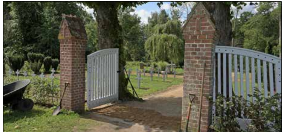
Das Tor zum Alten Apfelgarten wurde im Rahmen der Instandsetzung des Kadettenfriedhofs restauriert.