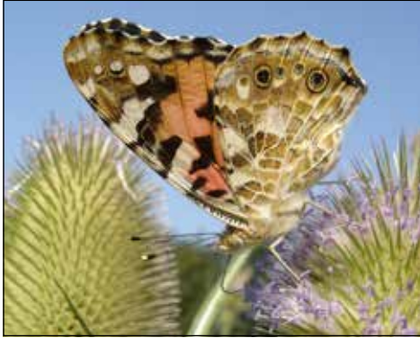
Distelfalter auf Kardenblüte.

Die Arbeit des Abbauteams im Wurmkomposter wird nicht nur sichtbar, sondern auch hörbar gemacht. Bitte wochentags anmelden: 04521 - 77 56 540. Kosten: Erwachsene 6 Euro. Treffpunkt ist die Alte Schlossgärtnerei, Schlossgebiet 9a, 24306 Plön.