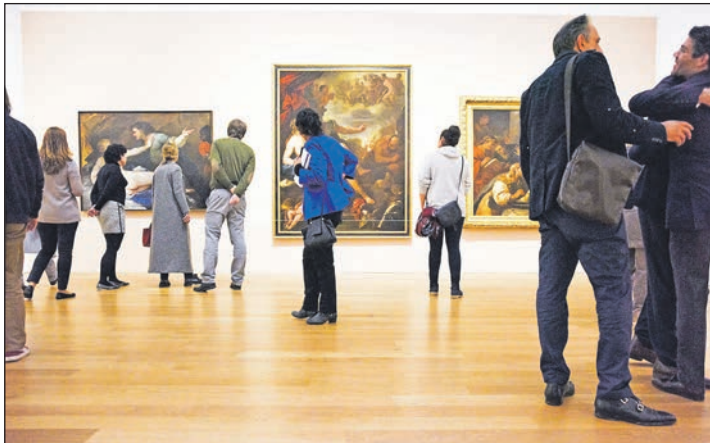
Das derzeit berühmteste Kunst-Museum Europas erwartet unsere Leser in Potsdam mit dem Barberini-Museum mit der sensationellen neuen Impressionisten-Ausstellung.

Top-Termin vom 15. bis 17. August 2023 zum sehr günstigen Komplettpreis von nur 475,00€ genießen unsere Leser inklusive Eintritt ohne Warteschlangen und inklusive Hin- und Rück-Transfer das weltberühmte Barberini-