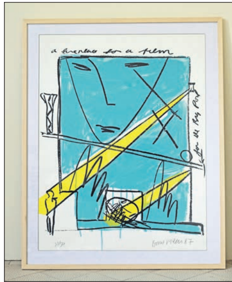
Gemälde des schottischen Künstlers Bruce McLean aus dem Jahr 1987, der unter anderem 1999 als Gastprofessor an der Staatlichen Hochschule für Bildende Künste in Frankfurt (Main) lehrte.

Dieser Vorspann motivierte einen reizbaren Be-