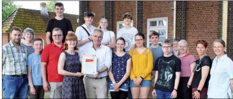
Die Teilnehmenden, die Verwaltung sowie die Politik wollen den in Gang gesetzten Jugendbeteiligungsprozess in Preetz auch in Zukunft fortführen.