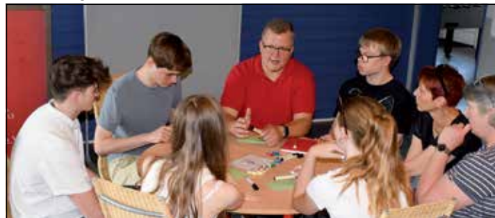
Wie können feste Beteiligungsstrukturen für ihre Ideen in Preetz geschaffen werden? – Jugendliche diskutierten mit Stadtvertretern über verschiedene Möglichkeiten.