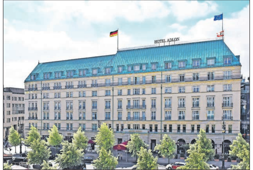
Das „berühmteste Hotel der Welt“ am Pariser Platz in Berlin können die Reporter-Leser im August 2023 ausführlich genießen.

Museum in Potsdam mit der gerade frisch eröffneten großen Sonder-Ausstellung „Holland in Potsdam“ mit mehr als 100 Meisterwerken von 40 Künstlern, darunter Vincent van Gogh, Jongkind, Piet Mondrian u.v.a. mit Leihgaben unter anderem aus dem Reichsmuseum Amsterdam, dem Kunstmuseum Den Haag und dem Kröller-Müller-Museum. Zum großen Leistungspaket der Reporter-Leser-Reise gehören neben der Busfahrt direkt ab Preetz und Plön im