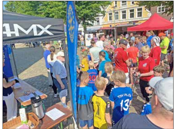
„Jede Runde hilft“: Da ließen sich sich die Plöner*innen im letzten Jahr nicht lang bitten.

Marktplatz in Plön verkauft oder können schon vorher in Plön in der Praxis Dr. Quack, Lange Str. 1A und in der Praxis Dr. Stein,