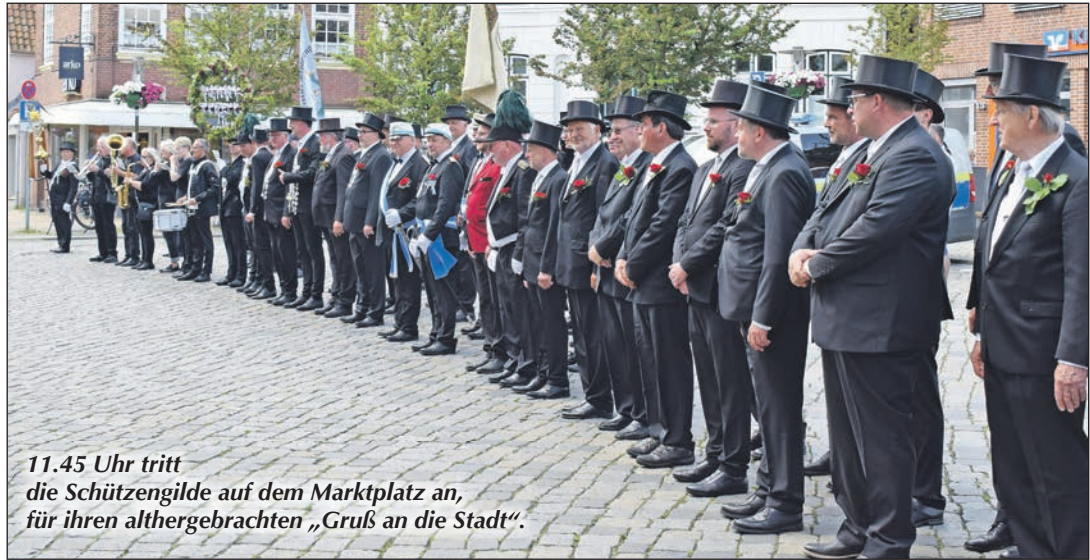
11.45 Uhr tritt die Schützengilde auf dem Marktplatz an, für ihren althergebrachten „Gruß an die Stadt“.

in letzter Zeit eingetreten sind, junge Familien mit Kindern. Auch diesen soll an diesem Tag etwas geboten werden, wenn der öffentliche Teil des Schützenfestes beginnt. Ganz nebenbei können Feuerwehr und THW für ihre Jugendarbeit werben, so Schneider. Sowohl die Blaulichtorganisationen als auch die Schützen profitieren somit von dieser sehr engen Kooperation. Getränke können auf dem Kinderfest beim Caterer im Festzelt erworben werden. Um 16 Uhr finden sich die Gildedamen zur gemeinsamen Kaffeetafel und