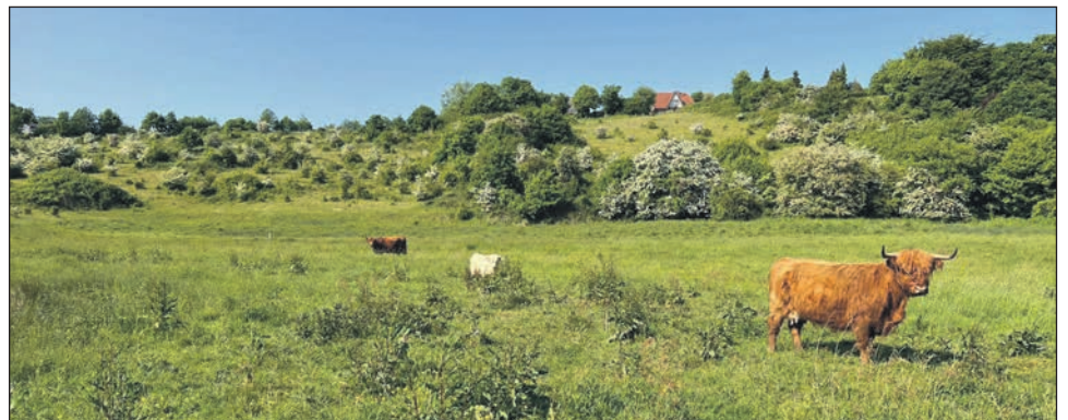
Highlandrinder am Hessenstein.

wider. Wir zeigen unser Stiftungsland und begeistern mit den vielen Natur(schutz)erlebnissen Schleswig-Holsteiner und unsere Gäste!“ Beim Auftakt am vergangenen Sonntag der Outdoor-Eventreihe im Stiftungsland Hessenstein nördlich von Lütjenburg fanden die Besucher auf den wilden Weiden, alles, was das Naturgenuss-Herz begehrt. Inmitten der Idylle aus weißen Wiesenmargeriten, blühenden Rosen und glücklich grasenden Highland-Rindern haben die Veranstalter des Naturgenussfestivals, die Stiftung