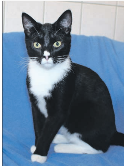
Dino und Dala (re.)

Kossau / Lebrade (t). Auch in dieser Ausgabe wollen wir Ihnen wieder tolle Bewohner des Tierheims Kossau-Lebrade vorstellen, die ein neues und liebevolles Zuhause mit großem Garten suchen. Heute ist es das Geschwisterpaar Dino und Dala. Die beiden sind sieben Monate alt und wurden Anfang des Jahres aufgefunden. Dala hat schwarzes Fell und nur am Latz eine zarte weiße Färbung. Dino ist schwarz-weiß. Besonders vorwitzig ist der weiße Punkt auf seiner Nase. Die jungen Racker sind stets gut gelaunt und von der ersten Sekunde an zutraulich. Beide freuen sich tierisch, wenn man sich in ihren Raum hinein setzt. Dann wurschteln die zarten Katzenkörper links und rechts um einen herum. Es wird aufgeregt-zufrieden geschnurrt