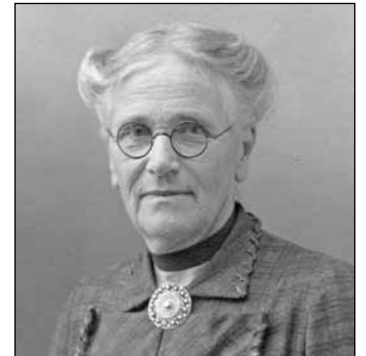
Marie Schwertzel war eine Wegbereiterin für die berufliche Ausbildung von Frauen im Gartenbau.

Plön die ‚Gartenbauschule Marienhöhe‘. Die etwa 90minütige Führung beginnt um 15 Uhr und kostet pro Person 6 beziehungsweise 5 Euro ermäßigt bei Vorlage einer gültigen ostseecard und für alle Plöner Bürger und Bürgerinnen (gegen Vorlage des Personalausweises). Wir bitten um Anmeldung bei der Tourist Info Großer Plöner See Bahnhofstraße 5 (Bahnhof) 24306 Plön, Tel. 04522 - 50950, Email: touristinfo@ploen.de . Weitere Termine sind für September und Dezember in Vorbereitung.