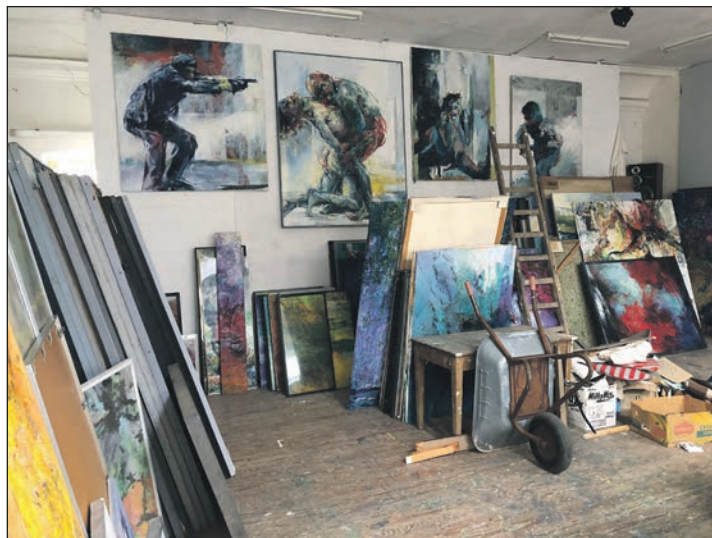
Viele Bilder vom Künstler Henning Rethmeier stehen zum Verkauf, um aus dem Erlös die Renovierung voranzutreiben.

Am 22. April 2023 ist es dann zum ersten Mal soweit: der Gadendorfer Krug ist ab 14 Uhr für die Allgemeinheit geöffnet, die Mitglieder des Panker Kultur e.V. stehen dann für Fragen und Informationen zu diesem tollen Projekt zur Verfügung, aber auch für Anregungen, Gedankenaustausch etc. Und selbstverständlich können auch Werke von Henning Rethmeier an diesem Tag schon käuflich erworben werden, bevor eine