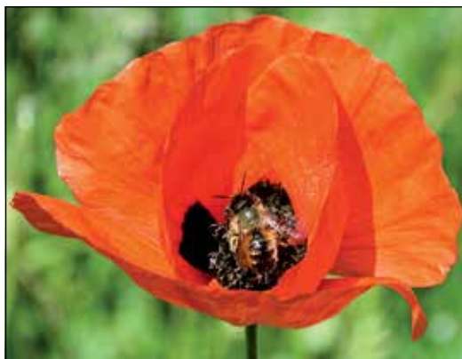
Flächen einsäen statt versiegeln: Wer auf Pflanzenvielfalt setzt, hilft dem Klima und bei der Wahl geeigneter Spezies auch den Insekten.

Bredeneeker Gespräche des Fördervereins Bürgerschloss Bredeeneek zum Thema „Synthetische Kraftstoffe – zielführende Idee oder Energieverschwendung?“ mit Referent Dr. Sönke Harm von der CAU Kiel.