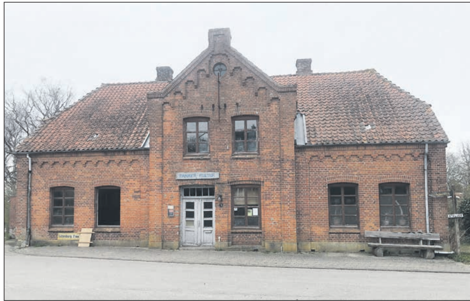
Auf den Verein Panker-Kultur e.V. wartet noch viel Arbeit, aber bald soll das historische Gebäude regelmäßig die Pforten öffnen.