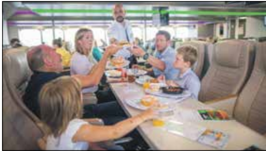
Stilvoll und komfortabel mit bestem Gastro-Service an Bord geht es in bequemen Bord-Sesseln Kurs Helgoland.

schwindigkeits-Katamaran „Halunder Jet“ mit 65 Stunden-Kilometern direkt ab Hamburg. Auf völlig neuem Kurs wird dabei schon die genussvolle Überfahrt