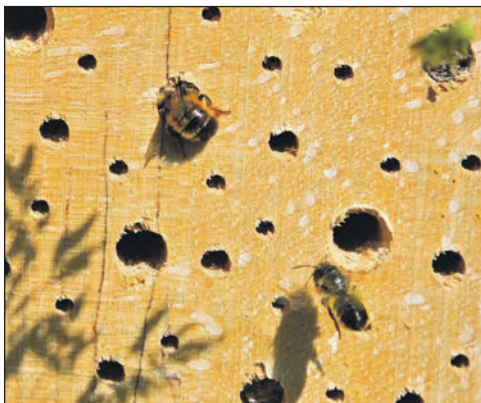
Solitärbienen an einem Insektenhotel in Rathjensdorf, Kreis Plön. Foto: Schneider

Auf der Blühwiese summt es. Die kurzlebigen Arten Klatschmohn und Kornblume werden von vielen Insekten bestäubt. Später werden diese Pionierpflanzen von den mehrjährigen Spezies wie Bocksbart, Klee, Weidenröschen oder Königskerze sowie verschiedenen Gräsern zurückgedrängt; nur auf freien Flächen können sich die Einjährigen halten, indem ihre Samen dort Platz zum keimen haben. Foto: Schneider