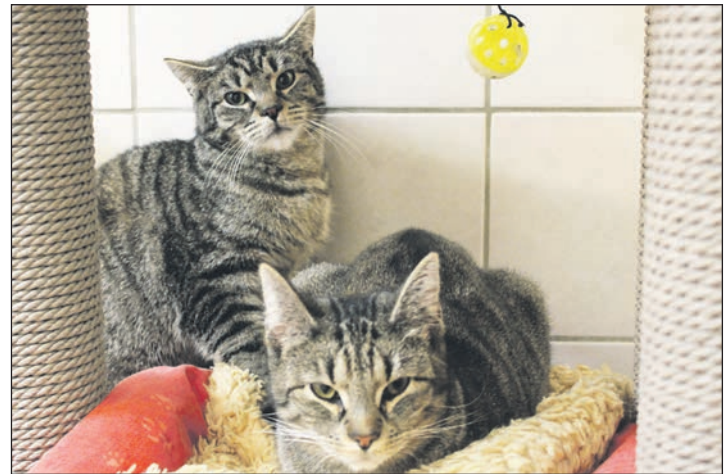
Rabea und Rico möchten am liebsten im Doppelpack umziehen.

An der B430 · 24306 Kossau/Lebrade · Tel. 04522 / 2389