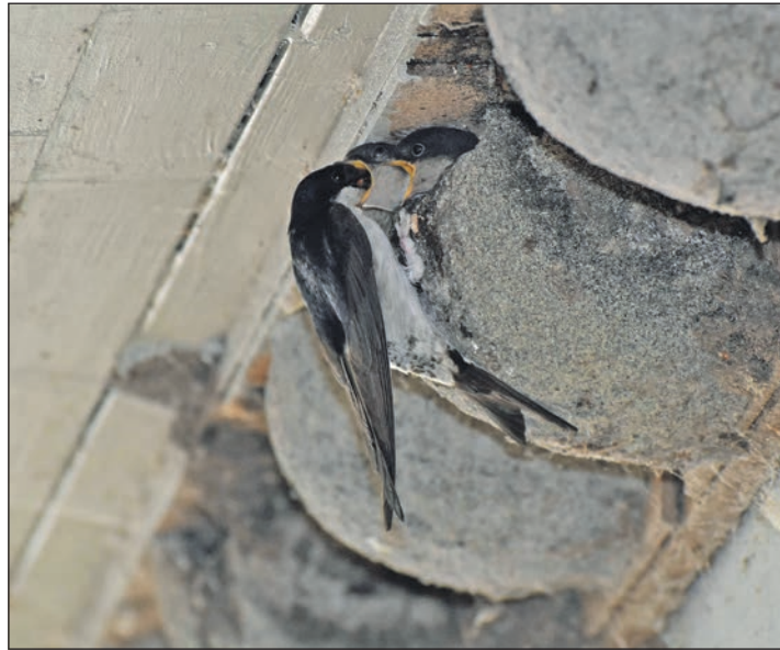
Im April kehren die ersten Mehlschwalben zurück und suchen Nistmöglichkeiten - am liebsten in einer Kolonie mit zahlreichen Artgenossen.

Plön (los). Vier Doppelkästen, acht Höhlen mit kleinem Einschluflloch: Mit einer Reihe neuer Brutplätze empfängt das Coop-Gebäude mit dem Rewe-Markt in der Plöner Innenstadt im Frühjahr 2023 die Mehlschwalben – eine Privatinitiative der Plöner Gerd Weber und Inge Unbehauen für mehr Tierschutz. Der Dachüberstand des Lebensmittelmarktes am Plöner Marktplatz ist ein begehrter Platz für Mehlschwalbenpaare. Einige ältere Doppelkästen hängen bereits seit etlichen Jahren. Sie sind von Spatzen bewohnt, die als Nischenbrüter ebenfalls solche Höhlen schätzen. Die Besiedlung der neuen Bruthöhlen lässt eine lebendige Nachbarschaft erwarten: Die ersten Mehlschwalben werden im April vom Vogelflug zurückkehren. Inge Unbehauen und Gerd Weber haben für die Vögel in Eigenregie die Anbringung einer schwalbengerechten Reihenhausausstattung initiiert. Die Coop als Eigentümerin der Immobilie unterstützte das Vorhaben, hier acht Bruthöhlen zu befestigen. Sinn der Aktion ist es, den Tieren geeignete Nistplätze zu bieten und den Blick damit auch auf ihr Problem zu lenken: Erfolgreich Nester zu bauen. Denn an diesem Standort schlugen ihre Versuche fehl, hat Inge Unbehauen beobachtet.