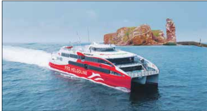
Mit Hochgeschwindigkeit zur Felseninsel Helgoland: Die Reporter-Leser-Reisen präsentieren ein spektakuläres High-Speed-Erlebnis Kurs Helgoland.

zum Top-Erlebnis: Ob auf den Freidecks oder den für unsere Leser fest reservierten, bequemen Komfort-Sesseln im Innenbereich mit großen Panorama-Fenstern – überall erwarten die Reporter-Gäste neue Erlebnisse, die schon mit der spannenden Fahrt durch den Hamburger Hafen und die große Elbe-Kreuzfahrt via Cuxhaven beginnen. Von dort aus dau-