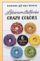
Crazy Colors Lebensmittel- farbe 24-g-Packung (1 kg = 82,92 €)