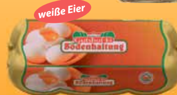
Gutshof-Ei 10 Eier aus Bodenhaltung KL, M-L