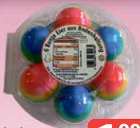
Osterstern Regenbogen-Eier 6er-Packung