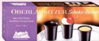
Oberlausitzer Schoko-Becher 125-g-Packung (1 kg = 14,32 €)