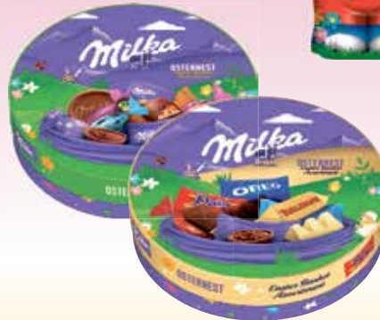
Milka Osterfest oder Osterfest Friends 202/196-g-Packung (1 kg = 19,75/20,36 €)