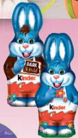
Ferrero Kinder- schokolade Harry Hase Vollmilch oder Dark & Mild 110-g-Stück je (1 kg = 18,09 €)