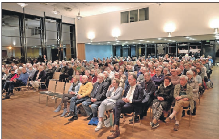
Zahlreiche Besucher nutzten die Veranstaltung in der Aula des Friedrich Schiller Gymnasiums, um sich einen Eindruck zu verschaffen.

Denn die Beschlussfassung und damit den gestalterischen Pro-