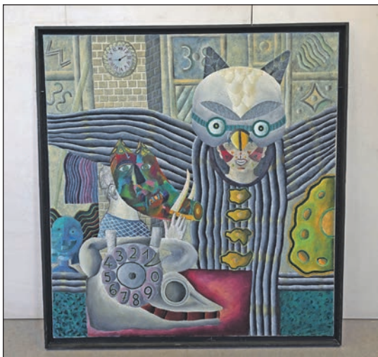
Kurator Dieter Pape lädt dazu ein, die Ausstellung im Kulturforum zu erkunden und die Bilder auf sich wirken zu lassen.