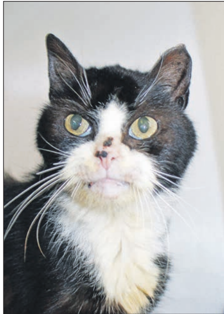
Sorgenkinder: Wer bringt viel Zeit und Liebe für Bella (l.) und Smilla auf?

Wer Erfahrung mit Katzen hat und viel Zeit und Liebe für Bella aufbringen kann, sollte sie ein paar Male im Tierheim besu-