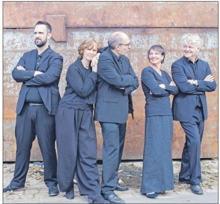
Fünf Improvisationskünstler treten in Plön auf: Das Quintett „Schraag – barockcrossover“ verbindet die Musik der alten Meister mit modernem Jazz.

Plön/ Eutin (t). Ein weiteres Konzert „auf dem Weg zum Bachfest“ der Kirchengemeinden Plön und Eutin: Am Sonnabend, 1. April 2023 findet um 18 Uhr in der Nikolaikirche in Plön ein Crossover Konzert mit der Gruppe „Schraag – barockcrossover“