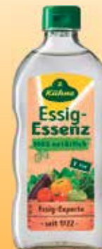
Kühne Essig-Essenz 400-g-Flasche (1 kg = 2,48 €)