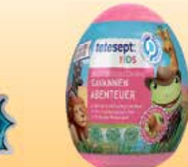
tetesept Kids Badeüberraschung 140-g-Ei je (1 kg = 21,36 €)