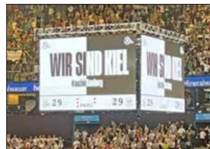
Der Zusammenhalt Fans/Team stimmt beim THW.

Gummersbach (2. 4. 23) trägt zwar einen großen Namen, an die starken Zeiten der Vergangenheit konnte man aber bisher nicht anknüpfen. Trotzdem wird die Reise kein Selbstgänger, siehe das Hinspiel. In der heimischen Wunderino-Arena gab es einen knappen 31:28-Erfolg. Die Zebras sind, auch wenn man Spiele wie gegen Lemgo oder das erwähnte Leipzig-Match noch in guter Erinnerung hat, natürlich Favorit auf die beiden Pluspunkte. Diese sollten die Mannschaft auch einfahren, denn die kom-