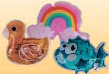
Duschgel 50-ml-Kissen je Abbildungsbeispiel (1 Liter = 13,80 €)