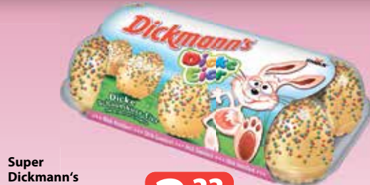
Super Dickmann's Dicke Eier 8er 206-g-Packung (1 kg = 10,78 €) nur solange der Vorrat reicht