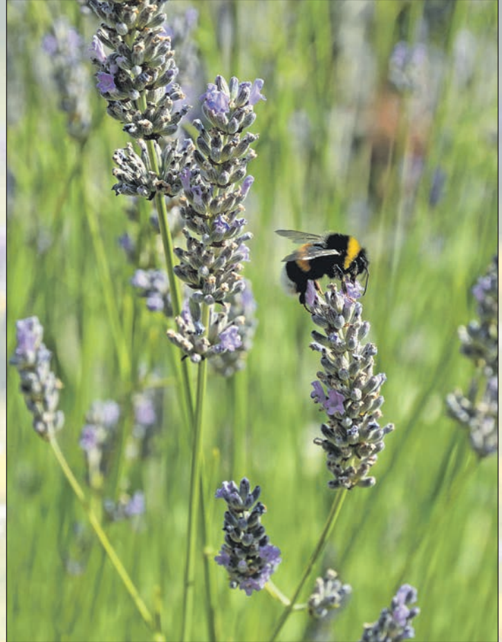
Wenn Lavendel regelmäßig zurückgeschnitten wird, verzweigt er sich kompakt und blüht üppiger.

und Glockenblumen gehören zu den insektenfreundlichen Arten. Bei Wildbienen beliebt sind zudem Sträucher wie Kornelkirsche, Alpenjohannisbeere, Felsenbirne, Feldahorn, Holunder, Sal-Weide, Schneebeere, Spitzblättrige Mispel und Efeu (Altersform), das im späten Herbst ergiebige Blüten bildet. Bienen wie auch alle anderen Insekten brauchen außerdem Wasser. Gibt es im Garten keinen Teich, sollten Hausbesitzer eine flache Insektentränke einrichten. Es eignet sich zum Beispiel ein Tonteller mit Wasser und Steinchen, auf denen die Tierchen gut Platz nehmen können.