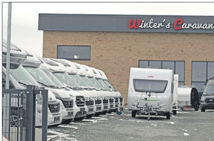
Ob Wohnwagen, Reisemobil oder Zubehör: auf der Hausmesse können sich die Besucher im Winter's Caravan Center umfassend informieren.

Auch wer mit einer Neuanschaffung liebäugelt, kann sich am Wochenende eingehend informieren. Neben verschiedenen Wohnwagen stehen auf der Hausmesse zahlreiche Reisemobile bereit, Modelle, die vor Ort direkt verglichen werden können. Da gibt es zum Beispiel den Kastenwagen als kleines kompaktes Reisemobil. „Eine smarte Lösung für die Spontanen“, erklärt Steffen Winter. Zugleich sei es auch durchaus alltagstauglich. Das kleinste Modell enthält zwar kein WC, wohl aber die nächste Größe, „eine Art Zwischenlösung zum Reisemobil“, erläutert Steffen Winter. Das größte Pendant nennt sich Polar-Wohnwagen. Diese Luxusklasse eignet sich für Dauercamper wie für Reisende, die es weit in die Welt lockt. Der größte Händler in Europa für die Polar-Wohnwagen ist übrigens Winter's Caravan Center.