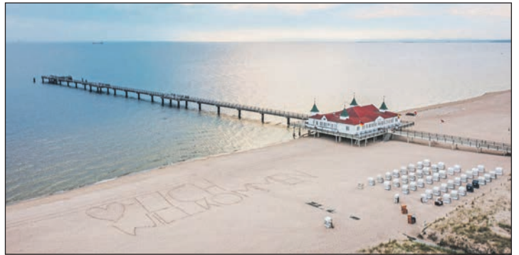
Deutschlands sonnenreichste Ostsee-Insel erwartet die Reporter-Leser zum Top-Termin des Jahres zu Pfingsten.

Zum großen Leistungspaket der Reporter-Sonder-Reise direkt ab Preetz und Plön gehören neben der Fahrt im erstklassigen Fernreisebus drei Übernachtungen im Top-Hotel „Hilton by Hampton“ mit exklusiven Designer-Zimmern mit DU/ WC, TV etc., der Reporter-Begrüßungs-Cocktail im Hotel, 3 x großes Schlemmer-Frühstück vom Buffet sowie 3 x Abendessen im Hotel als Schlemmer-Buffet oder 3-Gang-Menü. Bereits auf der Anreise erfolgt der Besuch der alten Hansestadt Stettin mit großer Stadtrundfahrt mit Reiseleitung und Freizeit, am 2. Tag eine große Insel-Rundfahrt Use-