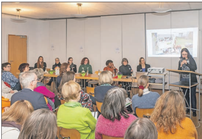
Sieben Frauen stellen ihre Projekte vor.

Das Freiwilligenzentrum im Kreis Plön vernetzt und unterstützt ehrenamtliche Organisationen und