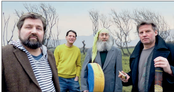
Für den guten Ton in Preetz: The Inner Tradition spielt Sonnabend in der Kirchenstraße.