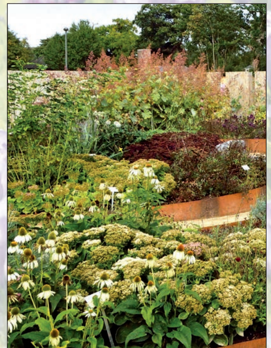
Darauf fliegen Biene & Co: Schein-Sonnenhut (Echinacea) und üppig blühende Fetthenne (Sedum telephium) in verschiedenen rötlichen und graugrünen Blattfarben.

material eingebracht werden kann, ein wertvoller Lebensraum, der mit blühenden Ranken wie etwa