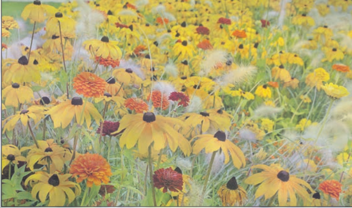
Sonnenhut und Zinnien locken zahlreiche Insekten mit kräftigen Farben.

Kapuzinerkresse attraktiv bepflanzt werden kann. Insektenfreundlich, weil nektar- und pollenreich, sind zum Beispiel Stauden wie Sonnenhut sowie auch der Schein-Sonnenhut (Echinacea). Gern wird auch Lavendel angefliegen, ferner das Johanniskraut und Mädesüß als heimische Wildstauden sowie Majoran und Thymian, die Arten der Königskeuze sowie die blau blühende Ochsenzunge und der ihre verwandte Natternkopf, die zwar kurzlebig sind, sich aber am geeigneten Standort gern versamen. Auch die Malvenarten, wilde Möhre, Christ- und Lenzrosen sowie Winterheide