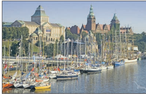
Die alte Hansestadt Stettin entdecken unsere Leser bei der großen Stadtrundfahrt mit Reiseleitung.

dom mit perfekter Reiseleitung unter dem Motto „Noble Kaiserbäder“ mit Ahlbeck, Heringsdorf, Bansin. Am 3. Tag vormittags besteht die Gelegenheit zur großen Erlebnis-Schiffahrt „Geheimtipp Swinemünde & Kanalfahrt“ (2 Stunden) mit Hafen-Rundfahrt Swinemünde, Panoramafahrt auf der Swine zum Vogelreservat & Kreuzfahrt auf der berühmten „Kaiserfahrt“ mit einem Sonder-schiff zum Aufpreis pro Person von nur 14,90 Euro, gefolgt am