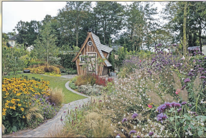
Bienenweide mit Sonnenhut (links) und einem Ensemble aus Präriekecke und Patagonischem Eisenkraut als Schmetterlingsmagnet.

Wichtig auch: Verblühte Stauden und einjährige Blumen sollten Gartenbesitzer nie im Herbst, sondern erst im Frühling zurückschneiden. Denn die Stängel nutzen viele Insekten, um dort zu überwintern beziehungsweise ihre Larven geschützt heranwachsen zu lassen. Aus diesem Grund sind auch sogenannte Totholz- oder Benjeshecken, in die abgestorbenes Ma-