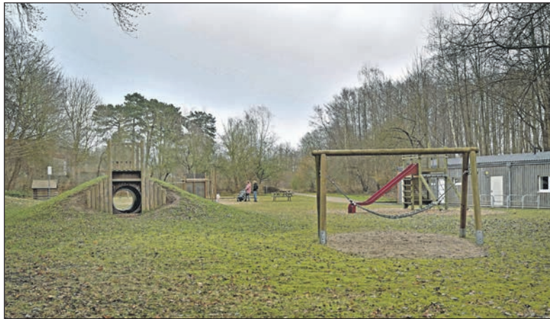
Ein Grundstück mit Potenzial für den nächsten Kindergarten: Wird der Spielplatz „Suhrer Seeblick“ in der Walter-Volkers-Straße in Plön-Stadttheide einem möglichen Neubau weichen?

Ebenso seien die in der Tagespflege Tätigen ausgelastet. Weitere Tagesmütter oder -väter zu akquirieren, wie Bettina Hansen (SPD) in der Sitzung anfragte, sei schon in der Vergangenheit schwierig gewesen und daher keine Option, erläuterte Springer. Auch das derzeit ungenutzte Gemeindehaus der Evangelisch-Lutherischen Kirchengemeinde Plön am Steinbergweg könne nicht für die Kinderbetreuung verwendet werden, da es „baulich nicht in der Verfassung ist, dass man Kinder dort unterbringen kann“, führte Elke Springer aus. „Es müsste viel umgebaut