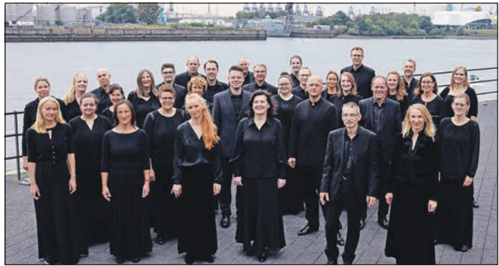
Die musikalischen Botschafter der Hansestadt Hamburg feiern mit einem großen Gala-Konzert in der Elbphilharmonie Hamburg.

zunehmend das stolze hanseatische Jubiläum gemeinsam mit dem Orchester des bekannten „Thüringer Bach Collegiums“ und zahlreichen prominenten Solisten an der Elbe mit einem hochklassigen Programm fröhlich feiert. Die Konzert-Sonderfahrt mit Bus direkt ab Lütjenburg und Plön inklusive Eintrittskarten zum Fest-Konzert ist bereits ab 49,90 Euro ab sofort bei den Reporter-Leser-Reisen des Burg-Verlages in Eutin, Telefon 04521/701130 ,