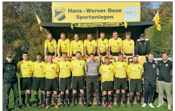
Aktuell Tabellenfünfter: Die Bösdorfer Herren.

Für den THW Kiel geht es nach DHB-Pokal und Champions-League endlich in der Bundesliga weiter, dies sogar mit einem Heimspiel. Gegner wird am 18. Februar 2023 (20.30 Uhr) in der -natürlich-ausverkauften Wunderino-Arena, der ASV Hamm sein. Acht Tage später reist der Rekordmeister dann nach Lemgo, der sich in der Vergangenheit doch zu einer Art „Angstgegner“ für