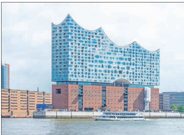
Ganz großer Konzert-Genuss für Reporter-Leser: Die Elbphilharmonie an der Elbe im Hamburger Hafen

Einheit anzubieten. Alle Kinder und Jugendlichen zwischen 7 und 16 Jahren werden nach dem Konzept der Nachwuchsakademie von Real Madrid trainiert und in ihrer Entwicklung unterstützt. Informationen und Anmeldung unter: www.asvdersau-fussball.de und https://frmclinics.com/