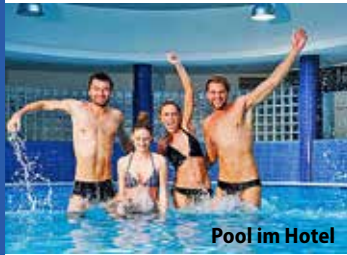
Pool im Hotel

Rügen mit Besuch im Seebad Binz mit Freizeit zur Mittagspause. Gegen Aufpreis von nur 15,00 € können Sie zusätzlich am 3. Tag eine große Insel-Rundfahrt Usedom mit Besuch der weltbekannten Kaiserbäder Bansin, Heringsdorf und Ahlbeck buchen. Rückfahrt mit Abstecher zur Mittagspause in die alte Hansestadt Stettin