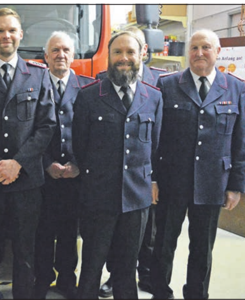
Die auf der Versammlung gewählten, beförderten und geehrten Kameraden.

Schröder schloss seinen Bericht mit den geplanten Anschaffungen für 2023. Eine Wärmebildkamera und ein Notstromaggregat werden für die Ausstattung des Fahrzeugs beschafft. Für die direkte Sicherheit der Kameradinnen und Kameraden sorgen zunächst sechs neue Helme, die die zum Teil in Jahre gekomme-