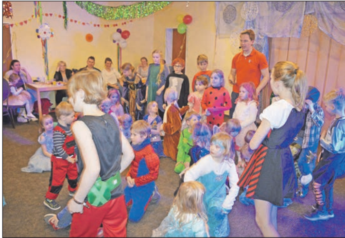
Die Tanzfläche beim Grebiner Kinderkarneval ist immer gut besucht!

Spielen und den Auftritten der Kinder- und Juniorengarde der Karnevalsgesellschaft Blau-Weiß Plön erwartet die Nach-