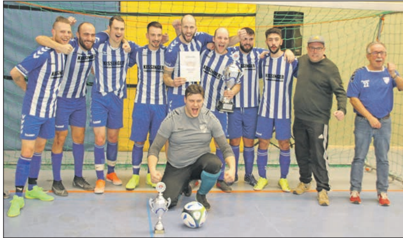
Die siegreiche Mannschaft vom TSV Plön