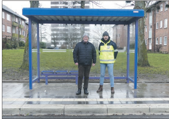
Wie hier in der Danziger Straße machen an vielen Bushaltestellen in der Stadt neue Buswartehäuschen das Warten auf den Bus ein bisschen angenehmer.

Plön (ed). Das Buswartehäuschen in der Danziger Straße steht kaum, da ist die Sitzbank auch schon besetzt und die Dame, die auf den Bus wartet, freut sich, dass sie das nicht mehr im strömenden Regen stehend muss, sondern im Sitzen und im Trockenen. Wie sie reagieren auch die anderen Busreisenden, die nach und nach ankommen, die Resonanz auf die neuen Buswartehäuschen der Stadt Plön ist durchweg positiv. Hell und offen und doch regengeschützt lässt es sich in ihnen auf den Bus warten, sogar einige Sitzplätze gibt es, die das Warten erleichtern. Zusammen mit Michael Olesch, dem für den Haltestellen-Umbau zuständigen Tiefbauer der Stadt Plön, freut sich der Plöner Bürgermeister Lars Winter darüber, wie gut die neuen Bus-