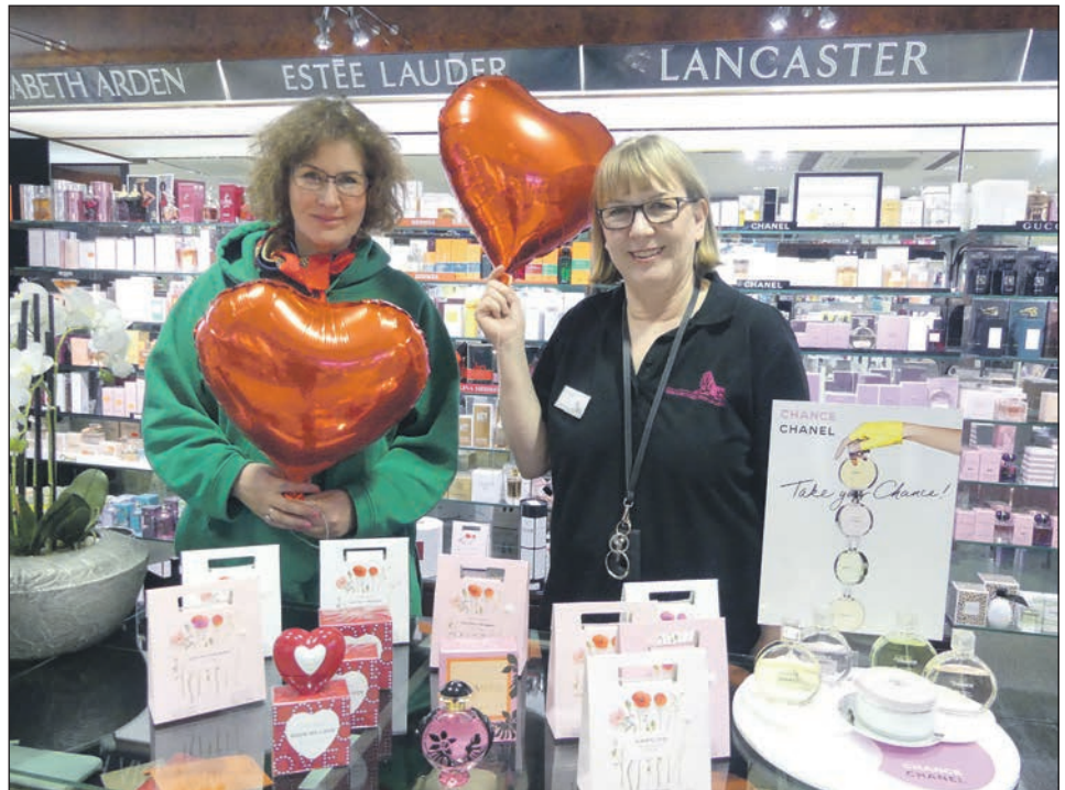
Zum Valentinstag schenkt das Gesundheitszentrum am Löwen seinen KundInnen 14 Prozent Valentinsrabatt am 14. Februar.