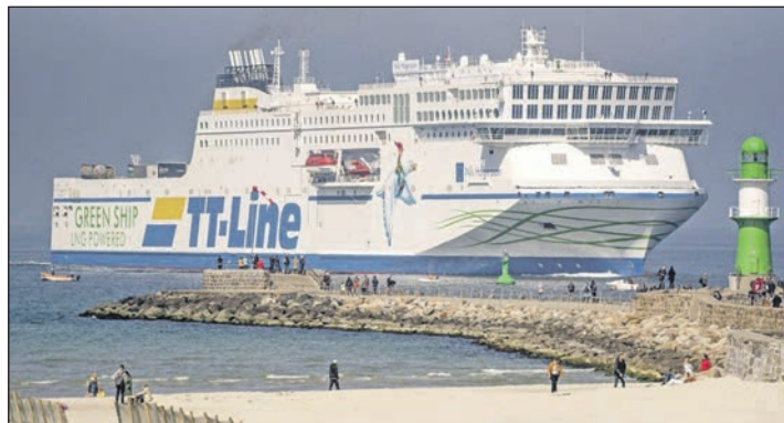
Unterwegs mit den Jumbo-Linern der TT-Line zum großen Jubiläum Kurs Schweden

Zum großen Leistungspaket zum absoluten Jubiläums-Knüllerpreis „60 Jahre TT-Line“ von nur 199,90 Euro gehören neben der Fahrt im erstklassigen Fernreisebus mit Waschaum/WC und Klimaanlage ab / bis Preetz und