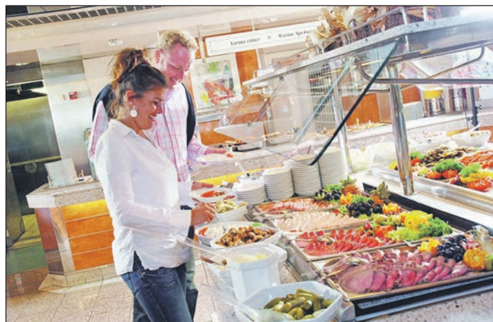
der Märchenschiffe auf dem Hin- und Rückweg rundum verwöhnt

Pfingsten vom 27. bis 29. Mai 2023 mit einer dreitägigen „Jubiläums-Kreuzfahrt“ mit Bus und Jumbofähren nach Schweden: Die Einschiffung von Bus und Fahrgästen erfolgt in Travemünde auf Entdecker-Kurs Nord. An Bord werden die Reporter-Leser mit schwedischen Schlemmer-Spezialitäten preisinklusive rundum verwöhnt und Sie genießen die komfortable Überfahrt auf dem Jumbo-Liner mit kostenloser Benutzung der herrlichen Sonnendecks zum entspannen. In Malmö erwartet die Reporter-Gäste sodann ein neueröffnetes internationales First-Class-Top-Hotel in der südschwedischen Hafen-Metropole mit modernsten Komfort-Zimmern und dem leckeren Frühstück vom Buffet für zwei Nächte. Am zweiten Tag ist eine große Stadtrundfahrt mit fachkundiger, deutschsprachiger Reiseleitung zu den Höhepunkten Malmö, eine der schönsten Städte Schwedens in malerischer