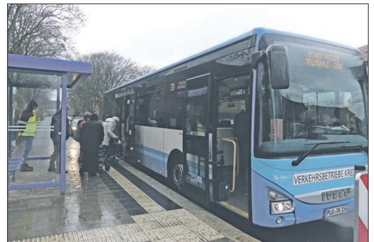
Für die endgültige Barrierefreiheit fehlen hier nur noch die Niederflurbusse.

sollen. An der Breitenauschule steht ein besonders großes Häuschen, damit alle SchülerInnen und ihre Beleitpersonen im Trockenen auf den Bus warten können – „bisher standen entweder alle im Regen und wurden nass“, so der Plöner Bürgermeister Lars Witer, „oder alle haben im Gebäude gewartet und den Bus verpasst.“ 30.000 Euro kostet es allein, dazu kommen 12.700 Euro etwa für ein durchschnittlich großes Buswartehäuschen. Die Stadt Plön arbeite daran, so viele Bushaltestellen wie möglich barrierefrei und auch mit Wartehäuschen zu gestalten – Letzteres scheitere an den Kosten natürlich, aber auch weil oftmals der Grund nicht der Stadt gehört und sie nicht darüber verfügen kann. „So haben wir zum Beispiel in der Schillener Straße schlicht die Erlaubnis nicht, die fremden Flächen dafür zu nutzen.“ Auch die Barrierefreiheit werde nicht an allen Haltestellen gelingen, angenommen werden. Überall in Plön sind sie aufgetaucht und hätten das auch schon viel früher tun sollen, aber das sei wie so vieles in dieser Zeit an Schwierigkeiten gescheitert, berichtet Michael Olesch. Jetzt