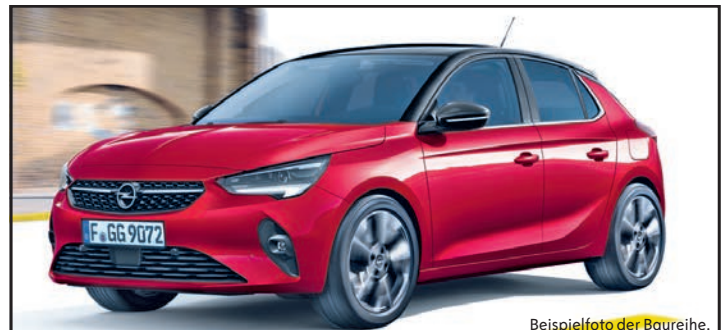
Beispielfoto der Baureihe. Ausstattungsmerkmale ggf. nicht Bestandteil des Angebots.

Rufnummer 04342-10 770 mit der Preetzer Polizei in Verbindung zu setzen.