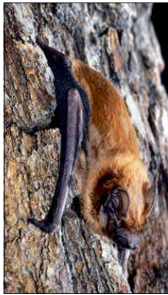
Die Fledermäuse sind zwischen den alten Gebäuden und Parkbäumen im Plöner Schlossgebiet gut zu beobachten.

Bevor es los geht, werden noch spannende Fragen zu ihrer Lebensweise geklärt: Wie können die Fledermäuse bei völliger Dunkelheit Nahrung finden?