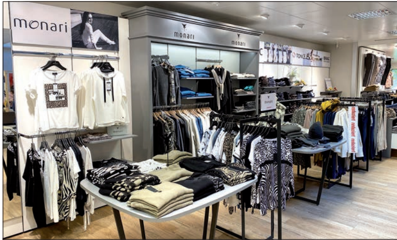
Das Modehaus Mews Team freut sich auf Ihren Besuch!

Mews ist jetzt die aktuelle Ware namhafter Hersteller wie Tommy Hilfiger, Brax, Monari, Camel Active, Olymp, Opus, Ragwear und Calvin Klein eingetroffen. Grund genug, sich von dem vielfältigen Bekleidungsangebot inspirieren und vom kompetenten Team des Modehauses zu gelungenen Farbkombinationen, dem geeg-