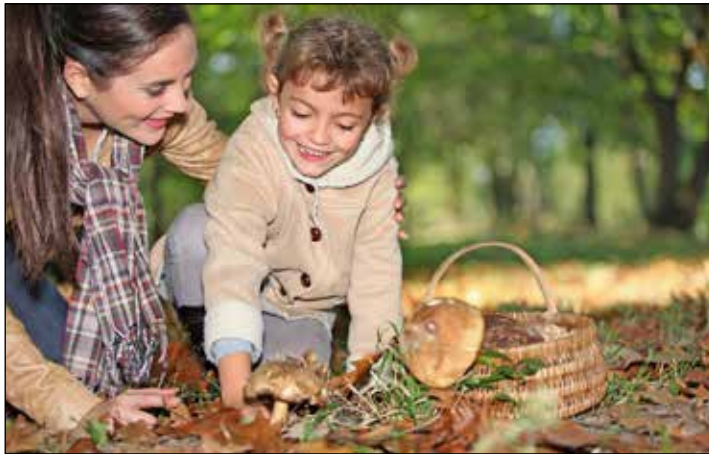
Beim Pilze sammeln ist im Kreis Plön in den nächsten Wochen besondere Vorsicht geboten, denn manche Pilze haben giftige Doppelgänger.

Kreis Plön (t). Wegen der milden Witterung sind die Wälder im Kreis Plön in diesem Jahr ein besonderes Paradies für Pilzsammler. Allerdings ist Vorsicht geboten. Denn je mehr Pilze es gibt, desto größer ist auch die Gefahr von Vergiftungen. Nach Aussagen des Giftinformationszentrums-Nord steigt die Zahl der Pilzvergiftungen insbesondere in den feuchten Herbstmonaten, die mit milden Temperaturen hergehen, spürbar an. „Viele der leckeren Pilze haben giftige Doppelgänger. Für Hobbysammler kann dies gefährlich werden“, warnt AOK-Serviceleiter Reinhard Wunsch.