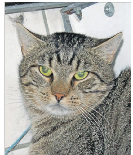
... und der große Anton suchen liebevolle „Katzenversther“, die ihnen mit Ruhe begegnen und auf ihre Bedürfnisse eingehen.

Wenn Sie sich für Hannes oder Anton interessieren, rufen Sie uns gerne unter der Telefonnummer