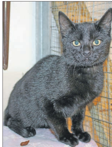
Der kleine Hannes ...

An der B430 · 24306 Kossau/Lebrade · Tel. 04522 / 2389