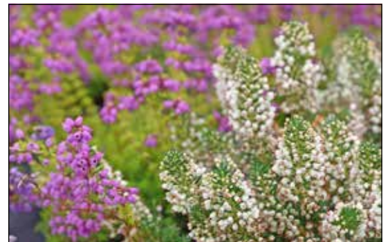
Die Cornwallheide ist eine der Spezies im aktuellen Herbstsortiment und bei Bienen beliebt.