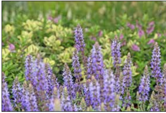
Immer eine Insektenweide: Manche Salbeiarten blühen bis in den Herbst und tupfen blaue Farbe ins Beet.

ßer die Pflanzengruppen einer Spezies, desto schöner die Ausstrahlung, gerade im Staudenbeet – aber auch für Zwiebelblumen gilt dies. Es lohnt sich daher beim Überplanen eines Gartenbereichs ein paar größere Inseln für Krokus und Co freizuhalten. So