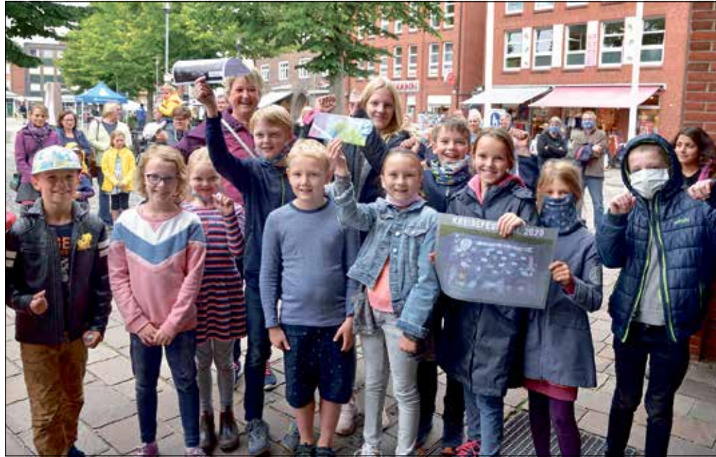
Jubel bei der OGTS Selent: Die Kinder wurden von der Jury des Kreidefestivals zum Team-Sieger gekürt.