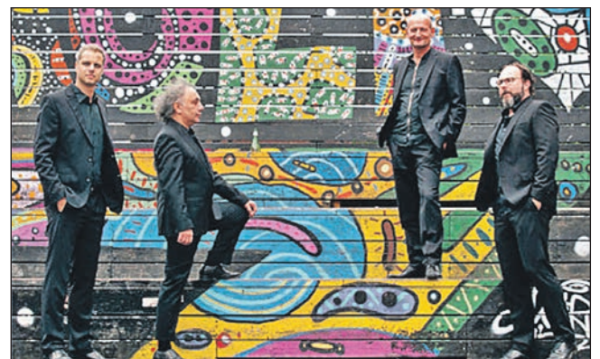
Das Jourist Quartett spielt in Filippus Erlebnispark.