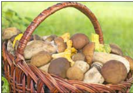
Nur gute Kenntnisse der einheimischen Pilze schützen vor möglichen Vergiftungen.

den. Den Pilz oder Reste davon unbedingt mitnehmen, um den „Übeltäter“ schnell identifizieren zu können. Auch die Experten vom Giftinformationszentrum-Nord (GIZ-Nord) helfen rund um die Uhr kostenfrei unter der Rufnummer 0551-19240 weiter. Im Durchschnitt entfallen ein Prozent aller Anrufe, die wegen Vergiftungsproblemen eingehen, auf Pilzvergiftungen. Das GIZ-Nord vermittelt in solchen Fällen Kontakt zu Pilz-Sachverständigen, die im Vergiftungsfall helfen, aus den Putzresten und Informationen zu Aussehen und Standort den verzehrten Pilz zu bestimmen. „Zur Erkennung von giftigen Pilzen sind zahlreiche Legenden im Umlauf. Ein verfarbter Silberlöfel im Pilzgericht weist nicht auf Giftpilze hin, ebenfalls sind Fraßspuren von Tieren oder ein Wohlgeschmack des rohen Pilzes kein Anzeichen von Essbarkeit“, sagt Dr. Martin Ebbecke vom Giftinformationszentrum-Nord. „Der beste Schutz vor Pilzvergiftungen sind gute Kenntnisse der einheimischen Arten.“ Ein altes englisches Sprichwort lautet: „Es gibt alte Pilzsammler und es gibt wagemutige Pilzsammler, es gibt aber keine alten, wagemutigen Pilzsammler.“ Alle Informationen unter www.giz-nord.de .