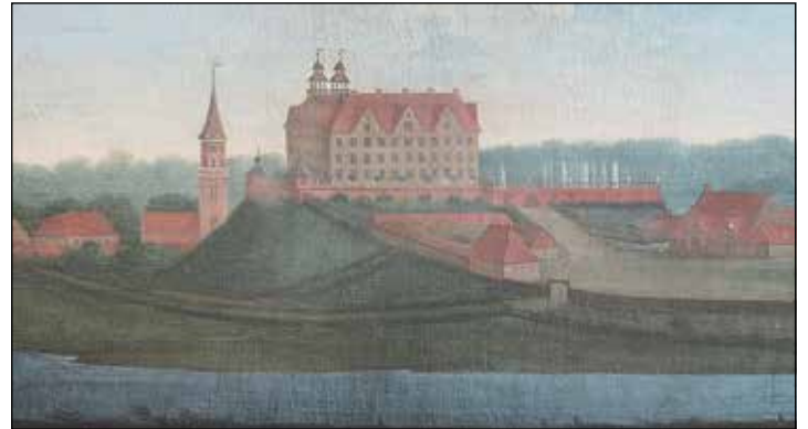
Das Plöner Schloss wurde in den Jahren 1633 bis 1636 erbaut. Auf einem alten Gemälde des Künstlers Waerdigh ist ein rotbrauner Backsteinbau abgebildet, denn erst im 19. Jahrhundert erhielt die ehemalige Residenz der Plöner Herzöge den weißen Anstrich.