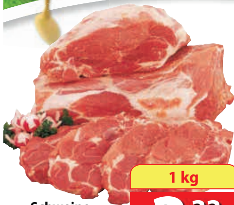
Schweine-Grillnacke nur im Ganzen, ca. 3,5 kg