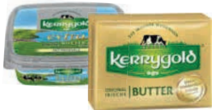
Kerrygold Original Irische Butter, Kerrygold extra 250 g oder Butter-spezialitäten 150 g verschiedene Sorten Packung je (100 g = 0.60/0.99 €)