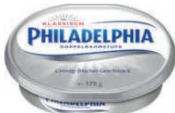
Philadelphia Frischkäse oder Frischkäsezubereitung verschiedene Sorten und Fettanteile 140–175-g-Packung je (100 g = 0.50–0.63 €)