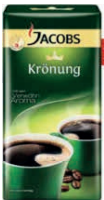
Jacobs Krönung verschiedene Sorten 500-g-Packung je (1 kg = 7.98 €)