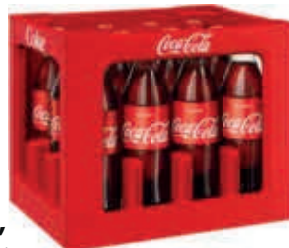
Coca-Cola*, Fanta, Sprite oder Mezzo Mix* *koffeinhaltig verschiedene Sorten 12 PET-Flaschen à 1 Liter Kiste je (1 Liter = 0.67 €) zzgl. 3.30 € Pfand