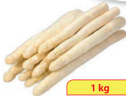
Deutschland Spargel weiß Kl. I