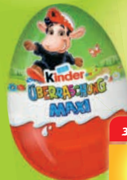
Ferrero Kinder Überraschung Maxi 100-g-Ei