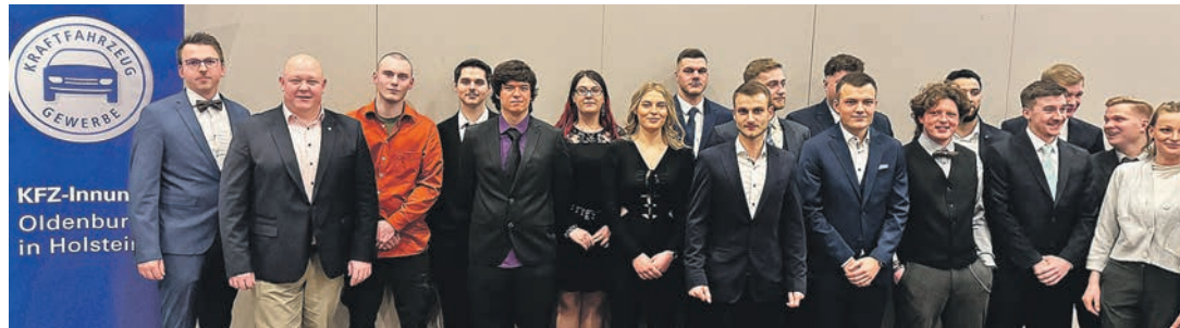
Gruppenbild der Junggesellinnen und Junggesellen mit Vertretern der KFZ-Innung.