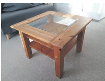
Beistelltisch Kiefer massiv mit Glaseinsatz 66 x 66 x 48 cm für 20 € abzugeben. Tel.: 01525 2435014

Oldenburg, EFH, teilsaniert, ca. 60 qm Wf auf 450 qm Eigenland, Carport, VB, Gas Hz, KP 99.000,-/Tel.: 01723286471.