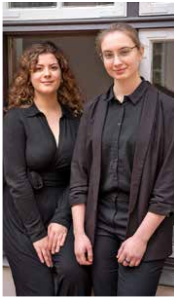
Duo Opus 35