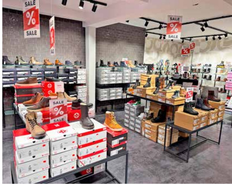
Die Schuhabteilung glänzt durch Markenqualität.

Eine gute Auswahl ist beispielsweise noch im