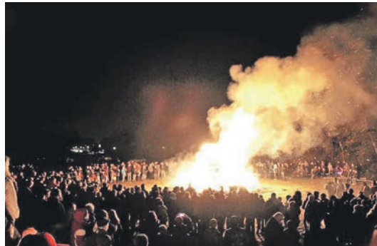
Seit vielen Jahrhunderten traditionelles Brauchtum im Harz: Das Oster-Feuer begeistert Jung und Alt.

Abendessen, dazu ohne Berechnung das große Getränke-Paket im Hotel von 10.00 bis 20.30 Uhr (Bier vom Fass, Weisswein, Rot-