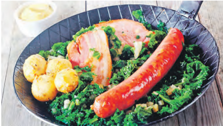
Grünkohl „satt“ vom großen Schlemmer-Buffet genießen unsere Gäste auf der Elbe-Kreuzfahrt ab/bis Hamburg.

Hafen-Kreuzfahrt mit einem eleganten Salon-Dampfer vorbei an Ozean-Riesen und beeindruckenden Containerschiffen zum Kurier-Grünkohl-Fest am 15. Februar 2025 (Samstag) mit einem großen hanseatischen Grünkohl-