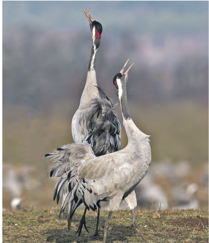
Das eigentlich imposante Trompeten der Vögel des Glücks klang Silvester panisch.

„Wir haben wirklich Verständnis, wenn Menschen den Jahreswechsel mit Freude ausgelassen feiern, das machen wir auch“, so die beiden Naturschützer, „aber die Böllerei und das Zünden von Leuchtraketen in der Nähe eines Naturschutzgebietes geht wirklich zu weit“. Bereits weit vor Mitternacht wurden Böller am Kranichring gezündet, welche die Vögel aufscheuchten. Besonders laut wären die herumirrenden Kraniche zu hören gewesen, deren Rufe panisch klangen, berichten die Schutzgebietsbetreuer vom NABU. Dabei hatte die Gemeinde Hohwacht unter dem Motto „Hohwacht leuchtet auch ohne Böller“ zum freiwilligen Verzicht auf die Knallerei aufgerufen. Beachtet wurde es augenscheinlich nicht. Sogar in Verbotszonen und in Bereichen mit Reetdachhäusern wurden in der Sturmnacht unverantwortlich Raketen abgefeuert. Im Übrigen ist es nach dem Bundesnaturschutzgesetz „verboten, wildlebende Tiere mutwillig zu beunruhigen“ und „wildlebende Tiere der streng