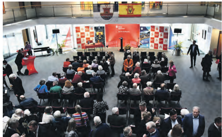
Der Neujahrsempfang in der Plöner Förde Sparkasse

Schneider wurden die aktuellen Verschönerungsprojekte der Stadt vorgestellt: von der neuen Möb-