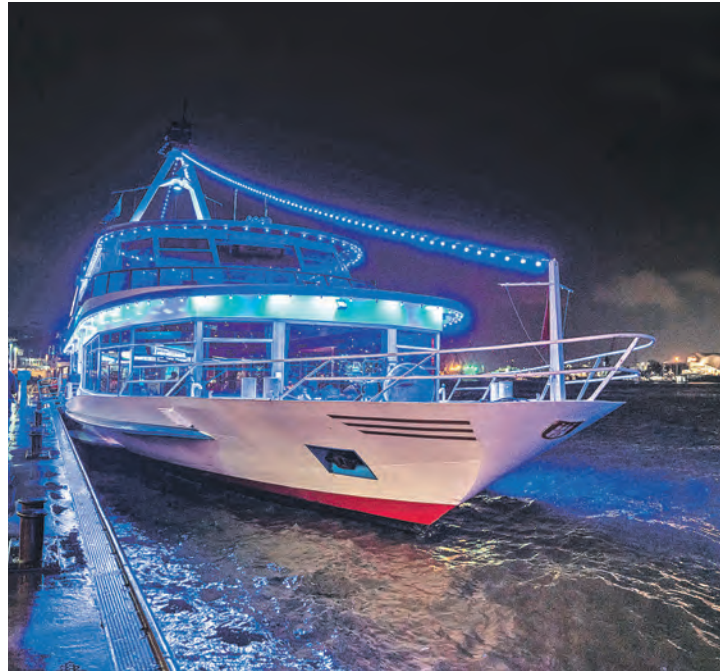
Mit dem prachtvoll illuminierten Salon-Dampfer gehen unsere Leser:innen auf große Grünkohl-Kreuzfahrt im Hamburger Hafen.