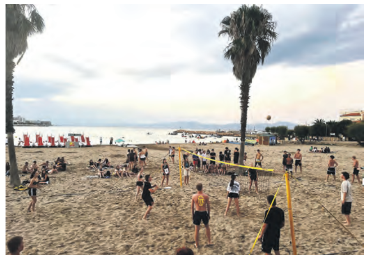
Beachvolleyball - Ferienfreizeit in Spanien

bis 30.08.2025 Gelegenheit, L'Escala und Umgebung kennenzulernen. Für diese Reise können Zuschüsse für einkommensschwache Familien gewährt werden. Weitere Infos zu den Fahrten gibt es beim AWO Jugendwerk Unterelbe unter Tel. 04101/205737 oder auf der Homepage www. awo-jugendwerk.com