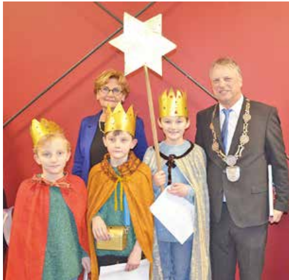
Sternsinger segneten die Häuser Lütjenburgs und ihre Bewohner:innen.

kleber hinterlassen, so dass jeder die Segnung mit nach Hause nehmen konnte. Wer mochte, konnte eine kleine Spende hinterlassen, diese kommt Schulprojekten in Kenia und Kolumbien zugute. Fortsetzung auf Seite 3