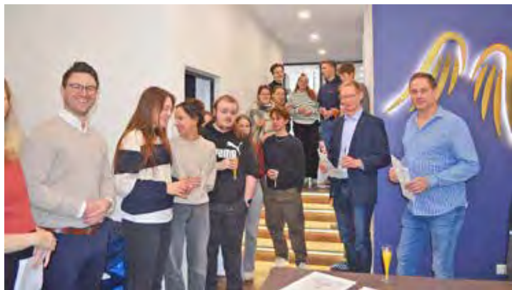
Lebhafte Gespräche und viele interessierte Schüler:innen in der Provinzial Versicherung Am Markt.

sein, wenn diese wichtige Zusammenarbeit besiegelt wird. Es ist bereits die vierte Partnerschaft, die vertraglich geregelt ist: auch die Galerie Marc Richter, das Gut Helmstorf und die Firma Kendrion Kuhnke Automation GmbH in Bad Malente sind Partner der Schule. Somit ist das Gymnasium breit aufgestellt mit den Zweigen Kunst, Wirtschaft, Landwirtschaft und Finanzen. Die Mitglieder