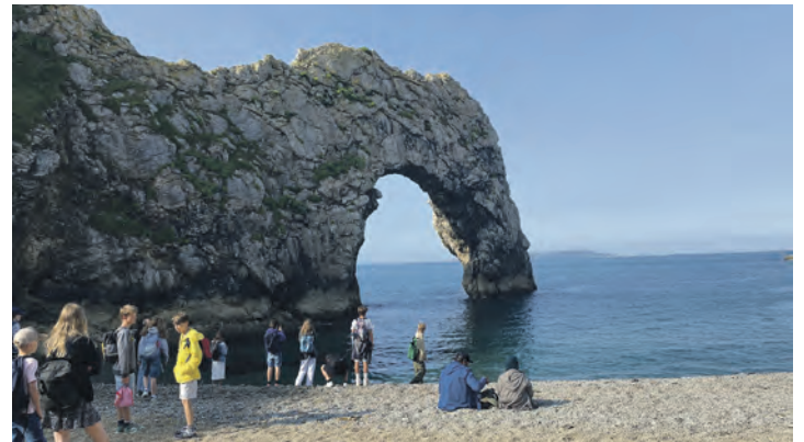
Weymouth Durdle Door

gleitung ihrer Teamer am 12.08. sowie am 15.08.25. Für kinderreiche Familien können Zuschüsse gewährt werden. 14 bis 17-Jährige, die es eher nach Spanien an die Costa Brava auf ein Sport- und Beachcamp zieht, haben vom 16.08.