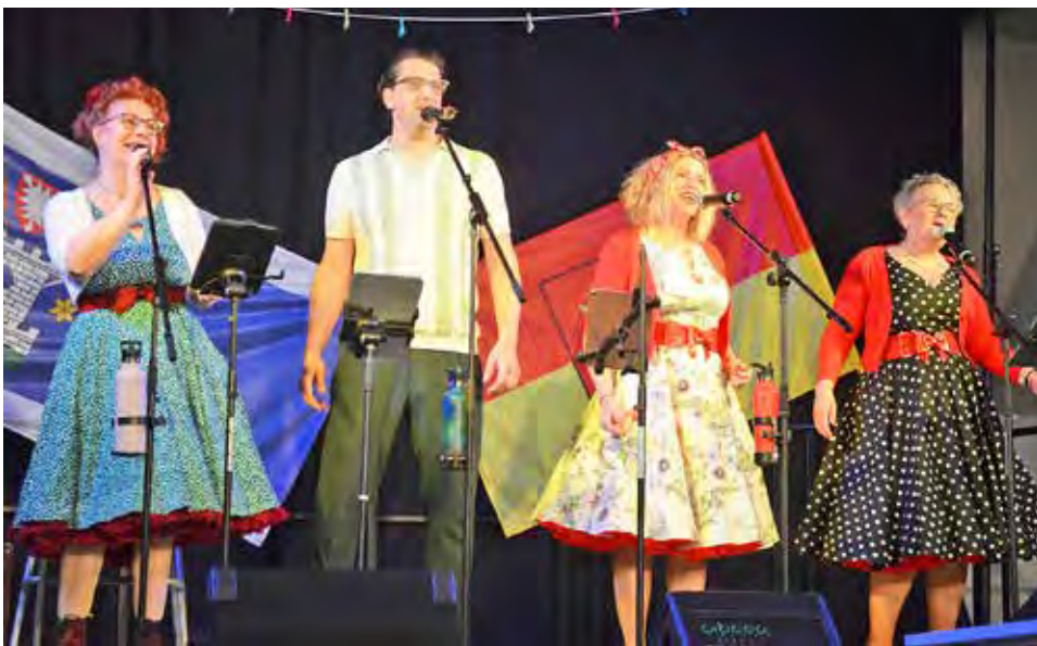
Die Swinging Chordettes versetzten die Gäste zurück in die 1950er und 1960er Jahre.

allen Mitarbeiterinnen und Mitarbeitern der Stadt und auch den vielen Vereinen, Verbänden und Einrichtungen, die das Leben in Lütjenburg lebens- und liebenswert machen. Mit diesem guten Fundament kann das Jahr 2025 beginnen, auch wenn mehr Prioritäten gesetzt werden müssen, weil Bund und Land immer mehr Kosen auf die Kommunen verschieben und das in fast allen Bereichen. Aber trotz dieser Sorgen und Probleme wird es in Lütjenburg vorangehen: das ehemalige Stabsgebäude der Kaserne wird weiter aus- und umgebaut, um Verwaltungsräume für die Stadtwerke zu schaffen. Der Anbau der Grundschule wird