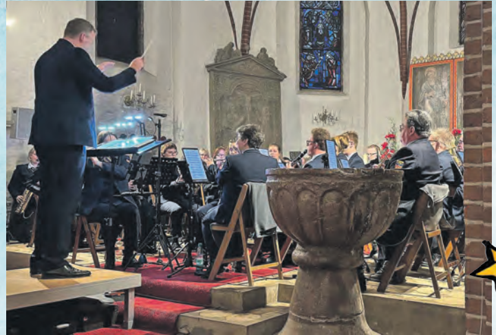
Die St. Katharinen Kirche in Lensahn ist ein wunderbarer Ort für Konzerte und vermittelt Ruhe, Einkehr und Besinnlichkeit.

ters alle Anwesenden zu einer musikalischen Reise ein, die an Vielseitigkeit und einnehmenden Klängen nichts zu wünschen übrigließ. Bekannte Lieder wie „Can you feel the love tonight“ von Elton John ebenso wie Melodien aus dem Musical König der Löwen, bei dem es um die Abenteuer von Löwe Simba in Afrika, um Freundschaft und Liebe geht oder auch weihnachtliche Klänge zu „Oh du fröhliche“ und viele Weihnachtsklassiker mehr ließen die Zeit wie im Nu vergehen. Unterhaltsam gestaltete sich im Rahmen des Konzerts