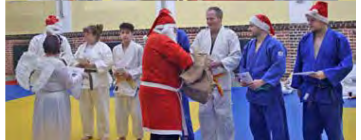
Jugendliche und erwachsene Judoka mit Weihnachtsmann