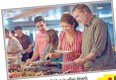
Skandinavische Spezialitäten in allen Hotels