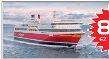
Norwegen-Kreuzfahrt direkt nach Bergen