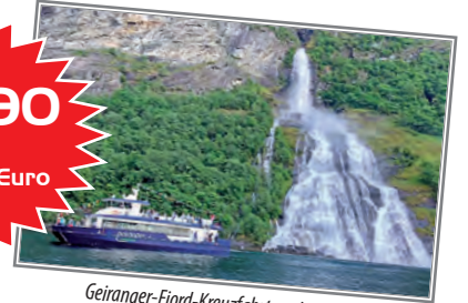
Geiranger-Fjord-Kreuzfahrt zu den weltberühmten Wasserfällen im Reisepreis bereits enthalten!