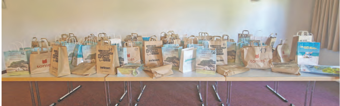
Insgesamt 72 Geschenke bereicherten Dank der Spenden die Tombola zum Kinderfest.