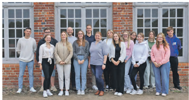
Die Teilnehmerinnen und Teilnehmer aus dem 5. Durchgang des PK-Azubi-Netzwerks.

entwickelt. In diesem Netzwerk wird auch auf unternehmensübergreifende Kommunikation gesetzt. Hierdurch sollen neue Facetten der eigenen Persönlichkeit, u.a. durch den Abgleich von Selbst- und Fremdbild, erlebbar und sichtbar gemacht werden. Da die Fortbildungsreihe unterneh-