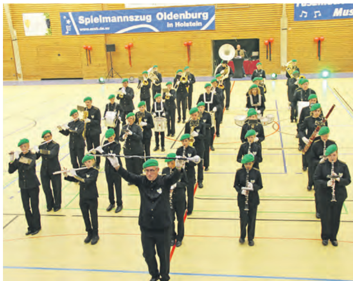
Die schwedischen Gäste „Fristads Ungdomsorkester“.

in Holstein, der nicht nur organisatorisch für einen reibungslosen Ablauf und für die Verpflegung sorgte, sondern auch selbst mit einer eindrucksvollen Darbietung das Finale bildete.