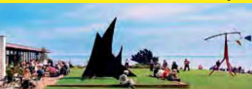
Kunst-Museum „Louisiana“ in einmaliger Lage am Öresund

Eines der berühmtesten Kunst-Museen der Welt in einmaliger Lage am Öresund nördlich Kopenhagens erwartet unsere Leser:innen zum genussvollen Kunst-Erlebnis der Extraklasse mit einmaligen Kunst-Ausstellungen, atemberaubender skandinavischer Architektur und malerischen Parks und Gärten direkt am Öresund mit ausreichend Freizeit (Eintritt zahlbar vor Ort!). Besuch des weltberühmten „Königs-Domes“ in Roskilde inklusive Eintritt in traumhafter Lage