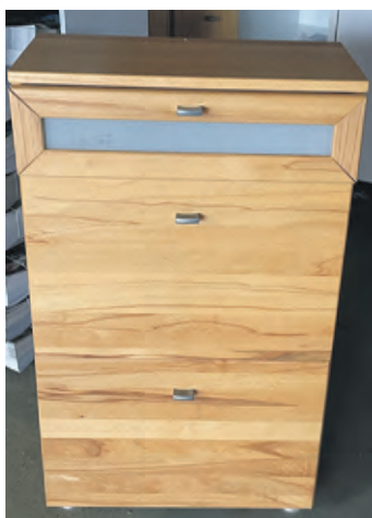
Flurgarderobe mit Schuhschrank (Buche) f. 20,- Euro abzugeben in Oldenburg, sehr gut erhalten! Ab 16 Uhr 0176-10261568