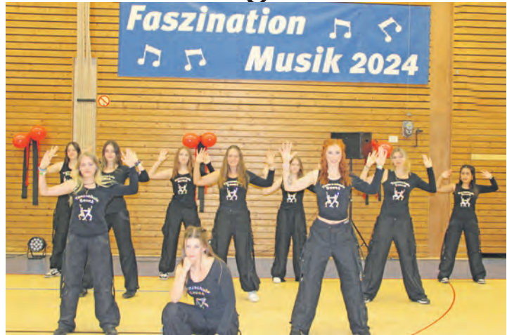
Die „großen“ Tänzerinnen.

präsentierten unterschiedlichste Genres – von klassischen Märschen über moderne Hits bis hin zu kreativen Showeinlagen. Ebenso begeisterte die Tanzschule Beuck mit den Choreografien der kleinen und großen Tänzerinnen und Tänzer. Gastgeber und Ausrichter des Events war der Spielmannzug Oldenburg