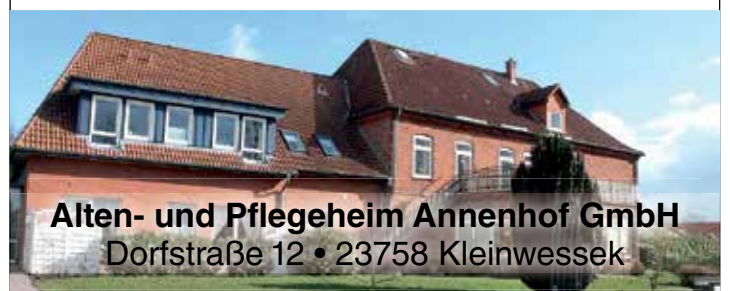
Alten- und Pflegeheim Annenhof GmbH Dorfstraße 12 • 23758 Kleinwessek