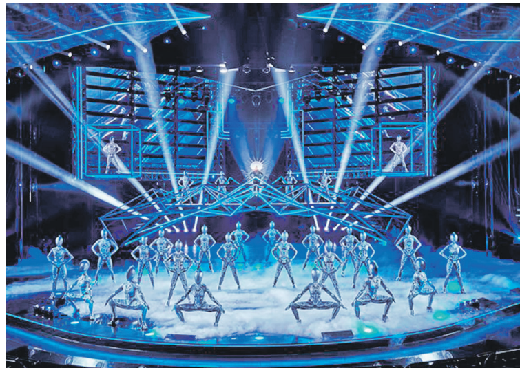
Eine Weltklasse-Show like Las Vegas präsentiert der Friedrichstadtpalast mit der nagelneuen Revue „falling in love“ in Berlin.

Hotel-Zimmern zum Genießen. Höhepunkt des Shopping- und Erlebnis-Genusses ist sodann der Besuch im berühmten Friedrichstadtpalast Berlin inklusive Hin- und Rück-Transfers mit der nagelneuen Groß-Revue like Las Vegas mit „Falling in Love“ inklusive Eintrittskarten (Höherwertige Eintrittskarten in allen Kategorien bei uns buchbar!). Atemberaubende Bühnen-Bilder, 600 farbenprächtige Kostüme, 100 Tänzer:innen, modernste Theater-Technik und Weltklasse-Artistik prägen die teuerste und aufwendigste Super-Show des Friedrichstadtpalastes auf der größten Theaterbühne der Welt. Die Presse in der Hauptstadt war restlos begeistert nach der Premiere. Nach dem reichhaltigen