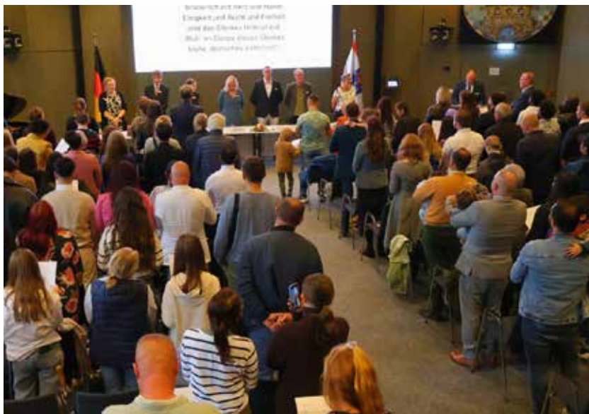
Teilnehmende singen Nationalhymne bei der Einbürgerungsfeier