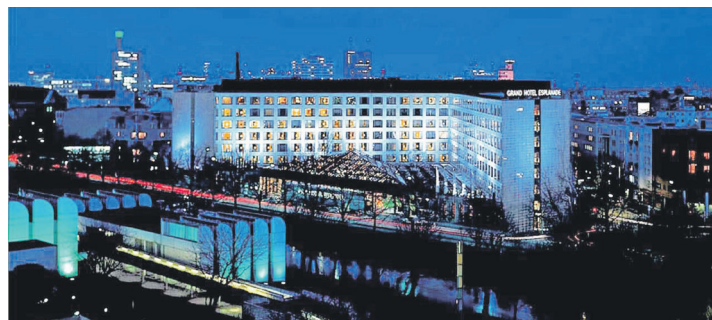
In Best-Lage der City-West erwartet unsere Gäste das Top-Hotel Sheraton mit erlesenem Komfort.

Frühstücks-Buffet genießen unsere Leser:innen am 2. Tag die