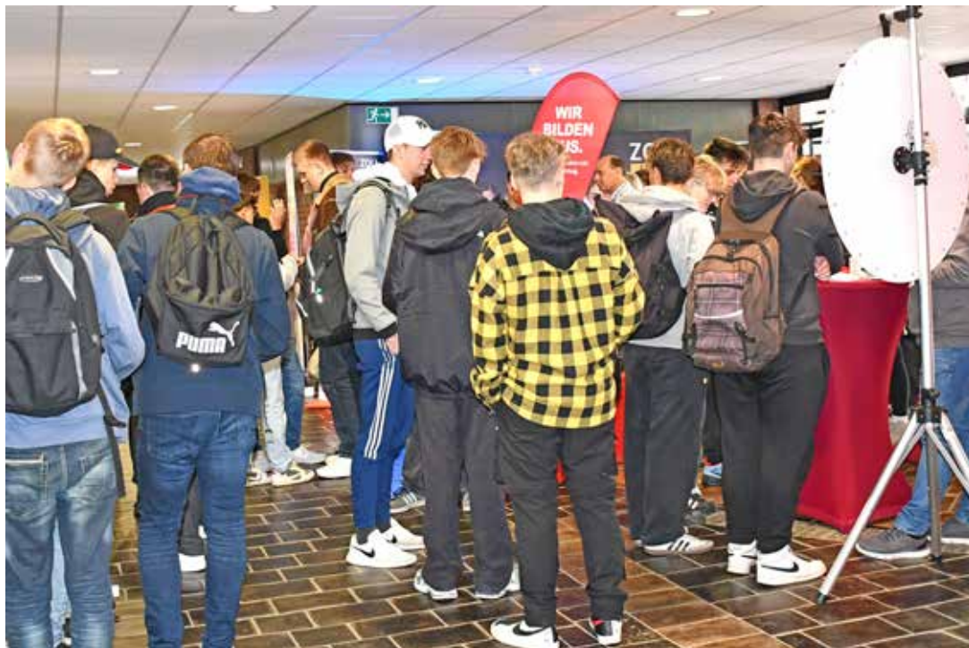
Auf der Messe herrschte reger Andrang, weil nicht nur Schüler aus Oldenburg, sondern aus dem ganzen nördlichen Kreis Ostholstein die Möglichkeit nutzten, sich direkt aus erster Hand zu informieren

Beruf, der zu euch passt. Wir beraten unabhängig, klischeefrei und helfen auch bei der Vermittlung. Uns liegen bereits zahlreiche Stellenmeldungen für 2025 in Ostholstein und Lübeck vor. Wartet nicht zu lange. Kümmert euch um einen Beratungstermin und die Ausbildung“, rät der Teamleiter Schülerinnen und Schülern.