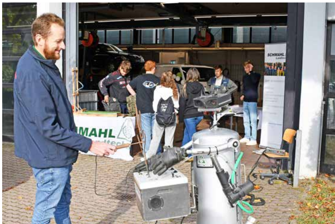
Auch an anderen Ständen war Geschicklichkeit gefragt, wie zum Beispiel bei Landtechnik Schmah

„Habt keine Angst vor der Berufswahl. Jeder Mensch ist anders und jeder hat unterschiedliche Stärken. In einem persönlichen Beratungsgespräch helfen wir euch herauszufinden, was in euch steckt. Wir stellen eure Talente und Interessen in den Mittelpunkt und entdecken so einen