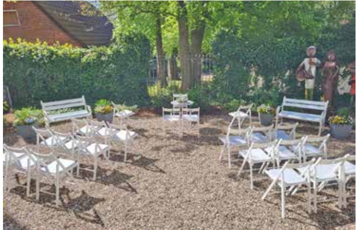
Der Aufbau für die Trauungen im Rathausgarten.

heit bei Brautpaaren. Die idyllische Atmosphäre des Gartens hat viele Brautpaare überzeugt, ihre Hochzeit unter freiem Himmel zu feiern. Die zahlreichen Voranfragen für das kommende Jahr bestätigen den anhaltenden Trend. Paare haben die Möglichkeit, ihre Hochzeit im Zeitraum