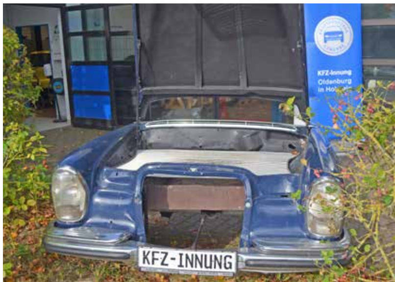
Auch bei der Kfz Innung konnten sich die Jugendlichen ausführlich informieren.

„Ich richte aber auch gleichzeitig den Appell an Betriebe,