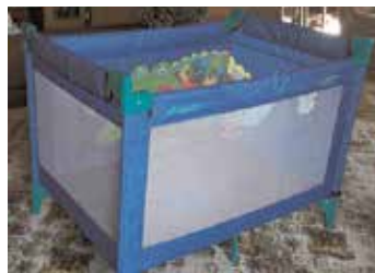
Kinderreisebett von der Firma Hauck, 40,- €, Tel. 04365-479

Garagenflohmarkt am 22.9.24 von 10-16 Uhr, Kehr wieder 22, Kinderspielsachen, -kleidung, -schuhe bis 12 Jahre