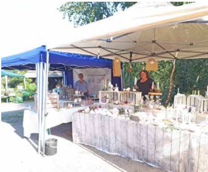
Auch zwei Selbstbedienungshäuschen aus Oldenburg mit zauberhaften Geschenkideen waren vertreten, „Elas Kreativtraum“ und „der kleine dicke Spatz“.

Und für die Stärkung und Abkühlung zwischendurch gab es Grillspezialitäten, Wraps, Kuchen, frische Waffeln, leckeres Eis und vieles mehr.