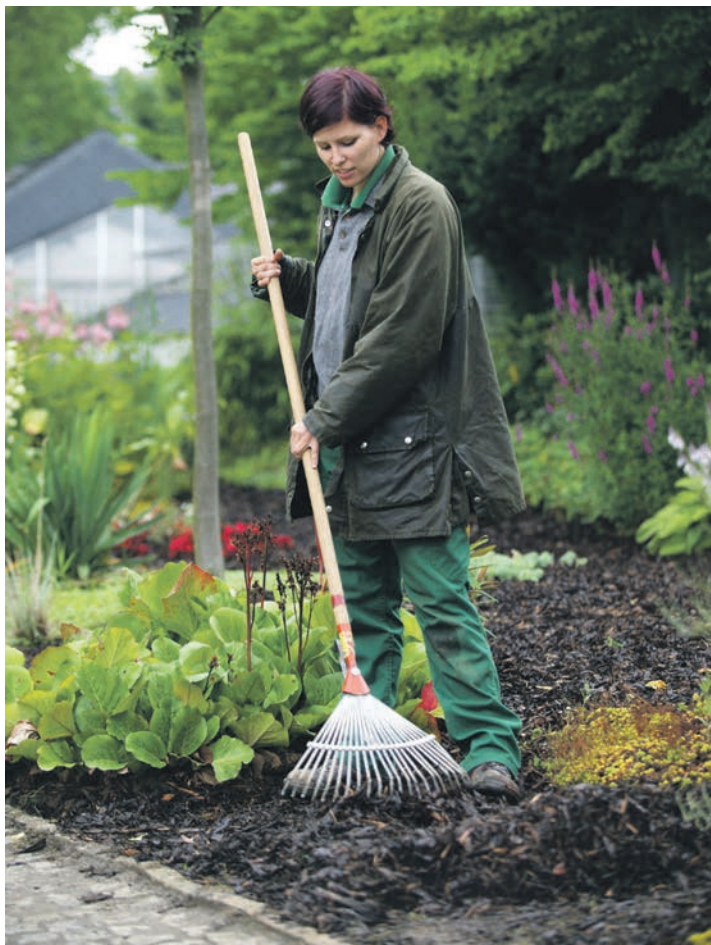
Der Herbst ist der ideale Zeitpunkt, um Pflanzen in den Boden zu setzen! Denn nun liegt ihr Fokus auf dem Wurzelwachstum, einem der wichtigsten Aspekte beim Anpflanzen neuer Stauden, Gräser, Blumenzwiebeln und Gehölze.

Die Vielzahl an Pflanzen, die ab Herbst schon für das Folgejahr gepflanzt werden können, bietet auch die Chance, sich grundsätzlich mit der Planung des eigenen Gartens auseinander zu setzen. Was will ich nächstes Jahr wachsen sehen? Welche Blumen sollen blühen? Will ich etwas Duftendes und/oder viel Farbe? „Bei der Gestaltung des eigenen Gartens im Herbst gibt es eine Vielzahl an Aspekten zu beachten“, sagt Dr. Michael Henze vom BGL. „Es lohnt beispielsweise, im Blick zu haben, wann die einzelnen Arten und Sorten blühen, um eine lückenlose Blütenfolge zu erzeugen. Das ist nicht nur schön fürs Auge, sondern auch wichtig für Insekten und Vögel, damit sie möglichst lange ausreichend Nahrung finden. Menschen mit Garten sollten sich aber auch fragen, wie viel Zeit sie im Jahres-