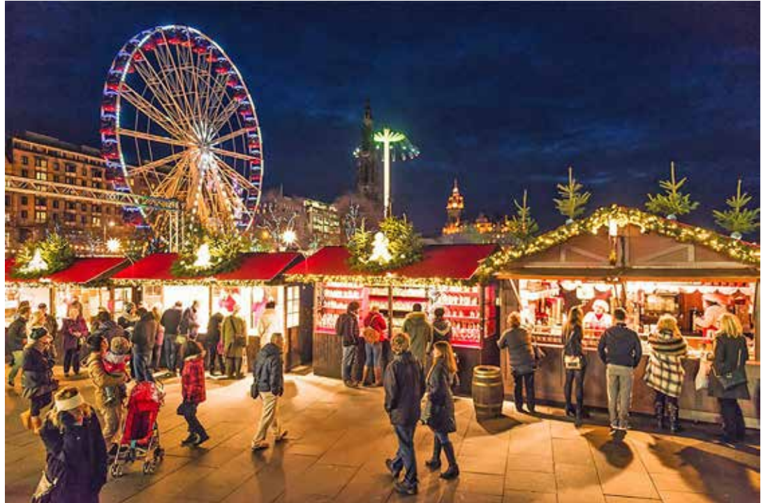
Auf Entdecker-Kurs mit den großen Jumbo-Fährschiffen reisen die Reporter-Leser:innen nach Schottland.

Zum großen Leistungspaket der Reporter-Sonder-Reise vom 25. bis 28. November 2024