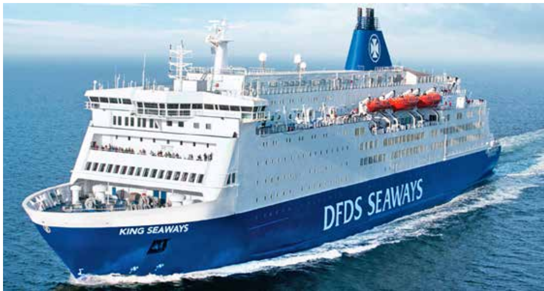
Einer der schönsten Weihnachtsmärkte in Europa erwartet die Reporter-Leser:innen in Edinburgh im Herzen der Stadt.

zum Schnäppchenpreis von nur 299,90 Euro gehören neben der Busfahrt direkt ab Oldenburg und Lensahn im 4-Sterne-Reisebus zwei Übernachtungen an Bord der großen Jumbo-Direktfähren der DFDS auf der Strecke Amsterdam-Newcastle-Amsterdam inklusive 2-Bett-Kabinen mit DU/WC sowie 2 x großes Schlemmer-Frühstücks-Buffer an Bord, eine Hotel-Übernachtung in Edin-