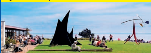
Kunst-Museum „Louisiana“ in einmaliger Lage am Öresund

Eines der berühmtesten Kunst-Museen der Welt in einmaliger Lage am Öresund nördlich Kopenhagens erwartet unsere Leser:innen zum genussvollen Kunst-Erlebnis der Extraklasse mit einmaligen Kunst-Ausstellungen, atemberaubender skandinavischer Architektur und malerischen Parks und Gärten direkt am Öresund mit ausreichend Freizeit (Eintritt zahlbar vor Ort!). Bereits auf der Anreise erfolgt ein Besuch des weltberühmten „Königs-Domes“ in Roskilde inklusive Eintritt in traumhafter Lage am Roskilde-Fjord, wo unsere Leser:innen im Herzen der Altstadt ausreichend Freizeit zum Dom-Rundgang finden.