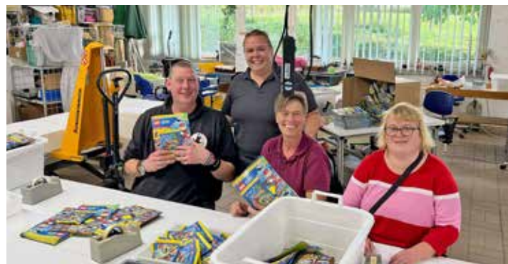
... und nachmittags in der Eutiner Werkstatt