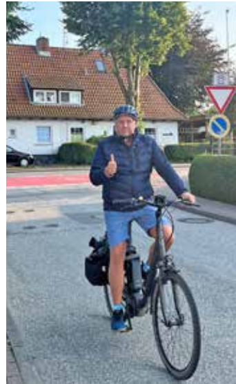
Landrat Timo Gaarz freut sich auf zahlreiche Anmeldungen.

Eutin (sb). Im September geht es wieder los! Das STADTRADELN geht in die siebte Runde und lockt die Ostholsteinerinnen und Ostholsteiner aufs Fahrrad. Während der dreiwöchigen Kampagne zählt jeder Kilometer, der mit dem Rad zurückgelegt wird. Landrat Timo Gaarz ruft alle, die im Kreis Ostholstein wohnen, arbeiten, einem Verein angehören oder eine Schule besuchen, zum Mitradeln auf: „Lassen Sie uns gemeinsam in die Pedale treten und somit einen Beitrag zum