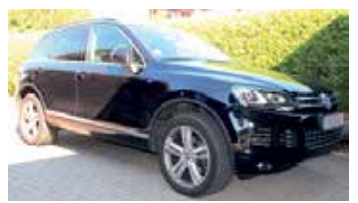
ausschließlich für PRIVATE Kleinanzeigen

Für Chiffre-Anzeige berechnen wir eine zusätzliche Gebühr von 5,- Euro. Bei Familien- und/oder Geschäftsanzeigen wenden Sie sich bitte direkt an: der reporter OLDENBURG Am Rathsländ 3 • 23758 Oldenburg ☎ 04361-63203 mail: info@derreporter.com