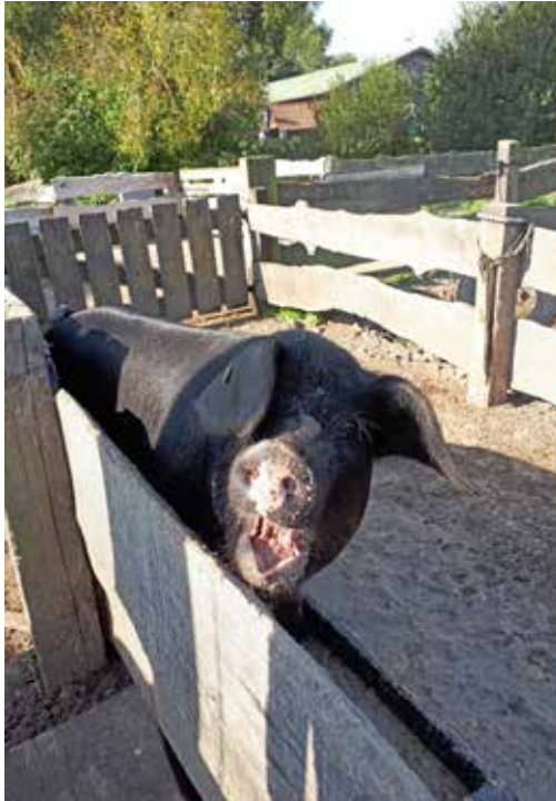
Landleben auf dem Museumshof.

Lensahn (su). Bei strahlendem Sonnenschein und Temperaturen um die 24 Grad schon kurz nach 10 Uhr, kamen am Sonntag, dem 8. September, die ersten Be-