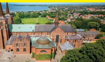
Wiking-Dom Roskilde: UNESCO-Welt-Kulturerbe & Königsgräber