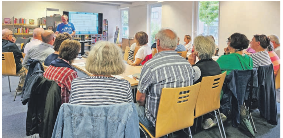
Letzter Workshop des Digitalen Knotenpunktes am 21.08.24

Oldenburg (hm). Sie möchten mehr über E-Mails erfahren und sicher im digitalen Alltag unterwegs sein? Dann lädt Sie der Digitale Knotenpunkt der Stadtbücherei Oldenburg in Holstein herzlich zu einem ausführlichen Workshop „Was Sie schon immer über E-Mails wissen wollten, aber bisher nicht zu fragen wagten - (fast) alles über E-Mails“ ein. Die Veranstaltung findet am Mittwoch, den 28. August 2024 von 15:30 Uhr bis 17:00 Uhr in der Stadtbücherei am Schauenburger Platz 2 statt. Der Workshop bietet Einsteigern und Fortgeschrittenen die Möglichkeit, ihr Wissen rund um E-Mails zu erweitern und zu vertiefen. Wir werden Ihnen wertvolle