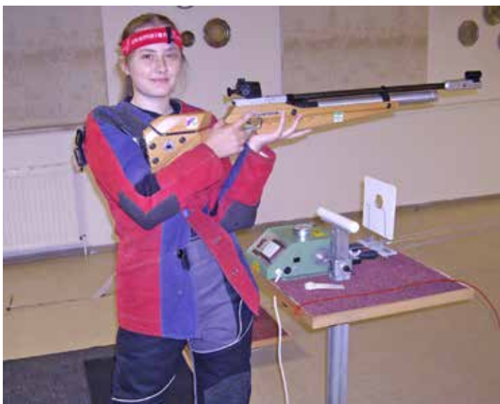
Lensahner Schützin für die Deutschen Meisterschaften qualifiziert

seit einem Dreivierteljahr den Schießsport betreibt, ein tolles Erlebnis werden, sich mit den besten Schülerinnen der Republik messen zu dürfen. Das ist für sie der verdiente Lohn für die konzentrierte Trainingsarbeit