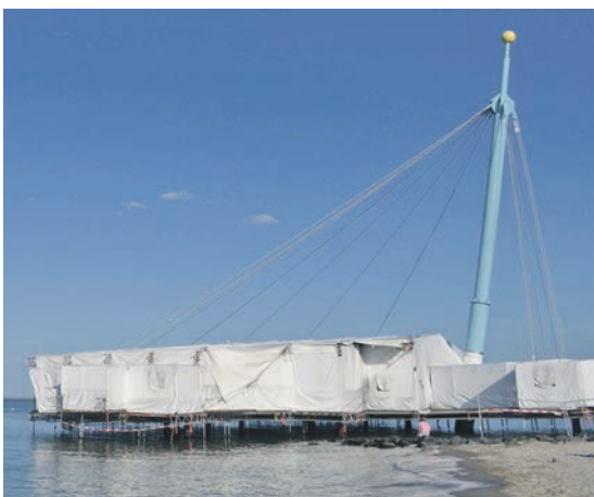
Die Flunder – noch verhüllt sie sich

zu feiern. Über den ganzen Tag verteilt gab es Programm für Jung & Alt, viele kulinarische Genüsse, aber auch Accessoires von der Flunder wie Nudeln, Schlüsselanhänger, Postkarten etc. und auch viele einmalige liebevoll gefertigte Gegenstände