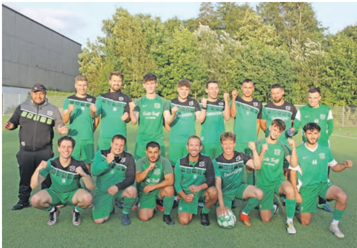
Jubel bereits vor dem Spiel des TSV Gremerdorf II bei der Zweiten des TSV Lütjenburg

la, Huchatz. (9. Khrarov), (35. Merzaev), (66. A. Abrahamzada), (70. Woywood), (76. Lemke). TSV Gremerdorf II: Fritzinger, Zaawit, Bargholz, Zeigner, Bargholz, Zeigner, Klein, Uhtenwoldt, Schöning, Keibel, Omeirat, Linke, Kunkel. (46. Bais, Haradinaj, Wiczorek), (66. Coenen). Tore: 0:1 Klein (5.), 0:2 Omeirat (9.), 0:3 Kunkel (14.), 0:4 Linke (33.), 0:5 Zeigner (62.), 0:6 Linke (64.), 0:7 Haradinaj (72.), 0:8 Omerrat (76.), 0:9 Klein (82.). Schiedsrichter: Schröder (FT Preetz). Zuschauer: 20.