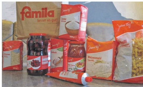
Der Inhalt einer Papiertüte zugunsten der Tafel Lütjenburg gestaltet sich beispielsweise wie dargestellt.

tion zu entrichten, zu begeistern. Das Gemeinschaftsprojekt sieht vor, eine mit Grundnahrungsmitteln vorgepackte Papiertüte im Warenwert von 10 Euro zugunsten der Tafel Lütjenburg zu erstellen. „Wir haben hierzu einen Warentisch mit rund 50 Tüten im Bereich der Käsetheke vorberei-