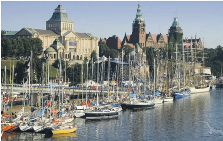
Die alte Hansestadt Stettin entdecken unsere Leser bei der großen Stadtrundfahrt mit Reiseleitung

Leberkaas im Semmel, Kraut und Brez'n zu gut gekühltem Oktoberfestbier. Selbstverständlich ist die Produktpalette an alkoholfreien und weinhaltigen Getränken auch, wie alles zu zünftigen Preisen im Angebot. Der Eintritt hierfür ist kostenlos und Trachten sind so sehr gewünscht, dass der Tourismusservice beim Eintritt jede Tracht mit einem Freigetränk belohnt!