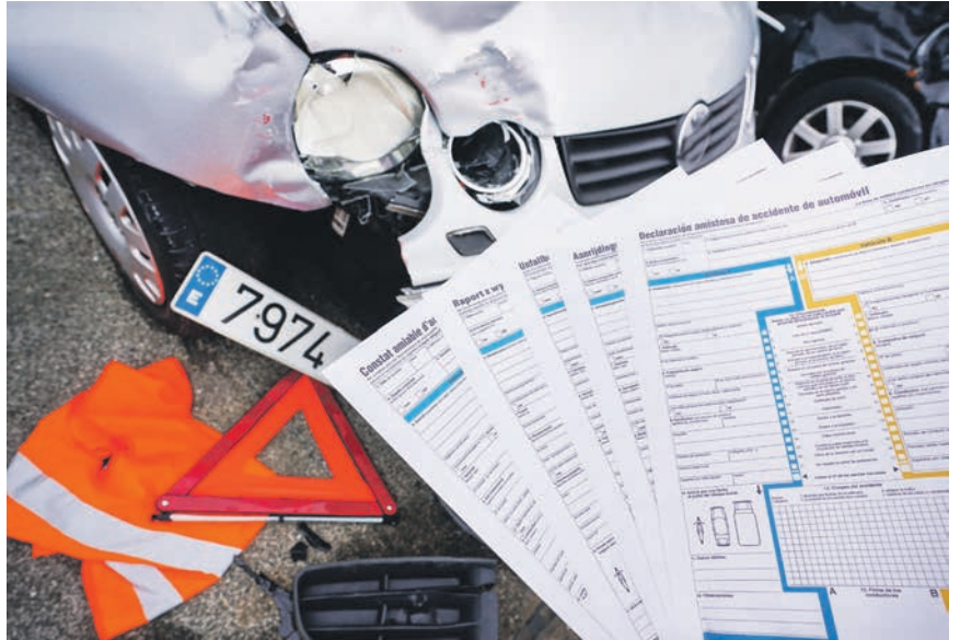
Auch im Urlaub können Unfälle passieren. Es ist gut vorbereitet zu sein.

für den Fahrer oder für alle Fahrzeuginsassen vorhanden sein müssen. Mit einem Exemplar für jeden ist man immer auf der sicheren Seite. Es gibt keine Vorschrift zur Aufbewahrung von Warnwesten. Aber um sie vor dem Aussteigen anziehen zu können, müssen sie griffbereit liegen, am besten im Handschuhfach oder in den Seitenfächern der Türen. Genauso wichtig wie die Warnweste ist das Absichern der Unfallstelle mit einem Warndrei-