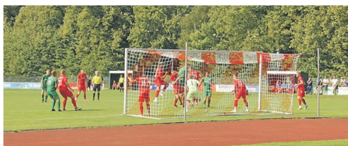
Eine kreative Offensive hatte der Tabellenerste TSV Gremersdorf beim Tabellenzweiten TSV Lütjenburg.