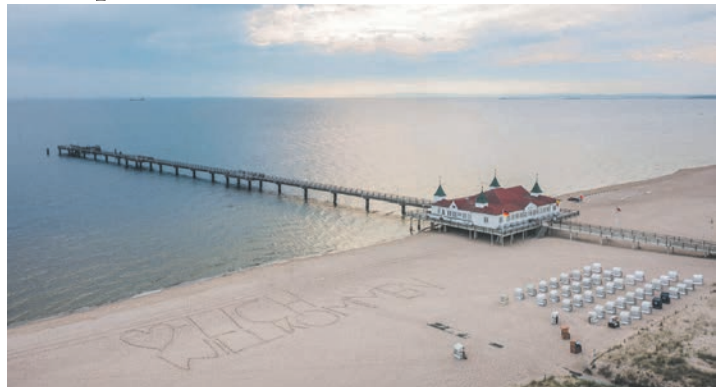
Deutschlands sonnenreichste Ostsee-Insel erwartet die Reporter-Leser zum Top-Termin des Jahres direkt in den Herbstferien

Übernachtungen im Top-Hotel „Hilton by Hampton“ mit exklusiven Designer-Zimmern mit DU/WC, TV etc., der Reporter-Begrüßungs-Cocktail im Hotel, 3 x großes Schlemmer-Frühstück vom Buffet sowie 3 x Abendessen im Hotel als Schlemmer-Buffet oder 3-Gang-Menü. Bereits auf der Anreise erfolgt der Besuch der alten Hansestadt Stettin mit großer Stadtrundfahrt mit Reise-