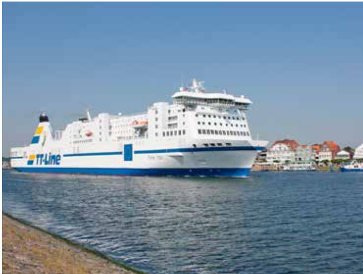
Unterwegs mit den Jumbo-Linern der TT-Line zum großen Jubiläum Kurs Schweden.

Anmeldungen sind ab sofort möglich im Reporter-Leser-Reisen-Büro des Burg-Verlages in Eutin unter der Telefonnummer 04521-701130, täglich von 9 bis 13 Uhr, sowie direkt online im Internet unter „leserreisen.der-reporter.info“.