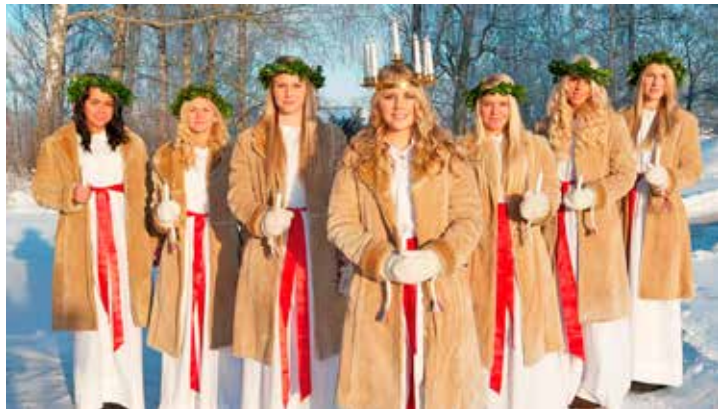
Das Lucia-Lichterfest wird in Schweden fröhlich und opulent gefeiert.

malerischer Lage am Öresund, extra zu buchen für nur 19,90 Euro. Zum großen Leistungspaket zum absoluten Jubiläums-Knüllerpreis „60 Jahre TT-Line“ von nur 225,00 Euro gehören neben der Fahrt im erstklassigen Fernreisebus mit Waschraum/WC und