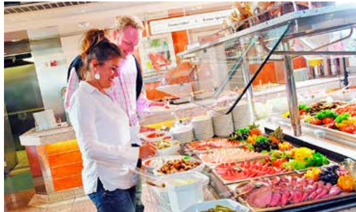
Auch kulinarisch werden die Reporter-Leser:innen an Bord der Märchenschiffe auf dem Hin- und Rückweg rundum verwöhnt.

sere Leser:innen die malerischen Weihnachtsmärkte am Öresund zum ausgiebigen Weihnachts-Shopping. Der Kurs der Reise