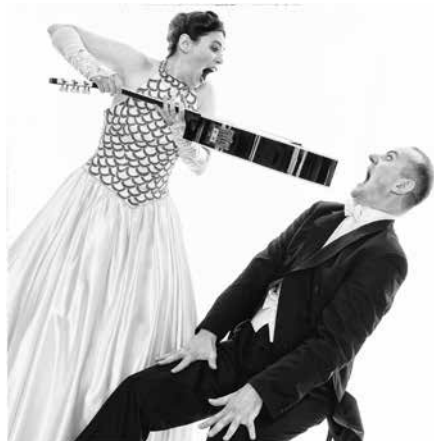
Konzert am 8. August

erhalten Sie im Vorverkauf bei EDEKA Jens in Lensahn, über das musicbuero, Tel: 04521-74528, im Shop des Museumshofes und an der Abendkasse. Ort der Veranstaltungen: Museumshof Lensahn, kostenloser Parkplatz Bäderstr. 18