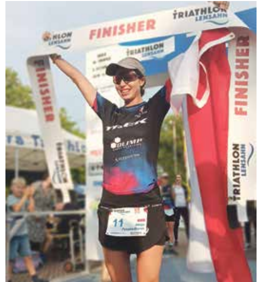
Triathlon in Weltrekord-Zeit.