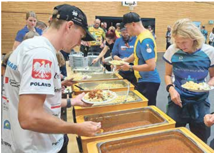
Die Sportler stärkten sich am Vorabend des Wettbewerbs mit reichlich Nudeln und allem, was dazugehört.

Die detaillierten Ergebnisse sind online auf www.triathlonlensahn.de zu finden.