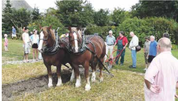
Pferdetage am Samstag und Sonntag, 3. und 4. August.

Historische Ernte und Bodenbearbeitung mit Arbeitspferden am Samstag und Sonntag, 3. und 4. August, ab 10 Uhr, Eintritt 6,50 Euro. Erleben Sie, wie früher die Feldarbeit mit Pferden funktionierte! An zwei erlebnisreichen Tagen zeigen Kaltblüter ihre Fähigkeiten beim Holzrücken, Pflügen und Eggen. Je nach Wetter und Bodenbeschaffenheit kommt auch die pferdegezogene Sämaschine zum Einsatz. Die ersten Kartoffeln werden durch Pferdekraft geerntet und stehen zum Verkauf bereit. Der Schmied demonstriert sein Können in der Hofschmiede, und alle Arbeiten