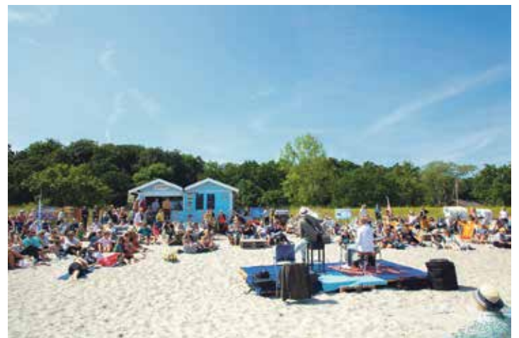
Die Flunderbar in Hohwacht. Hier findet das Konzert am Mittwoch statt.