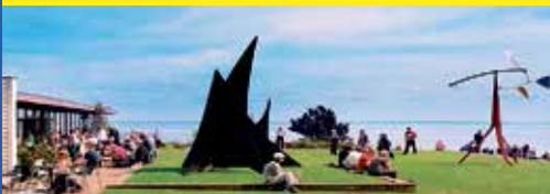
Kunst-Museum „Louisiana“ in einmaliger Lage am Öresund

Eines der berühmtesten Kunst-Museen der Welt in einmaliger Lage am Öresund nördlich Kopenhagens erwartet unsere Leser:innen zum genussvollen Kunst-Erlebnis der Extraklasse mit einmaligen Kunst-Ausstellungen, atemberaubender skandinavischer Architektur und malerischen Parks und Gärten direkt am Öresund mit ausreichend Freizeit (Eintritt zahlbar vor Ort!). Bereits auf der Anreise erfolgt ein Besuch des weltberühmten „Königs-Domes“ in Roskilde inklusive Eintritt in traumhafter Lage am Roskilde-Fjord, wo unsere Leser:innen im Herzen der Altstadt ausreichend Freizeit zum Dom-Rundgang finden.