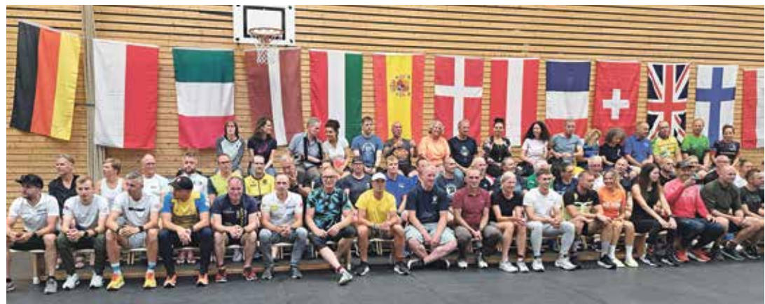
Insgesamt nahmen 73 Athleten aus 13 Nationen an dem Sportevent in Lensahn teil. Sie versammelten sich vor der Pasta-Party zum Gruppenfoto.

Bei der 1992 auf Initiative des Lensahner Extremsportlers Wolfgang Kulow ins Leben gerufenen Veranstaltung sind in diesem Jahr insgesamt 73 Sportlerinnen und Sportler aus 13 Nationen nach Ostholstein gereist. 23 nahmen am Triple, 21 am Double teil. Außerdem gab es einen 24-Stun-