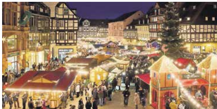
Weltweit einmalig ist der berühmte „Advent in den Höfen“ in Quedlinburg im winterlichen Harz.

Höhepunkt des Besuches des romantischen Weihnachtsmarktes „Advent in den Höfen“ in Komfort-Hotel mit Hallenbad und Sauna in Top-Lage in Hahnenklee im Oberharz, mit gro-