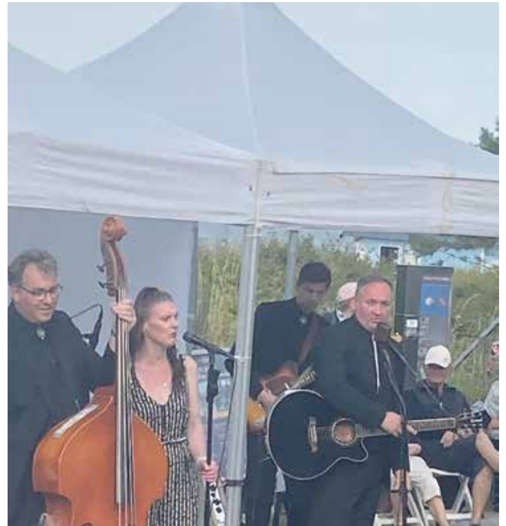
Ein großes Publikum genoss am vergangenen Sonnabend das Konzert von The Line Walkers – A Tribute zu Johnny Cash.

von Ende der 1950er Jahre bis in die 1990er Jahre. Ein schier endlos erscheinendes Repertoire, welches mehrere Abende füllen würde, The Line Walkers hatten eine feine Auswahl getroffen, welche die Zuhörer begeisterte, sogar zum Tanzen animierte und tosenden Applaus erntete. So bescherte auch der vierte Konzertabend der Boogie-, Blues- und Folknächte den Urlaubern, Einheimischen und Gästen aus der Umgebung einen unvergesslichen Abend. Aber nach dem Konzert heißt in Hohwacht vor dem Konzert: schon am Mittwoch, dem 31.07. geht es weiter, um 18.00 Uhr treten Robert Carl Blank & The String Poets bei der Flunderbar auf, der tschechische Frontmann hat sein Handwerk von der Pike auf gelernt und wird sein breites Spektrum vorstellen.