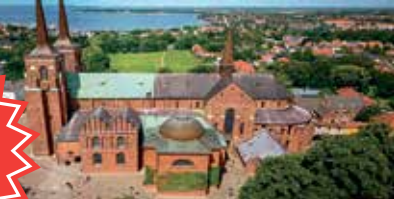
Wikinger-Dom Roskilde: UNESCO-Welt-Kulturerbe & Königsgräber