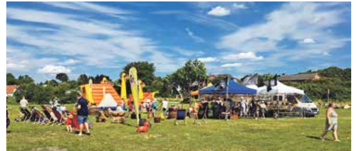
Piratenfest am Montag, 5. August 2024

„Ich hätt' getanzt heut' Nacht!“ – Musik aus Musical und Show am