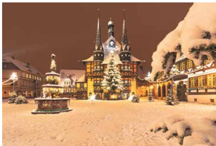
Ein magisches Winter-Erlebnis ist auch der romantische Weihnachtsmarkt in Wernigerode.

Quedlinburg, wo im UNESCO-Weltkulturerbe mehr als 30 der historischen Höfe nur an drei Sonntagen im Jahr im Advent ihre Tore öffnen für ein ganz besonderes Vorweihnachts-Erlebnis. Zum großen Leistungspaket gehören neben der Fahrt im erstklassigen Fernreisebus ab Oldenburg, Lütjensburg und Lensahn zwei Übernachtungen im