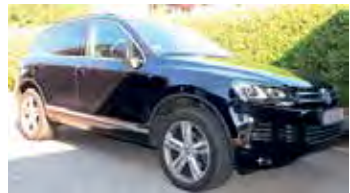
ausschließlich für PRIVATE Kleinanzeigen

Für Chiffre-Anzeige berechnen wir eine zusätzliche Gebühr von 5,- Euro. Bei Familien- und/oder Geschäftsanzeigen wenden Sie sich bitte direkt an: der reporter OLDENBURG Am Rathslad 3 • 23758 Oldenburg ☎ 04361-63203 mail: info@derreporter.com