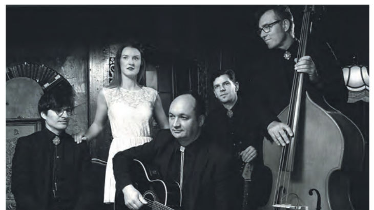
A Tribute to Johnny Cash - The LineWalkers –