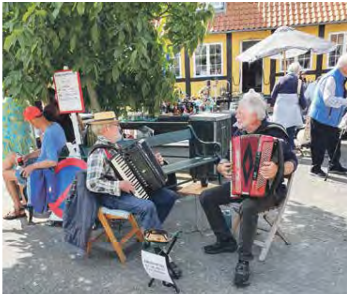
Musiker in Svaneke