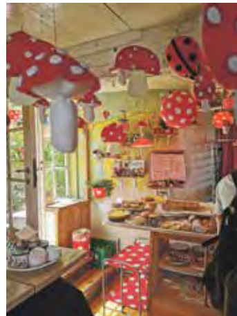
Café in Gudjem

den Kommentaren und Informationen an unserem 1. Ausflugs-tag durch das Fischerdörfchen Snogebæk, zu der Rundkirche Osterlars Kirke, dem Hafenort Gudjem, der Festung Hammershus und zum Schluss zur höchsten