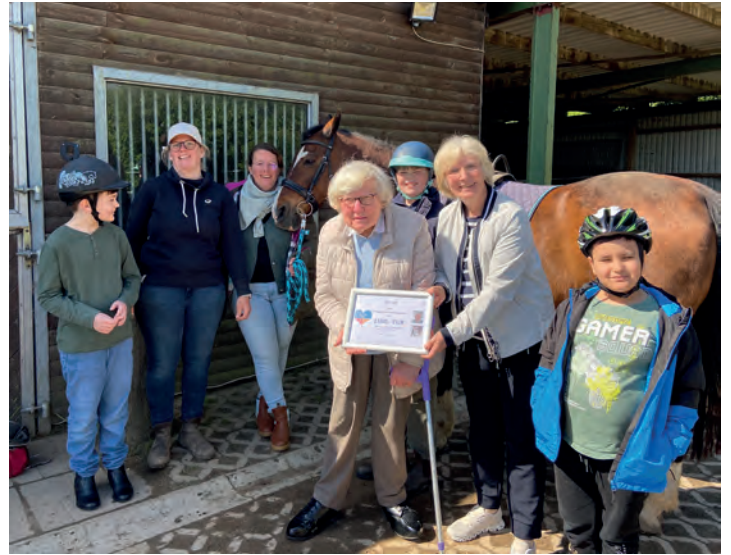
„Ein Herz für Lensahn“, hierfür sind Lehrkräfte und Kinder der Schule Kastanienhof sehr dankbar.

Lensahn beschult werden, erhalten zwischen Sommer- und Herbstferien motorische Förderung auf dem Pferderücken. Gleichzeitig werden durch den Umgang mit dem Pferd Ängste abgebaut und Selbstbewusstsein entwickelt. Die Kinder erleben sich als selbst-wirksam und freuen sich auf diese besonderen Unterrichts-stunden. Möglich wird diese Form des Unterrichts durch die Unterstützung der Stiftung „Ein