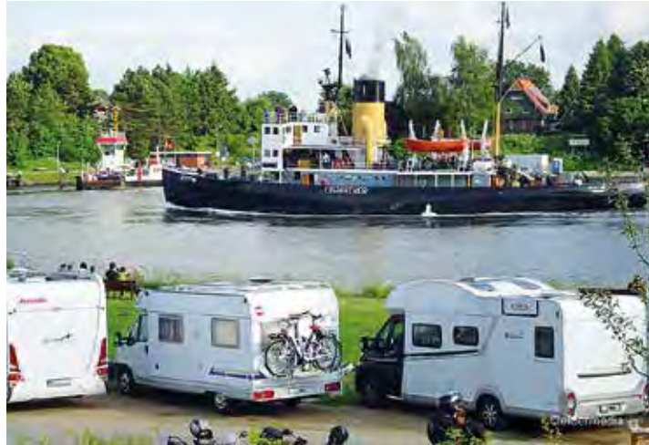
5 Stunden genießen unsere Leser:innen die große Nord-Ostsee-Kanal-fahrt in gemächlichem Tempo.

der Welt mit einem zünftigen Bord-Frühstück für alle Leser:innen und der Kurs der fünfständigen Erlebnis-Kreuzfahrt führt mit vielen fachkundigen Erklärungen und Besichtigungen der Schiffs-Technik und der Brücke an Bord nach Kiel. Mit voller Kraft und kräftigem schwarzen Kohlen-Dampf geht es auf Kurs Landeshauptstadt, wo unsere Leser:innen am Nachmittag noch 2 Stunden in der Hafencity zur freien Verfügung genießen können (bei Ter-