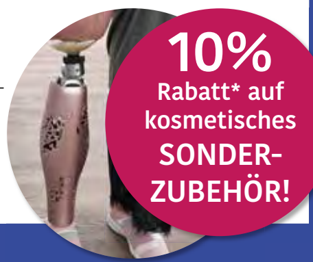
Kosmetik-Cover aus 3 D-Druck für Prothesen.

10% Rabatt* auf kosmetisches SONDER- ZUBEHÖR!