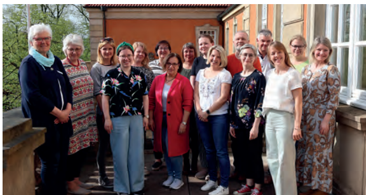
Die Kreispräsidentin mit den deutschen und finnischen Lehrerinnen und Lehrern.

Die Partnerschaft zwischen Mikkeli und dem Kreis Ostholstein besteht seit nunmehr fast 40 Jahren. Nach einer längeren Zwangspause durch die Corona-Pandemie nimmt die Partnerschaft nun wieder Fahrt auf. Im Dezember 2023 empfing die Kreispräsidentin bereits eine Gruppe finnischer Schüler:innen mit ihren ostholsteinischen Gastgebern vom Freiherr-vom-Stein-Gymnasium aus Oldenburg im Kreishaus. Ende April nahm sie an einem gemeinsamen Konzert der Musikschulen Ostholstein und Mikkeli teil, die dieses im Rahmen ihres Austausches