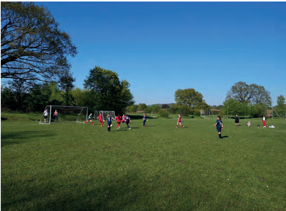
D-Mädchen Spiel am 01. Mai