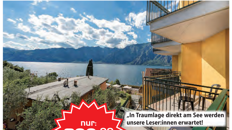
„In Traumlage direkt am See werden unsere Leser:innen erwartet!“