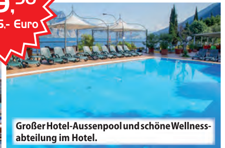
Großer Hotel-Aussenpool und schöne Wellness-Abteilung im Hotel.