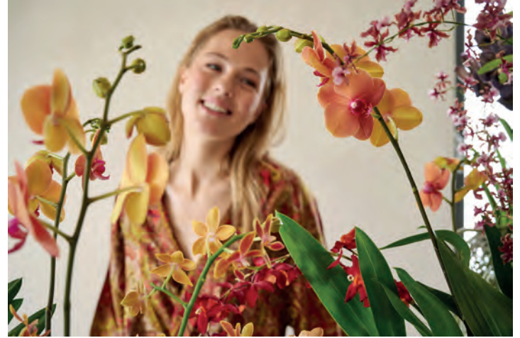
Phalaenopsis sind besonders schön, zugleich äußerst robust und blühen länger und häufiger als andere Orchideenarten.

halb nicht mehr so stark gegen ihre Eltern rebellieren, wie dies noch ein, zwei Generationen zuvor der Fall war. Ist das Verhältnis besonders eng und harmonisch, hört man heute sogar häufig den Satz, die Eltern seien die besten Freunde. Was nach dem perfekten Szenario klingt, wird von Familientherapeuten allerdings zumeist kritisch gesehen. Sie empfehlen Müttern und Vätern, in ihrer Elternrolle zu bleiben und nicht zu versuchen, „best buddies“ der eigenen Töchter und Söhne zu werden. Denn damit diese sich zu eigenständigen und unabhängigen Persönlichkeiten entwickeln können, sei es wichtig, ihnen ein souveränes Vorbild und zuverlässiger Wegbegleiter zu sein, notwendige Grenzen zur Sicherheit und Orientierung vorzugeben und sie mit viel Liebe nicht nur an die schönen Dinge des Lebens, sondern auch an die Pflicht-