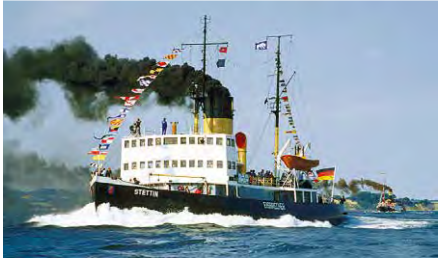
Unter Reporter-Flagge auf großer Volldampf-Kreuzfahrt starten unsere Leser:innen mit der „MS Stettin.“

Nach der Busanreise ab Oldenburg und Lensahn startet die große Nord-Ostsee-Kanal-Kreuzfahrt in Rendsburg auf einer der weltweit am stärksten befahrenen Wasserstraßen