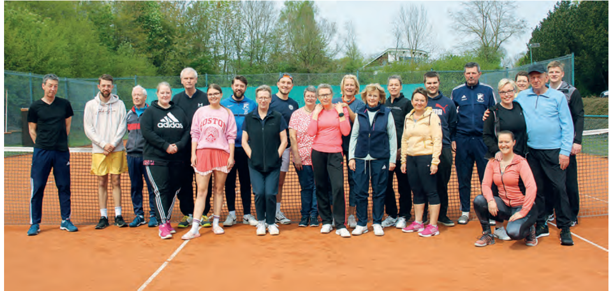
B Mädchen vom Spiel am 1. Mai

Am 04.05.24 ging es dann für die B-Mädchen des SV Knudde 88 Giekau nach Klausdorf. Um 14:00 Uhr war Anstoß beim Auswärtsspiel gegen die Mädchen des TSV Klausdorf. Mit einem klaren Ergebnis von 2:19 konnten die B-Mädchen des SV Knudde 88 Giekau das Spiel für sich entscheiden. Glückwunsch zum Auswärtssieg! Bilanz dieser Woche: 4 Spiele und 33 Tore! Super Start in den Wonnemonat! Wer Zeit und Lust hat beim SV Knudde 88 Giekau mal den Ball ins Rollen zu bringen: Kommt doch vorbei und schaut euch das Training an. Einfach mal reinschnuppern! Ihr seid alle herzlich eingeladen! Meldet euch gerne bei Sarina Ginnut unter 0160-4573535 oder bei Sven Grapatn unter 0151-50617363.