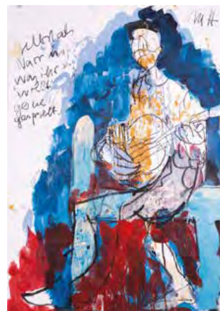
Selbst als Narr in „Was ihr wollt“, o.J., Mischtechnik auf Papier, © VG Bild-Kunst, Bonn 2024, Foto: Margret Witzke

Bitte beachten Sie: Die Ausstellungsräume sind lei-