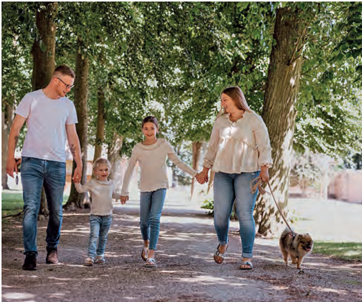
„Auf zum Dorffrühstück!“

In Grube freuen sich alle schon jetzt - über diese besondere Aktion am Muttertag - und über diesen gemeinsamen, fröhlichen Mai-Morgen. Jeder kann dazu mitbringen, was er mag - wie Geschirr, Besteck und die persönlichen Lieblings-Frühstückszutaten.