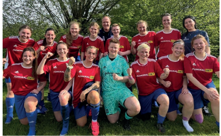
Verdienter Sieg für die B-Mädchen gegen die SSG Rot Schwarz Kiel.

Am Freitag starteten die B-Mädchen des SV Knudde Giekau mit einem Heimspiel gegen die SSG Rot-Schwarz Kiel. Auch wenn der