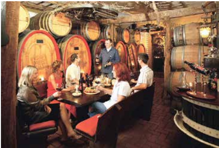
Höhepunkt einer jeder Wein-Reise an Rhein und Mosel ist eine besonders stimmungsvolle Weinprobe mit dem Winzer, wobei unsere Leser:innen fünf Weine in uriger Umgebung zur Weinlese probieren können.

Anmeldungen und Buchungen sind ab sofort möglich bei den Reporter-Leser-Reisen in Eutin per Telefon 04521/701130 oder direkt online im Internet unter „leser-reisen.der-reporter.info“.