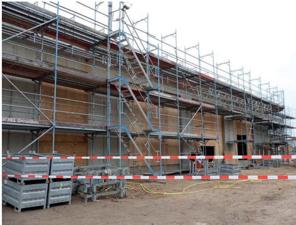
Erweiterungsneubau der Feuerwehrtechnischen Zentrale in Lensahn.

bau setzt der Kreis Ostholstein diese Maßstäbe fort und schafft mit der Feuerwehrtechnischen Zentrale die Voraussetzung für die nächsten Jahrzehnte.