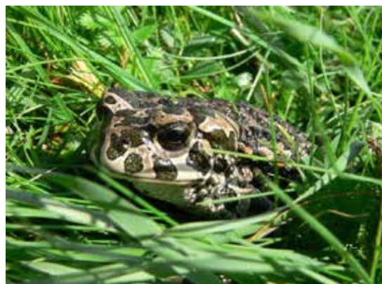
Eine Wechselkröte im dichten Gras.