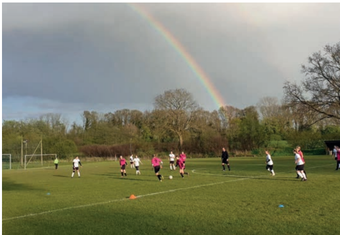
Erfolgreiches Heimspiel bestritten: Die Damen des SV Knudde 88 Giekau.