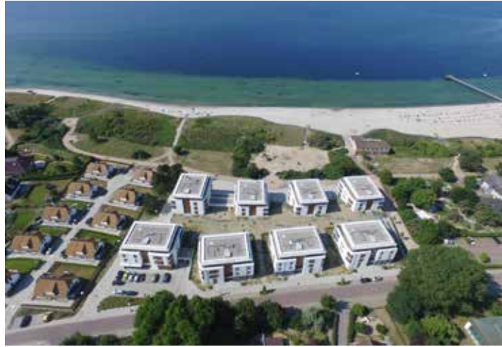
Mit seiner traumhaften Lage direkt am Südstrand, dem beeindruckenden Meerblick, der hochwertigen Ausstattung und vielseitigen Freizeitmöglichkeiten definiert das Südkap modernen Urlaub an der Ostsee neu.