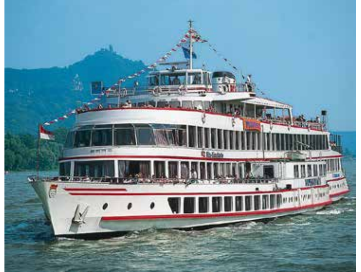
Herrliche Rhein- und Mosel-Kreuzfahrten gehören zum großen Genießer-Programm der Reporter-Sonder-Reise im August 2024 zur Zeit der Weinlese.

Zum großen Leistungspaket gehören neben der Fahrt im erstklassigen Fernreisebus ab Oldenburg, Lensahn und Lütjenburg vier Übernachtungen im Winzer-Hotel nebst Gästehaus direkt an der Mosel mit 4 x Schlemmer-Frühstück vom Buffet und 4 x Abendessen im Hotel als Buffet oder 3-Gang-Menü. Zum Rahmenprogramm gehören preisinklusive ein großer Panorama-Ausflug zu den „Höhepunkten am Rhein“ mit Besuch im Weinstädtchen Rüdesheim mit Freizeit zum Bummel in der „Drosselgasse“ und eine mehrstündige Erlebnis-Schiffahrt entlang des Mittelrheins „rund um die Loreley“ sowie am nächsten Tag ein großer Erlebnis-Ausflug in die verträumten Mosel-Weindörfer entlang der Uferstraße und der Mo-