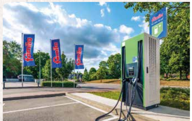
Einkaufen und aufladen bei famila, wie hier in Kiel-Russee.

In diesem Jahr fließen mehr als 1 Million kWh Strom durch unsere Ladepunkte in E-Fahrzeuge. Das reicht für rund 6 Millionen emissionsfreie Kilometer – etwa 150-mal um die gesamte Erde.