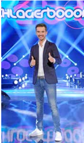
Florian Silbereisen präsentiert live in Dortmund Europas erfolgreichste Schlager-Fernseh-Show.

Oldenburg/Lütjenburg/Lensahn. (t) Freuen Sie sich auf das musikalische Schlager-Feuerwerk der Spitzenklasse im „Goldenen Herbst“ in Dortmund vom 18. bis 19. Oktober