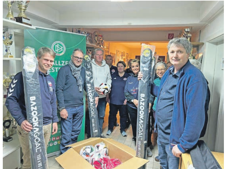
Schleswig-Holsteinischer Fußballverband zu Besuch beim SV Knudde 88 Giekau

Grund für den Besuch des Schleswig-Holsteinischen Fußballverbandes war die Übergabe des Gold Preises an den SV Knudde 88 Giekau. Der Preis stammt aus einem Wettbewerb „DFB Punktspiel“ der anlässlich der Europameisterschaft initiiert