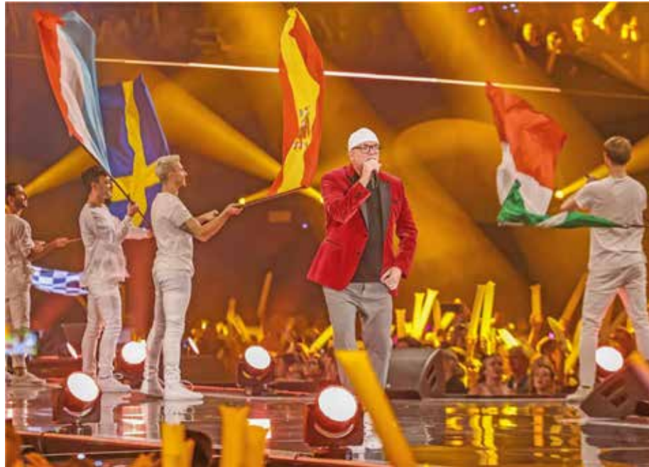
Die deutschen Top-Stars des Schlagers live erleben unsere Leser:innen bei der ARD-Show in Dortmund.

2024 mit der Live-Aufzeichnung der ARD-Fernseh-Show „Schlagerboom“ mit Florian Silbereisen. Unsere Leser:innen genießen dabei live in der legendären Dortmunder Westfalenhalle die einmalige prickelnde Fernseh-Atmosphäre, die später ein Millionen-Publikum an den Fernseh-Bildschirm erlebt. Das Schlager-Feuerwerk erster Güte präsentieren unzählige deutsche Schlagerstars mit ihren aktuellen Hits.