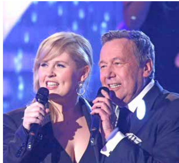
Reisebus ab Oldenburg, Lüt- der-reporter. Info“.

Anmeldungen werden in der Reihenfolge der eingehenden Buchungen gerne entgegen genommen bei den Reporter-Leser-Reisen in Eutin, Lübecker Straße 12, Montag bis Freitag von 9 bis 13 Uhr oder mit Direkt-Buchung im Internet „leserreisen.“