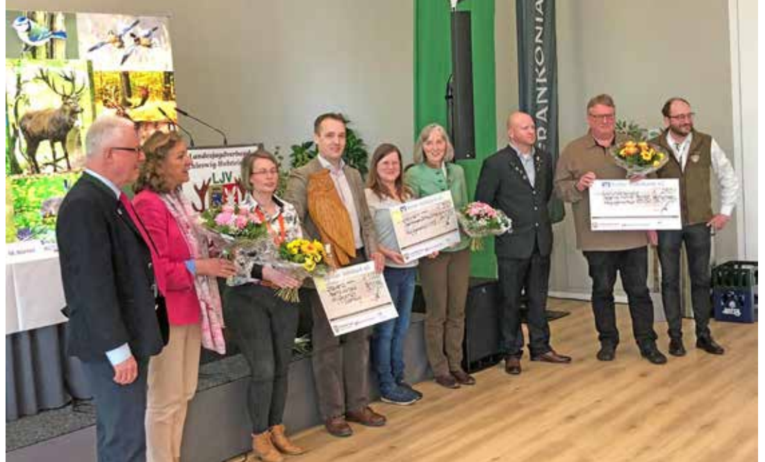
Feierliche Übergabe des hölzernen Uhus und der Preisgeld-Checks auf dem Landesjägartag in Neumünster.

Wangels. (jpf) Mit dem Hubertus-Cup zeichnet der LJV (Landesjagdverband) Schleswig-Holstein alljährlich Reviere, Hegeringe, Kreisjägerschaften, Einzelpersonen oder jagdliche Gemeinschaften aus, welche sich im Bereich der Jugend- und Öffentlichkeitsarbeit erfolgreich für die Jagd engagiert haben. In diesem Jahr ging die Auszeichnung, ein Wanderpokal in Form eines hölzernen Uhus und 1000,- Euro Preisgeld, an den Hegering Wangels für seine vielen Aktivitäten wie z.B. den abendlichen Kinderansitz in den Revieren, die gemeinsam mit den Kindergartenkindern durchgeführte Produktion von Singvogel-Futterglocken, lehrreiche Waldspaziergänge mit dem Berufs-