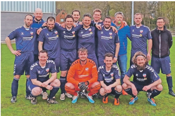
Alte Herren TSV Selent gegen „recyclte Teenager“

wurde. Auch der 12.04.2024 war ein besonderer Tag im Vereinsleben des SV Knudde 88 Giekau. Die Alten Herren des TSV Selent hatte unsere „recyclten Teenager“ eingeladen. Mit viel Spielfreude, Spaß, Engagement und um jeden Ball (also fast jeden) kämpfend wurde das erste Spiel im Jahr 2024 mit einem 1:1 beendet. Großartiges Team!