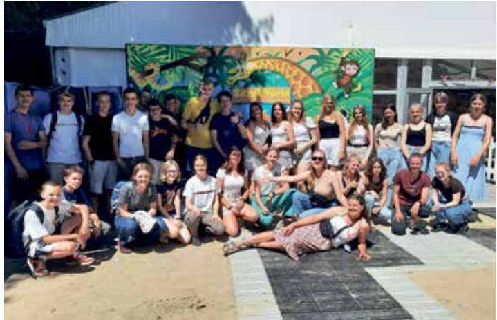
England: Ausflug ins Sandworld

wohnen die Jugendlichen in Gastfamilien und haben vormittags Sprachunterricht in kleinen Gruppen bei einheimischen Lehrern. Dazu kommt ein buntes Programm mit Sport, Strandspaß, Aus-