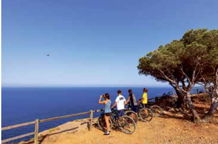
Ausflug in Spanien

Wattenmeer. Für die Fahrten nach Spanien und Föhr können bei Bedarf Zuschüsse gewährt werden. Weitere Infos gibt es beim AWO Jugendwerk Unterelbe unter Tel. 04101/205737 oder auf der Homepage awo-jugendwerk.com.