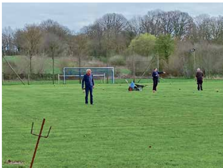
Letzte Arbeiten auf dem Platz