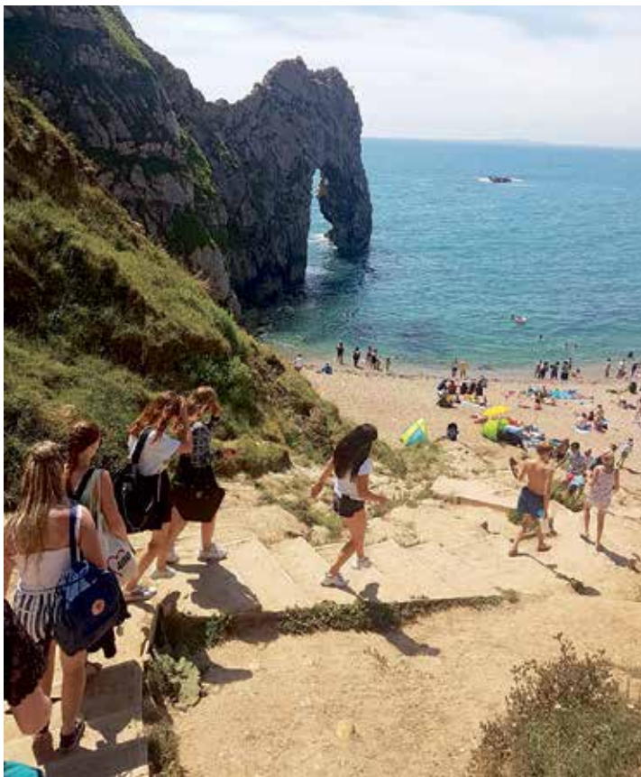
Wanderung zum Weltkulturerbe Durdle Door