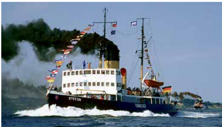
Unter Reporter-Flagge auf großer Volldampf-Kreuzfahrt starten unsere Leser:innen mit der „MS Stettin.“

Nach der Busanreise ab Oldenburg und Lensahn startet die große Nord-Ostsee-Kanal-Kreuzfahrt in Rendsburg auf einer der weltweit am stärksten befahrenen Wasserstraßen der Welt mit einem zünftigen Bord-Frühstück für alle Leser:innen und der