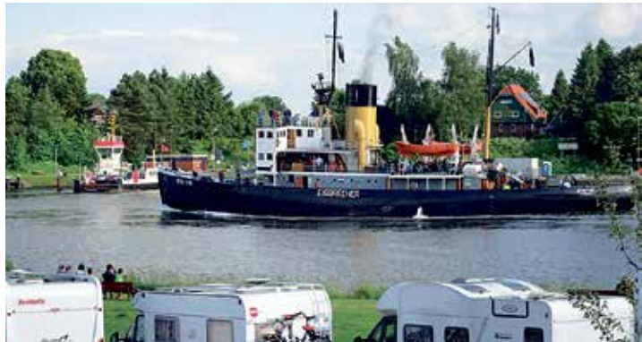
Fünf Stunden genießen unsere Leser:innen die große Nord-Ostsee-Kanalfahrt in gemächlichem Tempo.

Kurs der fünfstündigen Erlebnis-Kreuzfahrt führt mit vielen fachkundigen Erklärungen und Besichtigungen der Schiffs-Technik und der Brücke an Bord nach Kiel mit voller Kraft und kräftigem schwarzen Kohlen-Dampf geht es auf Kurs Landeshauptstadt, wo unsere Leser:innen am Nachmittag noch zwei Stunden in der Hafencity zur freien Verfügung genießen können (bei Termin 1 mit Top-Erlebnis Kieler Wo-