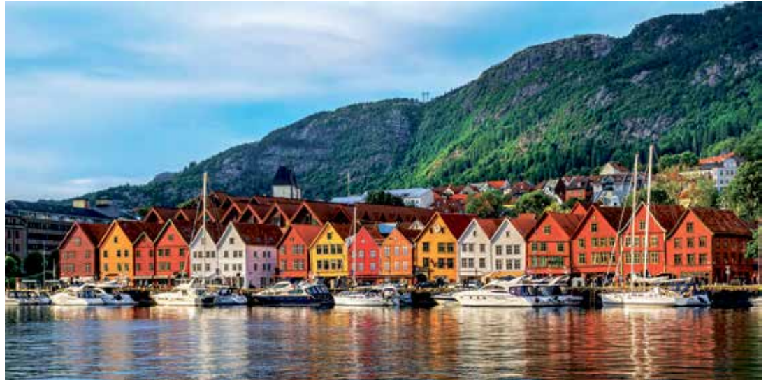
Bei einer großen Stadtrundfahrt mit Reiseleitung entdecken unsere Leser:innen die alte Hansestadt Bergen.

Bereits als Auftakt genießen unsere Gäste die große Norwegen-Küsten-