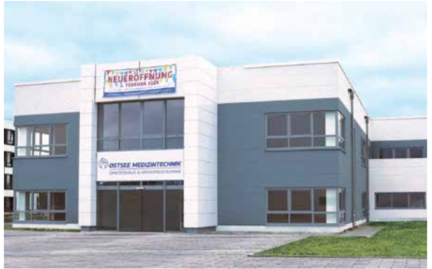
Die neue Geschäftsstelle Zentrale mit Werkstätten.