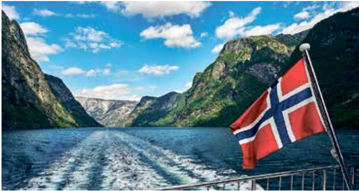
Die Schifffahrt auf dem weltberühmten Geirangerfjord ist für unsere Leser:innen einer der Höhepunkte der großen Fjord-Rundreise.

direkt online im Internet unter „leserreisen.der-reporter.info“ oder der Sonder-Druck kann im Leser-Reisen-Büro direkt angefordert werden. Anmeldungen zu diesen ganz besonderen Nordland-Rundreisen sind ab sofort möglich bei den Reporter-Leser-Reisen in Eutin, täglich von 9 bis 13 Uhr, per Telefon 04521/701130.