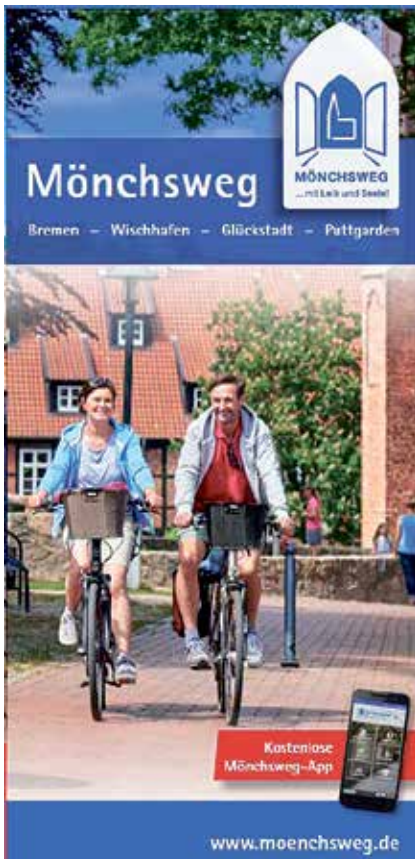
Niedersächsisches Hallenhaus im Alten Land.

Ein kostenloser Flyer mit Übersichtskarte und einer Auswahl erlebbarer Highlights erleichtert die Planung. Einfach bei der Geschäftsstelle Mönchsweg anfordern und die Vorfreude auf den Radurlaub beginnt. Radpilgerpass, individuelle Beratung für die Reiseplanung sowie die Mönchsweg-App für Schleswig-Holstein runden den kostenlosen Service ab: T. 0431/ 128 508 73, info@moenchsweg.de . Das Radtounbuch Mönchsweg