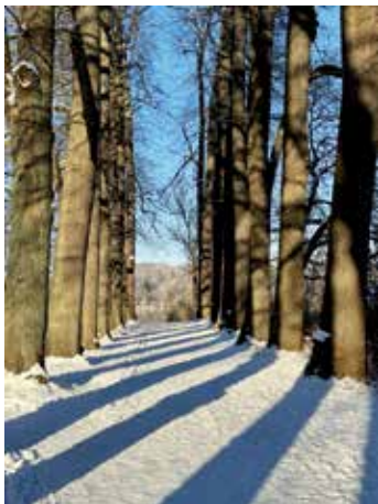
Lindenallee im Schlossgarten.

Eutin. (mh) Den winterlichen – wenn auch nicht unbedingt verschneiten – Schlossgarten bei einem Spaziergang entdecken, können Interessierte am Samstag, 27. Januar mit dem erfahrenen