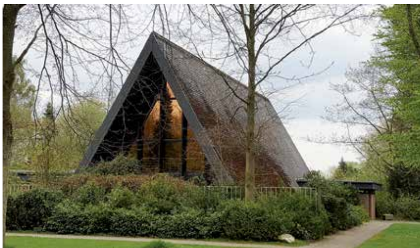
Die Friedenskirche.

Parkplätze sind am Friedhof Eutin-Neudorf vorhanden. Das Zentralarchiv ist aber auch ab