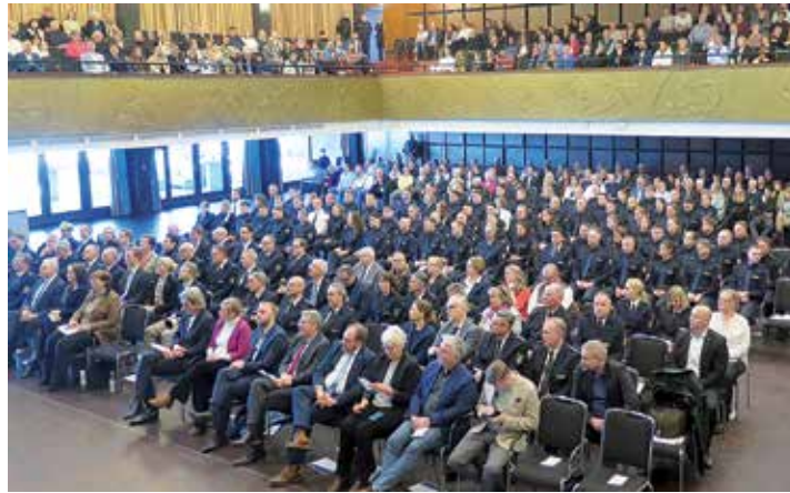
Der Festakt zur Ernennung der 78 Polizeiobermeisterinnen und -obermeister erfolgte vor einer beeindruckenden Kulisse.

Am Ende ihrer Festrede ermutigte die Innenministerin die jungen Polizistinnen und Polizisten, auf die eigenen Fähigkeiten und die in der Ausbildung erworbenen Kompetenzen zu vertrauen. Sütterlin-Waack versprach dem Polizeinachwuchs die notwendige Rückenstärkung: „Seien Sie sich sicher: Wir stehen hinter Ihnen und geben das Beste im Rahmen unserer Möglichkeiten. Gehen Sie