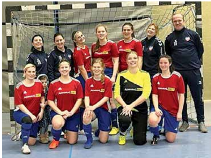
Die Mannschaft nach dem Turnier.

die Damen des SV Knudde 88 Giekau gegen Boostedt mit einem 0:2 Sieg. Die Spiele gegen Kalübbe und Bösdorf wurden knapp verloren. In der zweiten Spielrunde konnten die Damen des SV Knudde