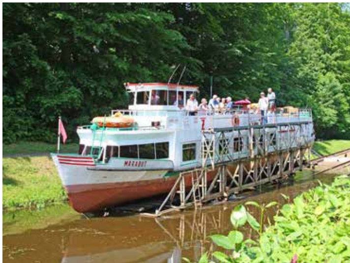
Über die „rollenden“ Berge erleben die Reporter-Leser eine ganz besondere Schiffahrt in Polen von Weltruhm.

Komfort-Hotel der Mittelklasse (Landeskategorie) in sehr zentraler Lage in Frauenburg mit deutschsprachigen Gastgebern und mit reichhaltiger Halbpension. Vom Hotel aus erfolgen die täglichen Ausflüge, die alle im Reisepreis mit enthalten sind, zu den Attraktionen des Landes mit deutscher Reiseleitung. Alle Infos und den kompletten Reiseverlauf finden unsere Leser:innen online im Internet unter „leserreisen.