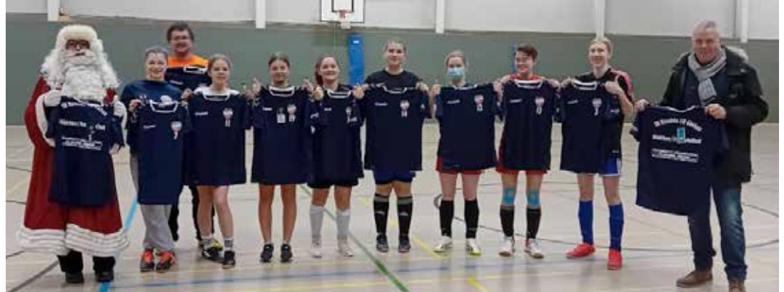
Weihnachtsmann mit Mädchen