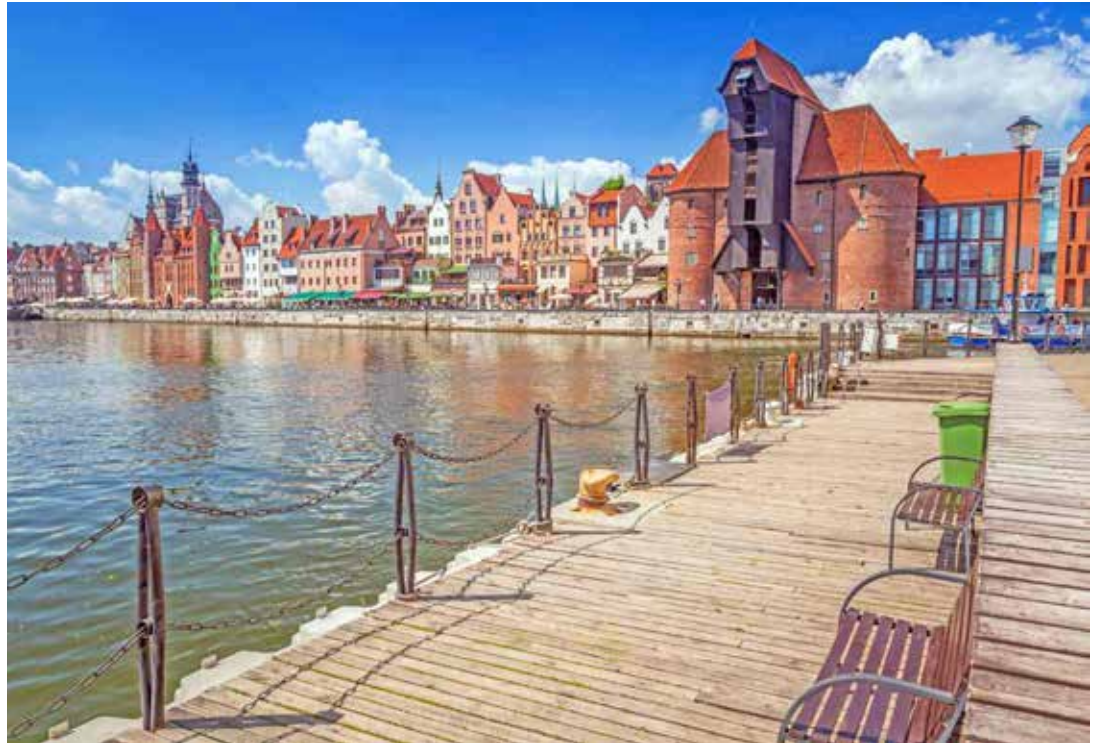
Die weltberühmte Hansestadt Danzig ist eines der Ziele der Tagesausflüge bei der Reporter-Rundreise in Polen.

„Residieren werden die Reporter-Leser:innen im festen Standort-Hotel ohne lästigen Hotelwechsel am „Frischen Haff“ im guten