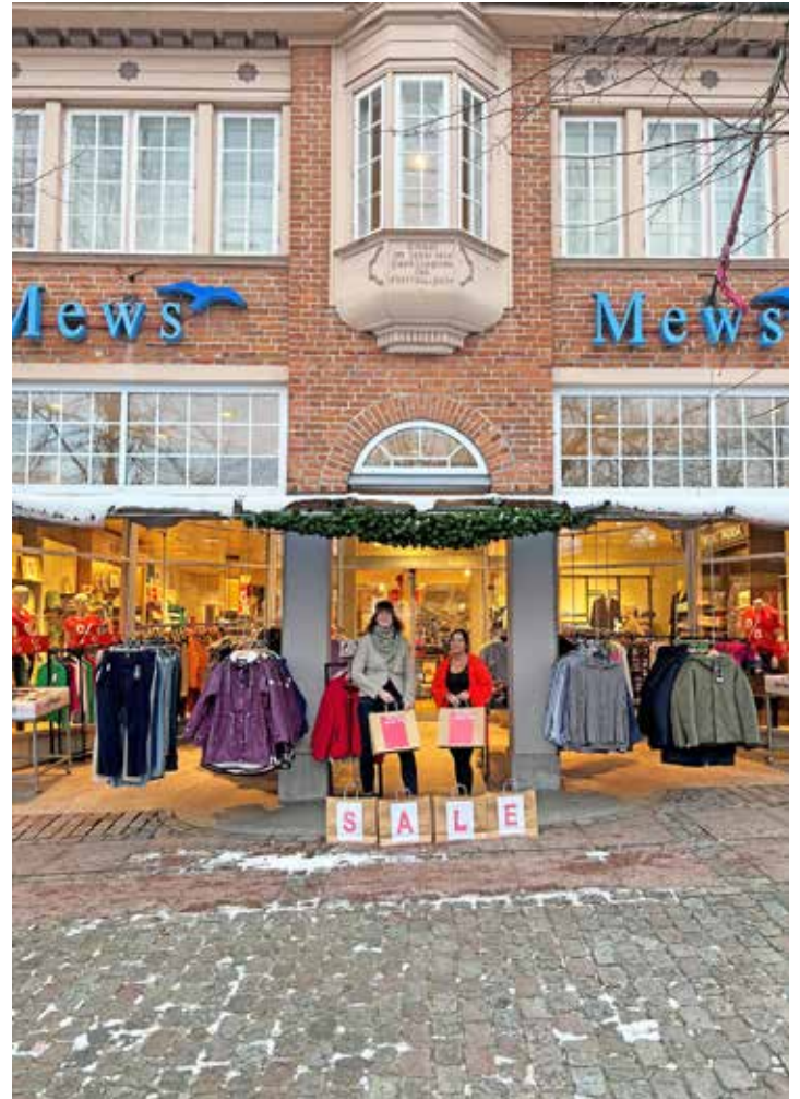
Das Modehaus Mews startet in den Winterschlussverkauf mit attraktiven Angeboten

Der Winterschlussverkauf bei Mews ist nicht nur eine Gelegenheit, die Garderobe mit erstklassigen Kleidungsstücken zu füllen, sondern