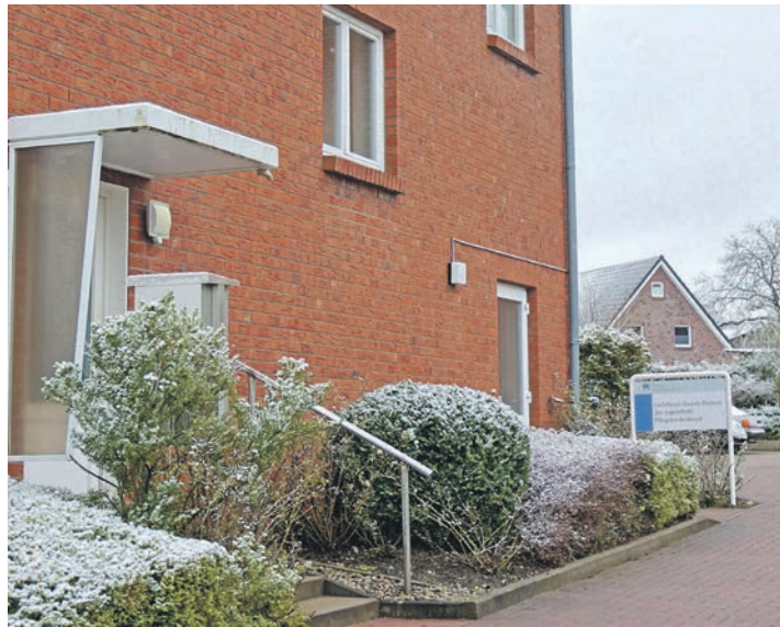
Pflegekinderdienst im Meinsdorfer Weg in Eutin.

Eutin. (as) Es gibt verschiedene Gründe, weshalb Eltern Unterstützung bei der Erziehung ihrer Kinder brauchen und eine Trennung des Kindes von seiner Herkunftsfamilie nötig werden kann. Das Engagement von Pflegefamilien, Kindern aus diesen Familien ein Zuhause anzubieten, sie für einen kurzen oder langen Zeitraum liebevoll zu betreuen, ist für die betroffenen Kinder eine wertvolle Unterstützung. Für Pflegefamilien bedeutet dies, Verantwortung für ein Kind zu übernehmen, das nicht nur seinen Lieblingst Teddy, sondern auch seine bisherige Geschichte mitbringt. Die Betreuung eines Kindes in einer Pflegefamilie stellt eine besondere Form der „Hilfen zur Erziehung“ dar. Privatpersonen, auch ohne pädagogische Ausbildung, übernehmen Aufgaben der öffentlichen Erziehungshilfe. Der Pflegekinderdienst des Kreises Ostholstein ist stets auf der Suche nach neuen