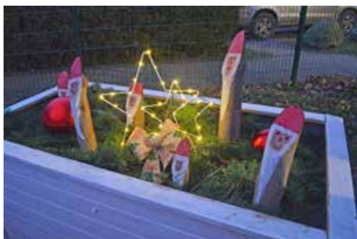
Einer der beiden Pflanzkästen, wunderschön weihnachtlich dekoriert.