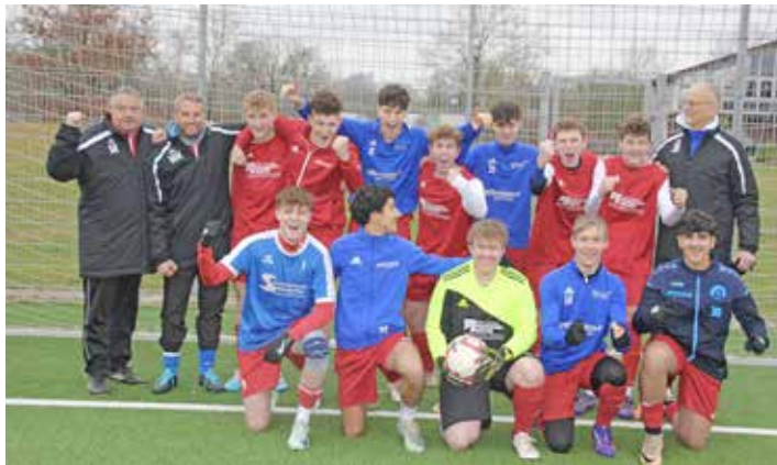
Mannschaftsfoto SG Selent/Lütjenburg