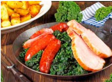
Schlemmen und genießen können unsere Leser:innen beim Winterfest mit Grünkohl „satt“.

Oldenburg / Lütjenburg (t). Nach dem großartigen Erfolg des Kurier-Sommer-Festes, von dem unsere Leser:innen mit sehr großer Begeisterung zurückgekehrt sind, führt uns der Kurs zum Kurier-Winterfest am 9. Februar 2025 (Sonntag) in die malerische Region des Alten Landes und des Elbstromes. Nach der komfortablen Anreise im erstklassigen Fernreisebus direkt ab Oldenburg und Lütjenburg stärken unsere Leser:innen sich zunächst mit der regionalen Schlemmerküche