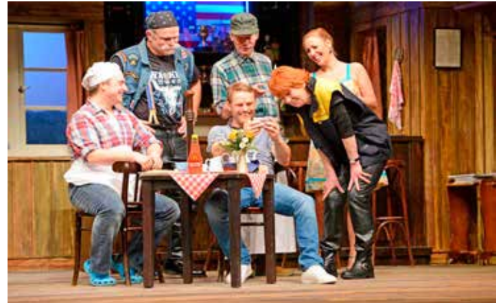
Ein höchst vergnüglicher Theaternachmittag erwartet unsere Leser:innen mit der turbulenten plattdeutschen Komödie „De Aantenkrieg“.

sich mit Kaffee und hausgemachtem Landhaus-Kuchen verwöhnen zu lassen, bevor gegen 17.30 Uhr die Rückreise in die Heimatorte erfolgt. Das Komplettpaket ist zum Sonderpreis von nur 69,90 Euro inklusive der Busfahrt ab Oldenburg und Lütjenburg ab sofort buchbar bei den Kurier-Leser-Reisen des Burg-Verlages