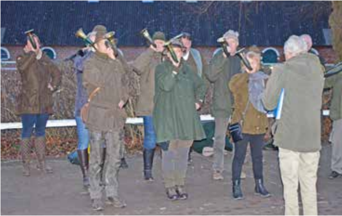
Am Sonntagnachmittag unterhielten die Jagdbläser unter großem Applaus die anwesenden Besucher:innen.

noch den einen oder anderen Dekoartikel zu erwerben, Weihnachtsgeschenke für die Lieben zu kaufen oder bei leckerem Essen und Getränken die Geselligkeit zu pflegen. Das Angebot war groß, die Festscheune prachtvoll hergerichtet, so dass sich alle einig waren: der Weg nach Gut Helmstorf hat sich auf jeden Fall