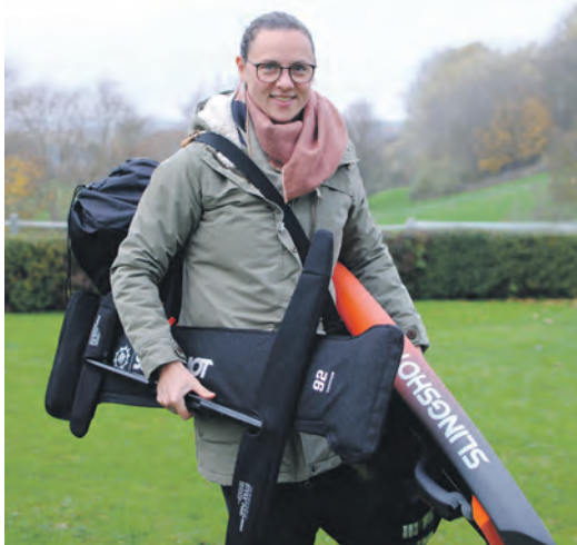
Die gesamte Ausrüstung wiegt weniger als zehn Kilo. Gut zu erkennen: der Foil mit Haupt- und Heckflügel.