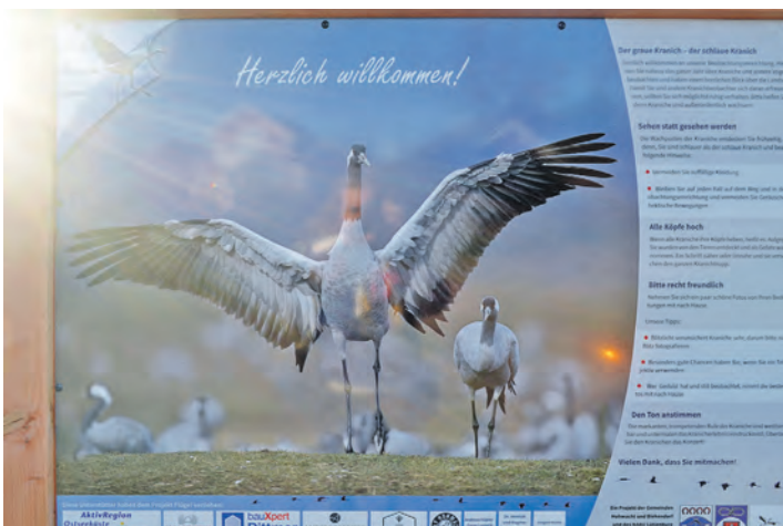
Viele Hinweistafeln informieren über Flora und Fauna.

man einen schillernden Eisvogel und der neue Aussichtsturm eignet sich besonders für die Kranichbeobachtung, ein einmaliges Schauspiel, sie bei ihrem Hochzeitsanzug oder dem abendlichen Anflug zu sehen.