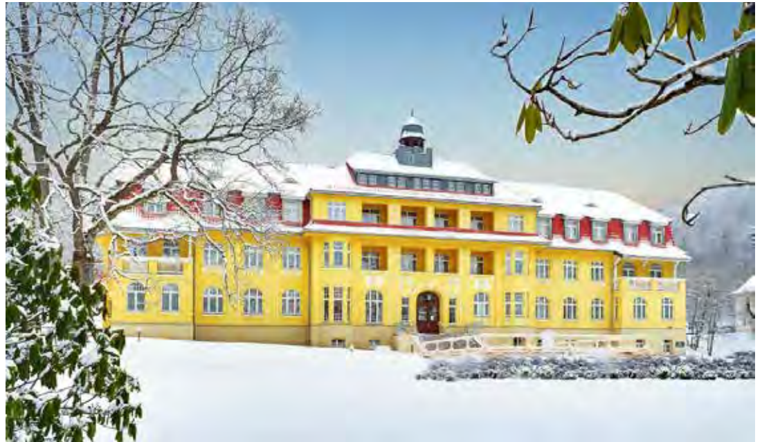
Stilvolle Jugendstilvilla im malerischen Harz: Das Vertragshotel mit besonderem Charme erwartet unsere Leser:innen am Valentinstag.

Oldenburg/Lensahn/Lütjenburg (t). Die winterliche Bilderbuch-Landschaft des Harzes erwartet unsere Leser:innen zum ganz besonderen Preis-Schnäppchen zum Valentinstag 2025 vom 13. bis 14. Februar 2025 mit der großen Sonder-Reise direkt ab Oldenburg, Lütjenburg und Lensahn mit Unterkunft im Top-Hotel im Südharz in einer malerischen Jugendstil-Villa mit komfortablen Hotel-Zimmern und leckerem Frühstücks- und warm/kaltem Abend-Bufferet mit der besonderen Verlags-Zugabe zum Valentinstag mit einem all-inclusive-Getränke-Paket zur Speisezeit zum Abendessen (Weißwein/Rotwein/Biere/Softgetränke). Außerdem im Preis enthalten: Das Zug-Ticket für den zweiten Tag für die berühmte „Brockenbahn“ zur winterlichen Schienen-Kreuzfahrt „unter Voll-