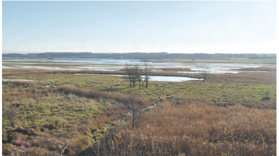
Weit über den Binnensee reicht der Blick vom Aussichtsturm.