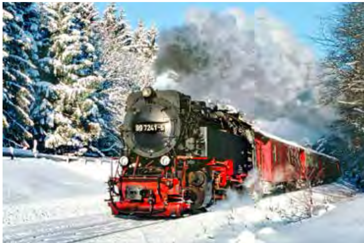
Top-Erlebnis unter Volldampf: Die Schienen-Kreuzfahrt auf den Brocken durch die Winterwelt.

dampf“ von Wernigerode bis zur Brockenbahn-Mittelstation nach Drei Annen Hohne. Dazu das Kurier-Top-Angebot: Die ersten 12 Einzelzimmer ohne Zuschlag! Zum großen Leistungspaket zum sehr günstigen Komplettpreis von nur 169,90 Euro gehören neben der Fahrt im erstklassigen Fernreisebus eine Übernachtung im historischen Komfort-Hotel im Südharz mit großem Frühstücks- & Abend-Bufferet sowie einem Getränke-Paket zur Speisezeit zum Abendessen laut Beschreibung.