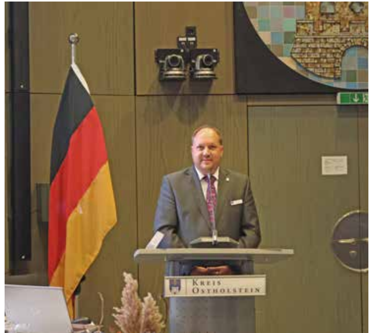
Landrat Gaarz ruft zur Teilnahme an den örtlichen Gedenkveranstaltungen auf

Vergangenheit nicht erneut wiederholen sollten. Der Angriffskrieg Russlands auf die Ukraine zeigt jedoch, dass Frieden keine Selbstverständlichkeit ist. Auch an vielen anderen Orten auf der Welt werden Menschen immer noch Opfer von Krieg, Terror und Gewalt. Zum diesjährigen Volkstrauertag am 17.11.2024 erinnert der Kreisverband Ostholstein des Volksbundes Deutscher Kriegsgräberfürsorge um