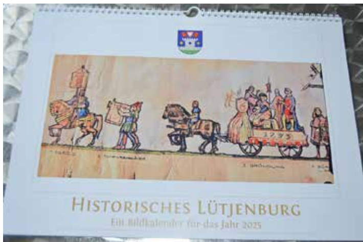
Das Titelbild schmückt die Darstellung der Szene, wie 1275 die Stadtrechte verliehen wurden.

Rathaus, in der Tourist-Info und bei der Buchhandlung am Markt in Lütjenburg. Und das trotz gestiegener Produktionskosten zum Vorjahrespreis von 13,- €.