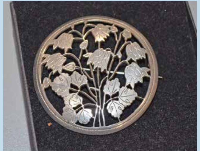
Das schöne Schmuckstück, gefertigt im Jahr 1869.

Lütjenburg (cm). Ein ganz besonderes Schmuckstück hat nach vielen Jahrzehnten sozusagen den Weg zurück in die Heimat nach Lütjenburg gefunden: eine Dame aus Hamburg, die namentlich nicht genannt werden möchte, übergab vor Kurzem Bürgermeister Dirk Sohn eine handwerklich sehr schön gestaltete silberne Brosche, die sie bei einem Trödelladen erstanden hatte. Die gravierte Inschrift auf der Rückseite zeigt, dass sie im Jahr 1869 von Boll in Lütjenburg gefertigt wurde. Von 1767 bis 1837 lebte und wirkte der Goldschmied Johann Carl Friedrich Boll in Lütjenburg. Das Schmuckstück muss demnach von einem seiner Söhne Hans Friedrich Boll oder Johann Christian Friedrich Boll gefertigt worden sein, die beide in seine Fußstapfen traten.