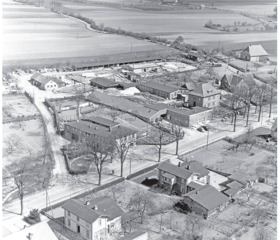
Historische Luftaufnahme, das „Kinderheim Ost“ lag am Schwienkuhler Weg