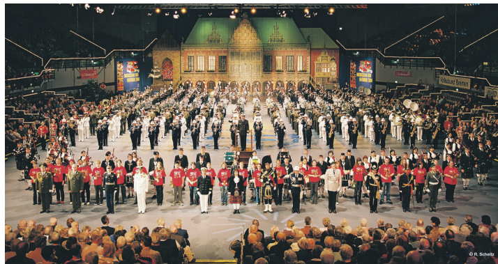
Ein einmaliges Erlebnis: Mehr als 700 Musiker und Tänzer präsentieren das große Final-Bild in der Event-Halle in Bremen.

Der Kartenvorverkauf startet ab sofort. Erhältlich sind die Tickets ab 20,00 Euro in der Tourist Information im Rathaus, Teichstraße 12 in 23775 Großenbrode. Weitere Informationen können telefonisch unter 04367-997130 oder per E-Mail an info@grossenbrode.de erteilt werden. Der Einlass beginnt um 19.00 Uhr, die Show startet um 20.00 Uhr im MeerHuus.