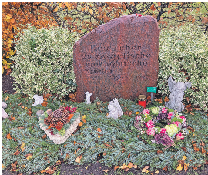
Grabstein auf dem Lensahner Friedhof

Kinder von Zwangsarbeiterinnen galten im nationalsozialistischen Deutschland als unerwünscht. Wurden Frauen trotz ihrer ohnehin prekären Lebensumstände schwanger, wurden viele von ihnen zu Abtreibungen genötigt. Andere mussten ihre Neugeborenen in