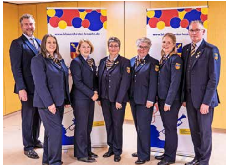
Der Vorstand des Bläserorchesters