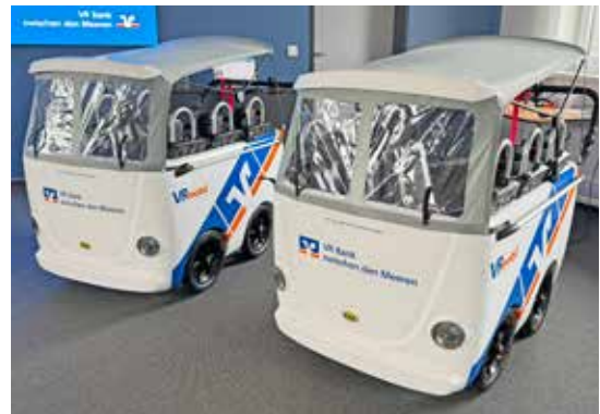
Die „Kinderbusse“ stehen zur Übergabe bereit.