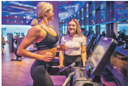
Neueste Trainingstechnologie in modernem Ambiente im Sports Club.

Lütjenburg (as). Wer sein Immunsystem und seine Abwehrkräfte für die bevorstehenden Wintermonate wappnen und zugleich überzähligen Pfunden oder erhöhtem Bluthochdruck die rote Karte zeigen möchte, für den hat der Sports Club jetzt ein sagenhaftes Black-Friday-Spar-Angebot parat. Für einen Monatsbeitrag von nur 29,90 (statt 59,90 €) kann man jetzt bei monatlicher Kündbarkeit trainieren und spart auch noch die halbe Aufnahmegebühr. Dieses besondere Angebot gibt es zeitlich begrenzt nur für die 50 schnellsten Anmeldungen. Ein individuelles Personal-Training inklusive umfangreicher Körperanalyse im Wert von 100,00 Euro ist darin