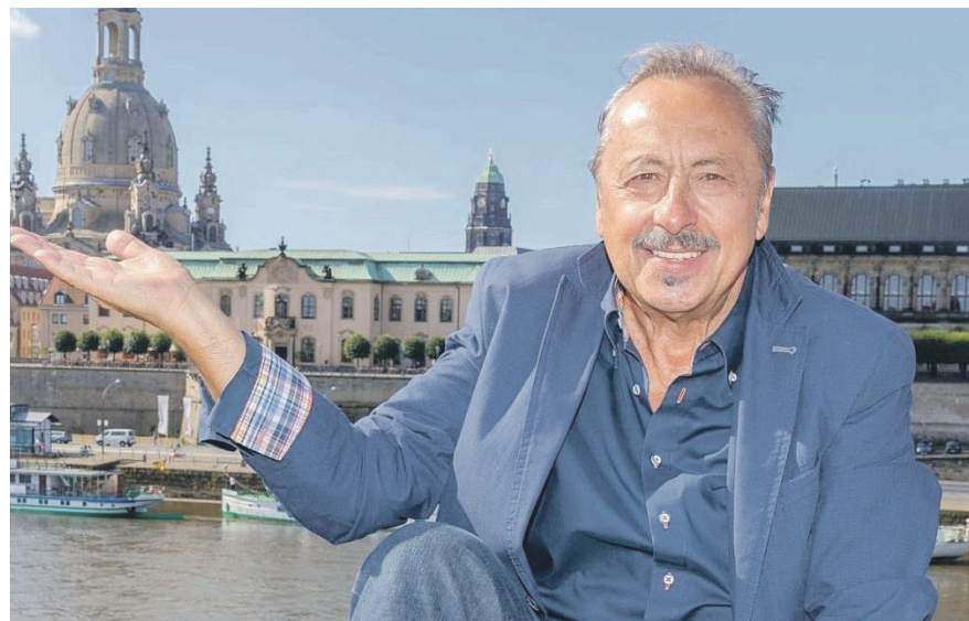
„Stubbe“ als Gefängniswärter „Frosch“ begeistert stets die Besucher und Besucherinnen der Semper Oper.

Oldenburg/Lensahn/Lütjenburg (t). „Sachsens Glanz & Gloria“ genießen unsere Leser:innen bei der großen Verlags-Sonder-Reise ins winterliche Elb-Florenz Dresden vom 3. bis 5. Januar 2025 ab Oldenburg, Lütjenburg und Lensahn zum einmaligen Schnäppchenpreis von nur 249,90 Euro (Einzelzimmer + 99,00 Euro), wo unsere Gäste das musikalische Aushängeschild der Semper Oper Dresden erwartet mit dem umjubelten Operetten-Erfolg „Die Fledermaus“ von Johann Strauß in einer großartigen Ausstattung und mit einem hochkarätigen Solisten-Ensemble sowie im Orchestergraben mit der weltberühmten Sächsischen Staatskapelle in ganz großer Besetzung