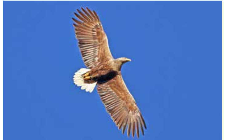
Majestätisch kreist der Seeadler – dank vielfältiger Schutzmaßnahmen heute wieder ein typisches Bild in Schleswig-Holstein.

arten auf. In den gewässerreichen Gebieten brüten Seeadler und Kormorane, in den Wäldern kommen verschiedene Singvogel- und Spechtarten vor, in Grünlandniederungen nisten Kiebitze und an den Küsten Rotschenkel und Sandregenpfeifer. Im Herbst und Frühjahr ziehen Millionen von Zugvögeln aus ihren skandinavischen und sibirischen Brutgebieten nach Süden und nutzen dabei Schleswig-Holstein