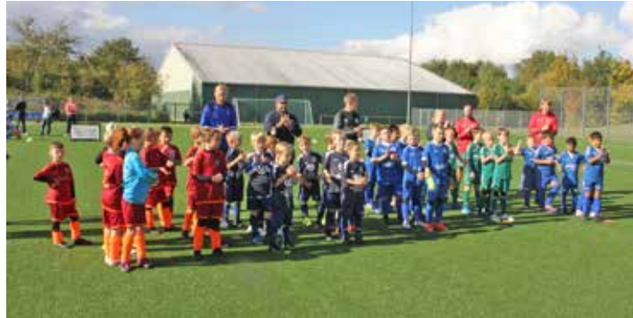
Treffen für ein gemeinsames Foto, das fand natürlich auch den Beifall.

Lütjenburg (rr). Das war ein tolles Funino Festival an der Schulsporthalle in der Kieler Straße in Lütjenburg, ein kindgerechtes Fußballturnier bei tollem Wetter. Mit neuen Spielformen wurde ein sehr intensiver Fußball geboten. Da spielten die Kinder in mehreren Runden mit einer Spieldauer von sieben Minuten. Der Veranstalter TSV Lütjenburg erklärte, das Funino eine Spiel- und Trainingsform ist, bei denen zwei Dreier-Teams auf vier Mini-tore kicken. „Sie soll die Spielintelligenz fördern und alle Spieler gleichermaßen fordern“. Erst ab dieser Saison soll Funino den Kinderfußball in ganz Deutschland sehr verändern.