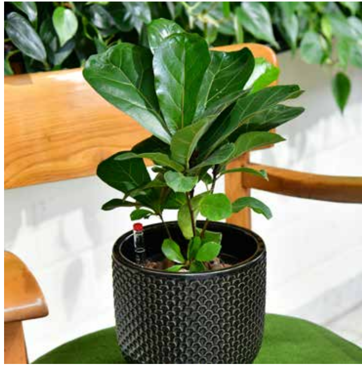
Die moderne Geigenfeige ( Ficus lyrata ) ist mit ihrem großen und schön geformten Laub zurzeit sehr beliebt.

„Es gibt Pflanzen, die eignen sich einfach besser fürs Büro als andere“, weiß Sonja Dümmer, Pflanzenexpertin und Gründerin von JobPflanze. „Dazu zählt ganz klar der Bogenhanf, botanisch Sansevieria . Die Sukkulente kann in ihren länglichen Blättern Wasser speichern und bei Bedarf darauf zurückgreifen. Gegossen werden muss sie daher nur sehr selten - tatsächlich ist weniger beim Bogenhanf sogar mehr, denn was er gar nicht mag ist Staunässe.“ Die moder-