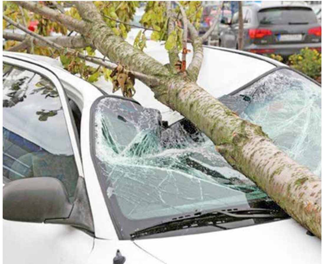
Mit Sturmschäden müssen Autohalter immer öfter rechnen.

Muss das Auto aufgrund eines Sturmschadens in die Werkstatt, kann das schnell teuer werden. Ob die Kfz-Versicherung für die Kosten aufkommt, hängt