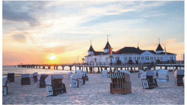
Die Traum-Insel Usedom erwartet unsere Gäste im mondänen Swinemünde zu gesunden Kur-Aufenthalten zu sehr günstigen Komplett-Preisen

im Hotel! Zum großen Leistungspaket der Sonder-Reisen vom 11. bis 16. November 2024 und vom 30. Januar 2025 bis 04. Februar 2025 zum sehr günstigen Komplettpreis von nur 399,90 € (Einzelzimmer-Zuschlag 148,00 €) gehören neben der Fahrt im erstklassigen Fernreisebus direkt ab Oldenburg, Lütjenburg und Lensahn fünf Übernachtungen im Wellness-Resort-Hotel mit Frühstücks- und Abend-Buffets sowie das komplette Kur-Paket inklusive ärztlicher Eingangsuntersuchung & 2 Kuranwendungen pro Werktag sowie die kostenfreie Nutzung des Wellness-Bereiches mit Hallenbad, Sauna und Dampfbad, das WLAN im Hotel ist kostenfrei zu nutzen und die