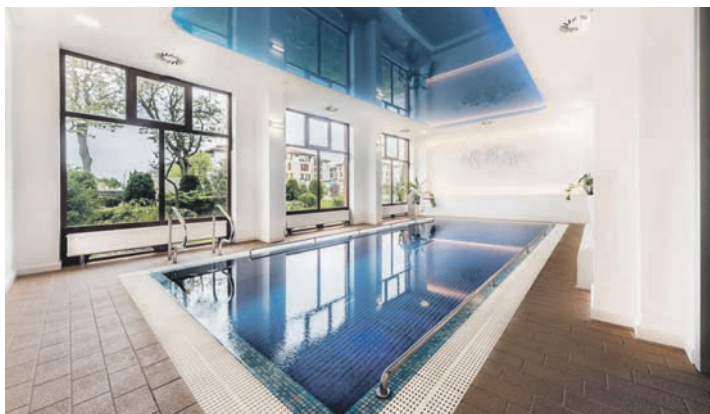
Herrlich relaxen und entspannen können unsere Leser:innen bei den Kur-Reisen in Swinemünde

Telefon 04521/701130, Montag bis Freitag von 9 bis 13 Uhr, oder direkt online im Internet unter „leserreisen.derreporter.info“