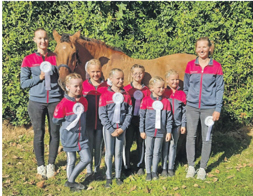
Die auf dem 3. Platz platzierten Turnierkinder.