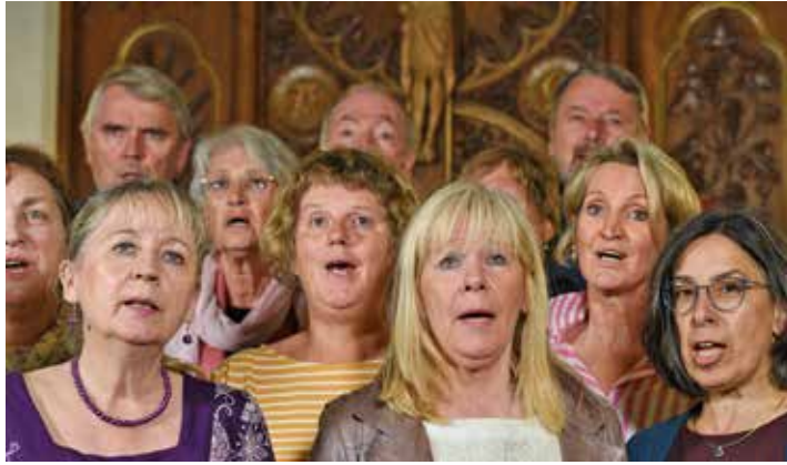
Das Foto zeigt Mitglieder des Regionalchors Holsteinische Schweiz bei einer Probe.

Auf dem Programm stehen die Ergebnisse der einzelnen Workshops und das sind die Choral-kantate „Christ ist erstanden“ von