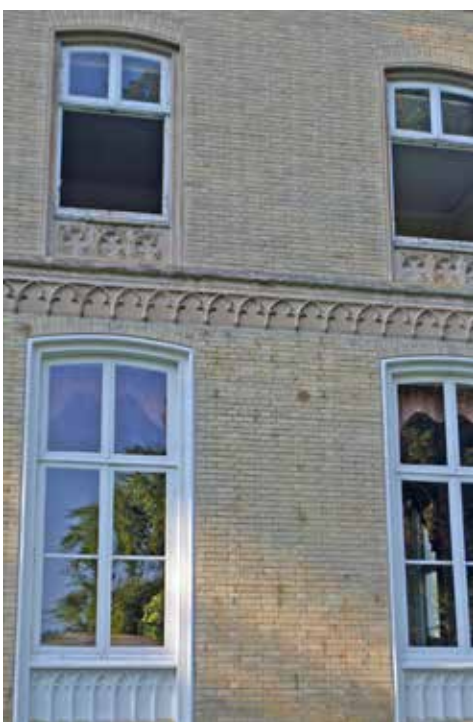
Deutlich zu sehen: oben im Bild die noch zu restaurierenden Fenster, im unteren Teil sind die Arbeiten abgeschlossen.