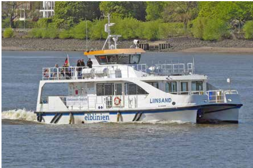
Unter Kurier- & Reporter-Flagge Kurs Dänemark reisen unsere Leser:innen bei der Premieren-Kreuzfahrt mit dem neuen Highspeed-Katamaran.

noch Freizeit zum Hafen-Spaziergang finden.