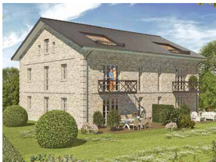
Südansicht des Gebäudes

und gemeinsam zur termingerechten Fertigstellung in einer „Punktlandung“ beigetragen. An dieser Stelle sei nochmals ein ausdrückliches DANKESCHÖN von der Bauherrenseite dafür ausgesprochen!