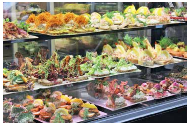
Grenzenlos schlemmen und genießen können unsere Gäste beim großen Smørrebrød-Buffet in Dänemark.