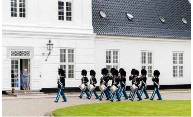
Das Sommerschloss der Königsfamilie in Traumlage direkt am See in Gravenstein.

Kurier- & Reporter-Flagge mit dem umweltfreundlichen Hybrid-Katamaran, der komplett emissionsfrei nur mit Batteriekraft unterwegs ist, führt zunächst vorbei an Glücksburg und den dänischen Ochsen-Inseln durch die Flensburger Innen- und Aussenförde rund um die Halbinsel Holnis und sodann Kurs Nord entlang der dänischen Inselwelt zur Insel Alsens und direkt zum Anleger am königlichen Schloss in Sonderburg, wo unsere Gäste