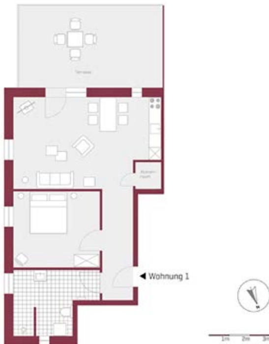
Grundriss Erdgeschoss Wohnung

GRUNDRISS Erdgeschoss links „barrierefrei“ 2 Zimmer / ca. 85 qm, incl. 5 qm Außenabstellschuppen