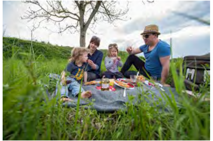
In Wiesen und an Waldrändern fühlen sich Zecken wohl.

mend und betäubend. Bis eine Zecke satt ist, können durchaus mehrere Tage vergehen. Krankheitserreger werden meist nicht direkt nach dem Stich, sondern oft erst Stunden später übertragen. Eine gezielte Zeckensuche nach einem Aufenthalt im Freien hilft, die lästigen Blutsauger zu finden und rasch zu entfernen: Experten empfehlen, den Parasiten hautnah mit einer Pinzette oder Zeckenzange anzufassen, um ihn danach mit möglichst wenig Druck herauszudrehen. Der Kopf darf nicht steckenbleiben. Von alten Hausmitteln wie Klebstoff oder Öl sollte man die Finger lassen. Sie helfen nicht, sondern schaden eher, denn im Todeskampf spritzt die Zecke oft Krankheitserreger in die Wunde. Gegen FSME schützt eine Impfung. Die HUK-COBURG Versicherung warnt aber auch vor Borreliose: Einer Bakterieninfektion, die zu dauerhaften Gesundheitsschäden führen kann, bis