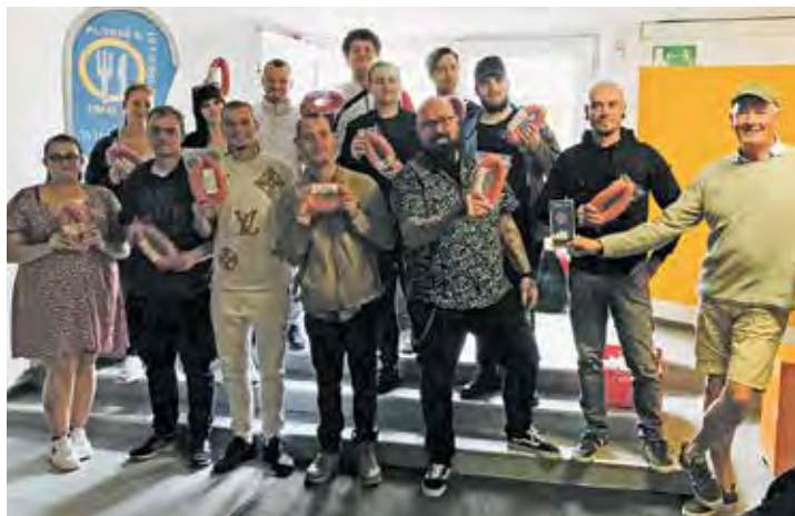
Die Azubis überreichten 60 Kilogramm Fleischwurst an den Tafel-Vertreter.