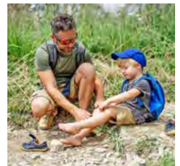
Auch unterwegs sollte die Reiseapotheke gut ausgestattet sein.

auf Reisen besondere Vorbereitungen und können die Reiseplanung vor Herausforderungen stellen. Der gesamte Inhalt der Reiseapotheke – auch Verbandstoffe und Pflaster – sollte regelmäßig auf das Verfallsdatum hin überprüft werden. Wer in fernen Ländern Urlaub machen möchte, sollte sich über die von der Ständigen Impfkommission am Robert-Koch-Institut empfohlenen Reiseschutzimpfungen für das jeweilige Urlaubsland informieren. Die Impfungen schützen vor gefährlichen Krankheiten wie z.B. Cholera, FSME, Malaria (Tablettenprophylaxe), Tollwut, Gelbfieber oder Hepatitis A/B. Reiseimpfungen gehören jedoch nicht zum Leistungskatalog der gesetzlichen Krankenkassen.