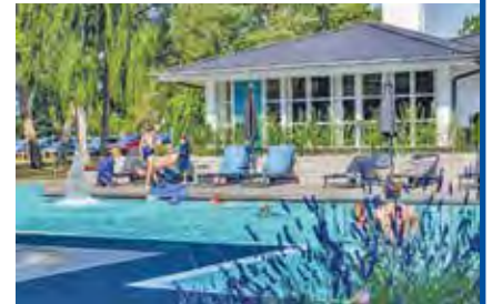
Traumhafte Hotel-Anlage mit großem Pool direkt am Meer

Leistungen: • Fahrt im erstklassigen Fernreisebus ab Oldenburg / Lütjenburg / Lensahn • „Ostsee-Kreuzfahrt“ mit der modernen Direkt-Fähre von der Insel Rügen nach Rönne/Bornholm und zurück • 3 x Übern. im Bade-Hotel mit reichhaltiger Halbpension • Kostenlose Benutzung von beheiztem Außenpool und Sauna im Hotel • Gr. Insel-Rundfahrt mit fachkundiger Reiseleitung zu den Höhepunkten Bornholms • Tagesausflug Insel-Hauptstadt Rönne und Besuch einer Fisch-Räucherei (Aufpreis 19,90 €) • Alle Zi. mit DU/WC, TV, Telefon, Balkon oder Terrasse und kostenlosem WLAN • Zusatz-Reiseterrmin: • 02. - 05.09.2024