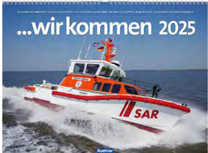
„... wir kommen 2025“ über Schiffe und Arbeit der Seenotretter

Die gesamte Arbeit der DGzRS wird nach wie vor ausschließlich durch freiwillige Zuwendungen finanziert. Im Verkaufspreis des Wandkalenders von 29,95 Euro (in Österreich 30,70 Euro, in der Schweiz 35,90 sFr.) ist eine Spende in Höhe von 3,00 Euro pro Exemplar enthalten. Der neue