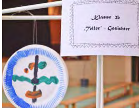
Die Klasse 2b hatte Pappteller im Picasso Stil kunstvoll aufgewertet