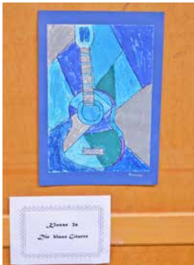
Die blaue Gitarre stellvertretend für die blaue Periode von Pablo Picasso

Schülerinnen und Schülern der Klassen 7-13, ergänzt durch Ehemalige und Mitglieder aus dem Lehrerkollegium. Die Big Band begeistert ihr Publikum regelmäßig bei schulischen Veranstaltungen und ist fester Bestandteil des Lütjenburger „Herbstzaubers“. Das Konzert wird durch den Förderverein zum Erhalt der St. Claren-Kirche veranstaltet, Eintritt frei, Spende erbeten. In der Pause laden Wasser, Wein und Brezeln zum Klönschnack ein.