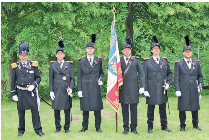
Die drei Kompanien mit ihren Kapitänen freuen sich auf das bevorstehende Gildefest.