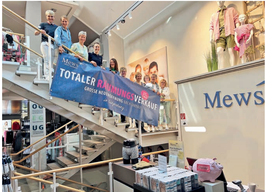
Das Modehaus Mews will noch frischer und moderner werden. Doch vor der Renovierung startet ein großer Räumungsverkauf, der am Donnerstag, 27. Juni, beginnt.

lich mit von der Partie. Wir öffnen von 11 bis 16 Uhr, damit Sie noch mehr Zeit zum Stöbern und Shoppen haben. Nach umfassenden Umbauarbeiten laden wir Sie herzlich zur großen Neueröffnung ein! Freuen Sie sich schon jetzt auf ein frisches Einkaufserlebnis und viele neue Highlights in modernem Ambiente. Bis dahin brauchen wir allerdings noch etwas Zeit, um Platz im Laden zu schaffen... Wir freuen uns auf Ihren Besuch!