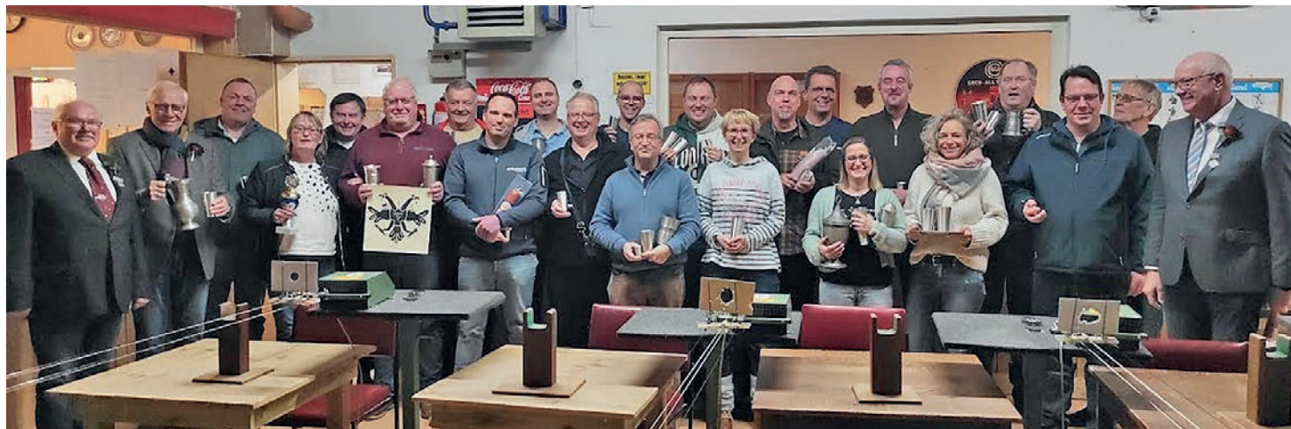
Die erfolgreichen Schützinnen und Schützen mit ihren Siegespreisen zur Siegerehrung.

Oldenburg. (ol/eb) Viel Spaß in geselliger Runde hatten vom Donnerstag, dem 23. November bis zum Sonntag, dem 26. November insgesamt 148 Schützinnen und Schützen aus 26 Zeltgemeinschaften der St. Johannis Toten- und Schützengilde von