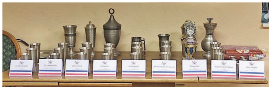
Um diese Siegesprämien wurde hart gerungen.