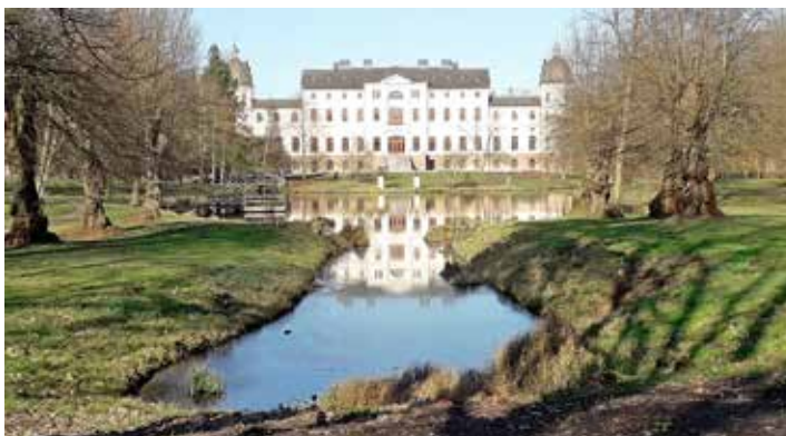
Das Herrenhaus Salzau mit der Spiegelung im Teich.

Adelsgutes Salzau. Durch Getreidefelder führt die Fahrt zum ehemaligen Meierhof Ottenhof. Über Charlottental erreicht man das Herrenhaus Salzau von 1882, das sich bis vor wenigen Jahren noch Landeskulturzentrum nennen durfte und auf eine wechselvolle Geschichte zurückblicken kann. Beeindruckend ist auch der Blick von der Gartenseite mit der Spiegelung im Teich. Mit etwas Glück können wir bereits das Blütenmeer der rot blühenden Rosskastanien im Park erleben. Im Park steht ein Gedenkstein