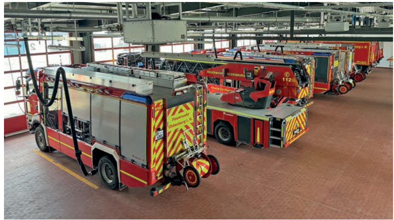
Das Feuerwehrgerätehaus mit seinen neuen Fahrzeugen im Mai 2024.

Einem vergnüglichen Tag für „Groß und Klein“ steht somit nichts im Wege, alle sind herzlich eingeladen, am 8. Juni eine schöne Zeit bei der Freiwilligen Feuerwehr Oldenburg zu verbringen und mitzufeiern. Zur Historie: Am 14. September 2021 vernichtete ein Brand die Halle des Feuerwehrgerätehauses in der Ringstraße 5 und zerstörte zugleich einen Großteil der Ausrüstung und Fahrzeuge - hieran erinnert heute eine Schrankvitrine im Flur des Feuerwehrgerätehauses mit