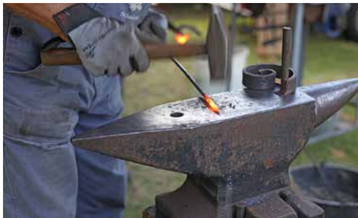
Die Lutterbeker Schmiede zeigt traditionelle Handwerkskunst im Probstei Museum.

atmosphäre zu entdecken und das heimische Kunsthandwerk zu unterstützen. Darüber hinaus können alle Gebäude und Ausstellungen des Museums besichtigt werden. Im Walter-Muhs-Haus erwartet die Besucherinnen und Besucher die Sonderausstellung des international bekannten Illustrators Einar Turkowski: „I just want to be a filmstar“ und in der