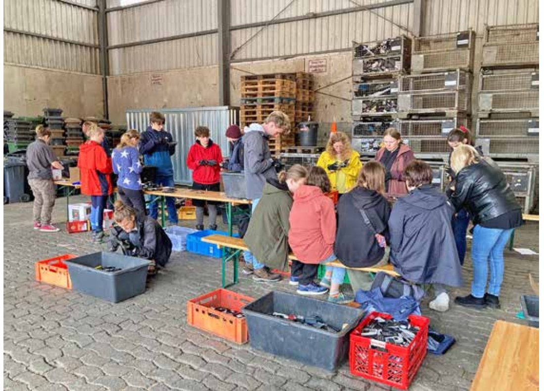
Freiwillige beim Sortieren der Handys.