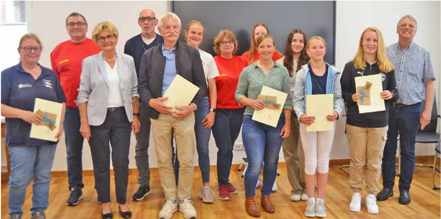
Die geehrten Sportlerinnen und Sportler im Ratssaal des Rathauses der Stadt Lütjenburg.