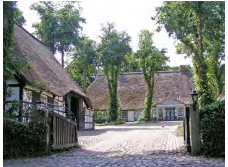
Reethof in Fahren