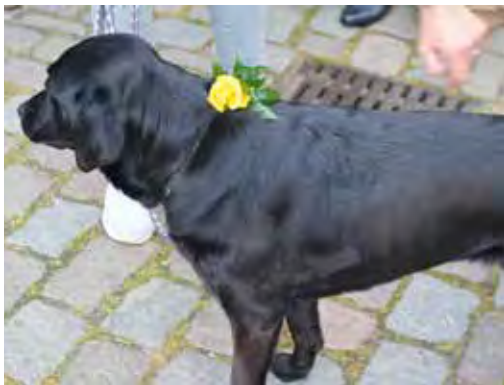
Selbst die Vierbeiner waren an diesem Tag mit der gelben Rose der Lütjenburger Schützen-Totengilde von 1719 geschmückt.