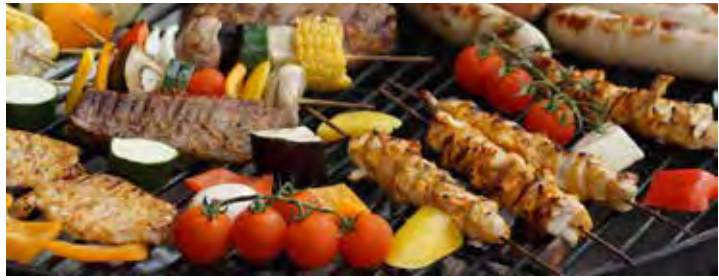
Ein reichhaltiges und leckeres Sommer-Grill-Buffer erwartet unsere Leser:innen an Bord.