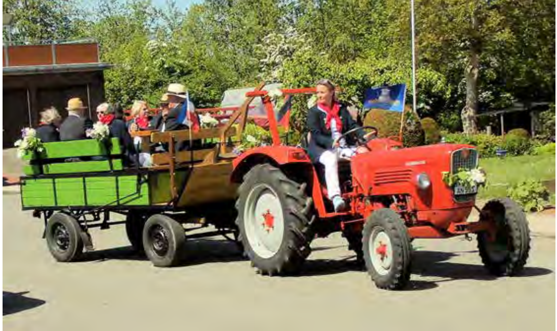
Der neue Festwagen