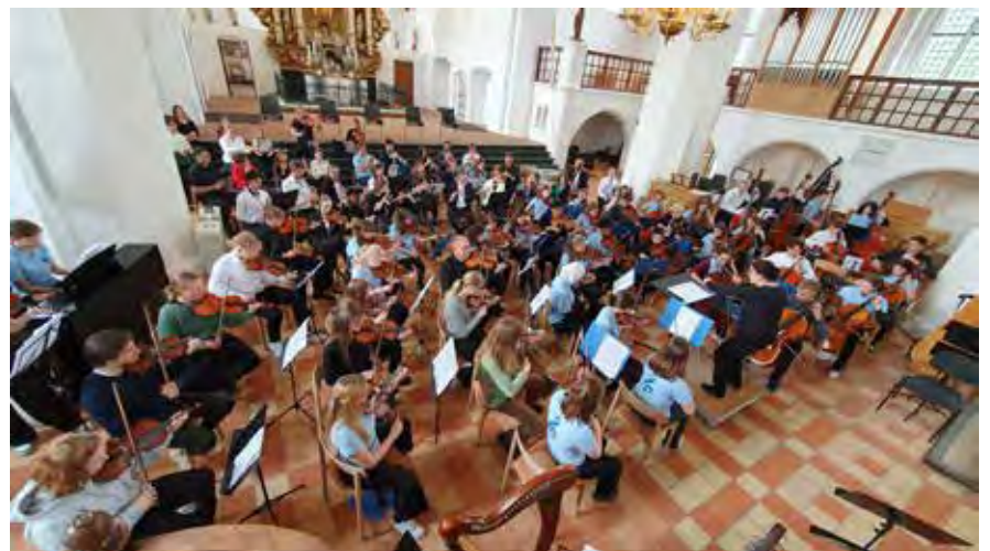
UnderStrømmen

weise dänischer und deutscher Komponisten, von denen einige sogar einen Bezug zur heutigen „Vogelfluglinie“ hatten. Hierzu zählen Carl Nielsen, der seine Sommer auf dem Herrensitz Fuglsang auf Lolland komponierend verbrachte, sowie Carl Maria von Weber und Johannes Brahms, die bekanntlich aus Eutin bzw. Hamburg stammten. Insgesamt präsentieren sich die jungen Künstler:innen tänzerisch: Zu hören sind nämlich u. a. Webers „Aufforderung zum Tanz“, Felix Mendelssohn-Bart-