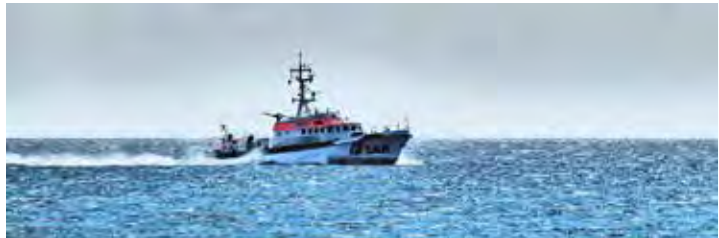
zu erfahren, was es bedeutet, Menschen aus Seenot zu retten. Treffpunkt: MeerHuis, Süstrand 10 23775 Großenbrode.

einen die unbedingte Freiwilligkeit gemeint, mit der die Besatzungsmitglieder bei jedem, wirklich jedem Wetter und zu jeder Tages- und Nachtzeit in den Einsatz fahren. Damit ist aber ebenso die ausschließliche Freiwilligkeit bei der Finanzierung der gesamten Arbeit gemeint – ohne einen Cent Zwangsabgaben seitens der Steuerzahler. Die Gesellschaft finanziert sich ausschließlich aus freiwilligen Förderbeiträgen, das heißt, jede Spende ist genauso freiwillig wie der Einsatz der Besatzungen. Der Eintritt ist frei – Spenden sind herzlich willkommen. Im Anschluss gegen 15.30 Uhr sind alle Interessierten eingeladen beim „Open Deck der DGzRS“ in einem Gespräch mit den Rettungsleuten aus erster Hand