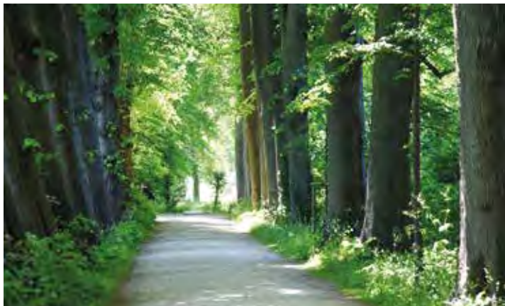
Die Lindenallee im Schlossgarten lädt zum Spaziergang ein.