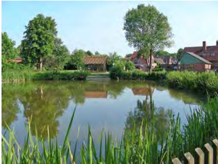
Idylle am Prasdorfer Dorfteich.