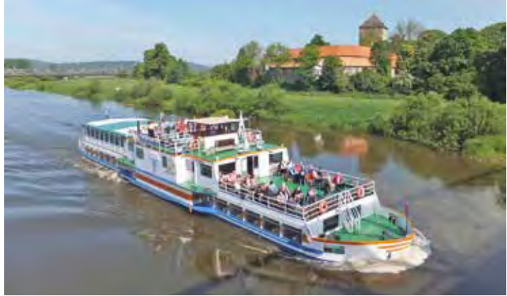
Mit dem Weser-Dampfer geht es ab Bremen mit großem Grill-Buffer an Bord Kurs Lüneburger Heide.

Fernreisebus mit Waschraum/WC und Bordküche zur Einschiffung in die Bremer Innenstadt. Von dort startet die traumhafte Fluss-Kreuzfahrt mit dem Weser-Dampfer durch die einmaligen Naturlandschaften in die bekannte Reiterstadt Verden. Mit dem Kurier-Bus geht es sodann von dort weiter in die blühende Lüneburger Heide zum Höhepunkt der diesjährigen Blütesaison in die romantische Heidestadt Schneverdingen mit Besuch der zauberhaften blühenden Heidegärten am Höpen und am alten Heide-Schafstall und den schönsten Heide-Schaubildern Deutschlands mit Freizeit für unsere Leser:innen. Die Rückkehr