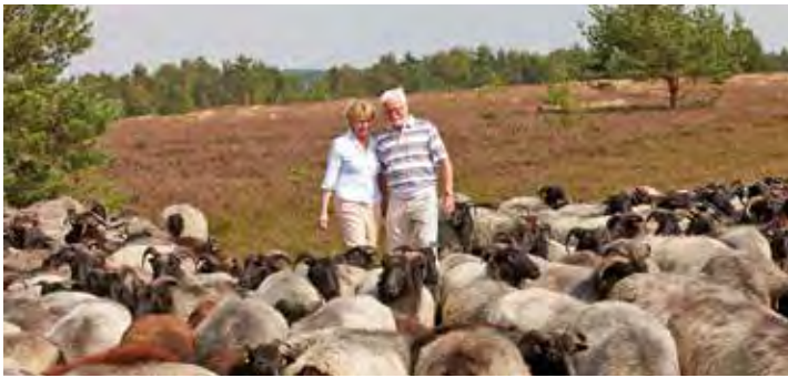
Zum Höhepunkt der blühenden Heide entdecken unsere Leser:innen die malerischen Landschaften in den schönsten Farben.

des Burg-Verlages in Eutin, täglich von 9 bis 13 Uhr, per Telefon 04521/701130 oder direkt unter leserreisen@der-reporter.info .