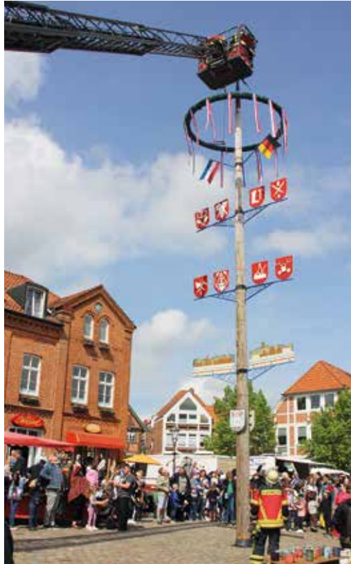
Hoch hinauf ging es für die Feuerwehr Lütjenburg, um den Kranz am Maibaum zu befestigen

der Welte Krisen und Probleme sind, es schön ist, wenn die Menschen für ein paar Stunden unbeschwert zusammenfinden.