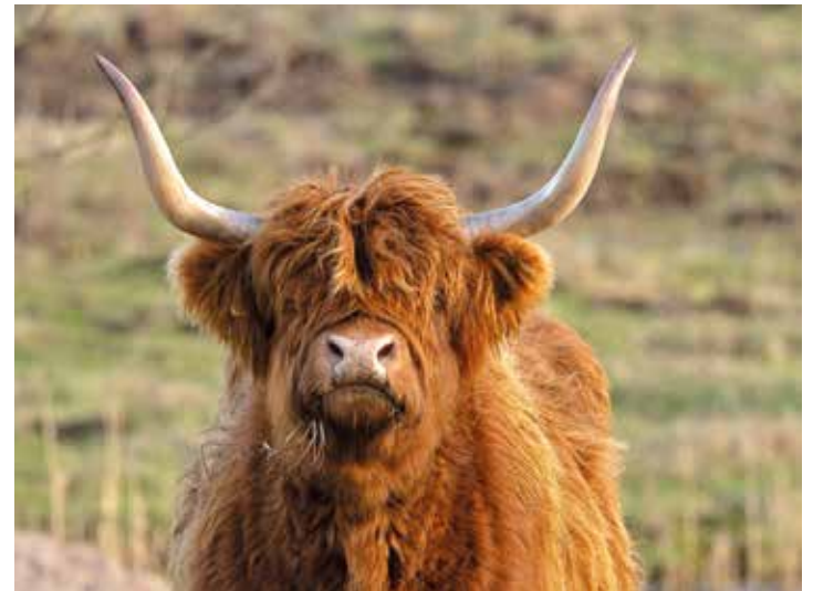
Die zotteligen Highlandrinder sind für die Landschaftspflege zuständig.

chen beweiden. „Manchmal ist das allerdings zu viel des Guten, denn die Rinder fressen leider auch gerne seltene Pflanzen“, so Mohwinkel weiter. Um das zu unterbinden, haben die Stiftung Naturschutz als Flächeneigentümerin, die Naturschutzbehörde und die NABU-Schutzgebietsbetreuer bereits im letzten Jahr beschlossen, bestimmte Weidbereiche zeitweise auszusparen. Mit Erfolg, denn plötzlich entwickelten und vermehrten sich dort wieder ausgesprochen seltene Pflanzen wie eben das Salz-Hasenohr, die Natterntzung, Echter Sellerie und weitere Arten der Roten Liste gefährdeter Pflanzenarten. Auch in diesem Jahr sollen die Beweidungspausen wieder bis zum Hochsommer stattfinden, um die positive Entwicklung fortzusetzen. Dazu haben die ehrenamtlichen NABU-Schutzgebietsbetreuer jetzt einige Bereiche abgezäunt und hatten dabei Unterstützung