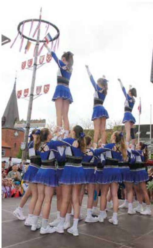
Die Cheerleader des Sport Club Lütjenburg begeisterten die vielen Zuschauer:innen.