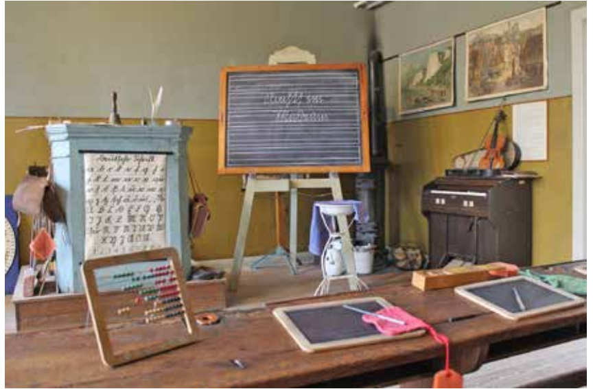
Im historischen Klassenzimmer des Dorf- und Schulmuseums Schönwalde kann am Pfingstsonntag (19.Mai) das von Heinrich Evers entwickelte Plattdütsch-Abitur abgelegt werden. Außerdem gibt es Arbeitsbögen „Plattdütsch for Kids“.

„Bildung und Kultur gehört zur DNA des Dorf- und Schulmu-