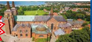
Wikinger-Dom Roskilde: UNESCO-Weltkulturerbe & Königsgräber