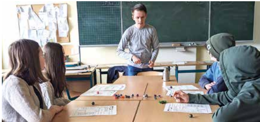
Projekt Grimoire des Magiers.

Lütjenburg. (ms) ...hieß es am Mittwoch, 27. März, am Gymnasium Lütjenburg. Der (Vor)-Lesetag ging mit einem gemeinsamen Foto auf dem Hof los, dann begann der erste Timeslot mit Projekten wie z.B. Detektiv- und Krimigeschichten, Bücher-Schnitzeljagd, Traumreisen, Creative Writing, Black Stories, Escape Room, Fußball, Theater, englische Literatur, Philosophie, Buchbinden u.a. In den Wochen davor hatten die Schülerinnen und Schüler des 11. und 12. Jahrgangs ein attraktives Angebot für die Fünft- bis