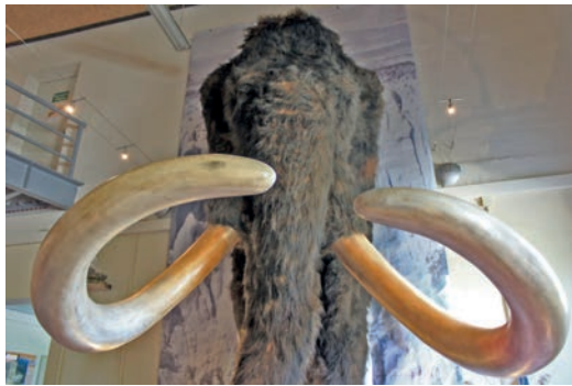
Am 09. Mai wird das Museumsfest mit Groß und Klein gefeiert!

Am Himmelfahrtstag begrüßen wir Sie zu unserem diesjährigen Museumsfest. Es erwartet Sie ein buntes Programm mit Museumsführungen, Wande-