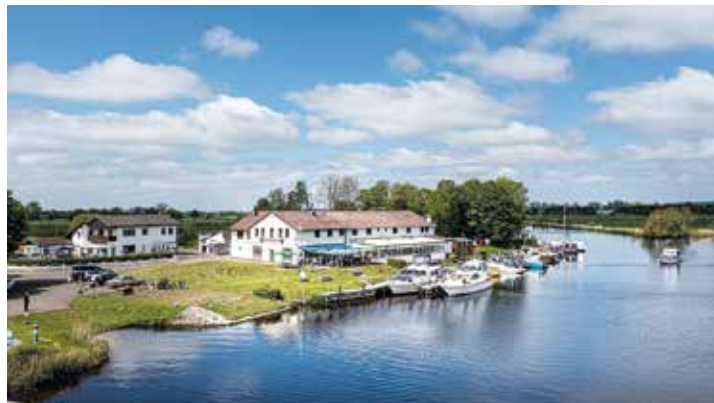
Mit kulinarischem Gaumenkitzel werden unsere Leser:innen im berühmten Fährhaus an der Eider verwöhnt.