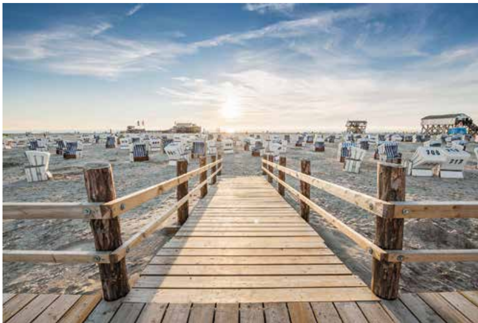
Tosende Brandung und endlose Sonnenstrände zum Genießen: St. Peter-Ording erwartet zu Pfingsten unsere Leser:innen.

Fährhaus zum Mittagessen mit einem leckeren Dithmarscher Schlemmer-Buffet mit ku-