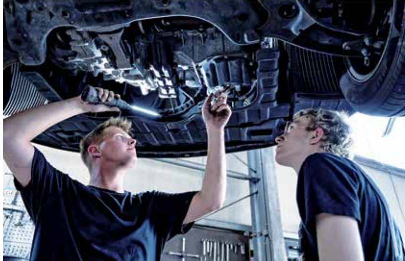
Beim Klimaanlagen-Check prüft der Kfz-Mechaniker alle Teile der Anlage und ihre Funktionen.

Der Zentralverband Deutsches Kfz-Gewerbe weist auf Probleme hin, die durch eine mangelhafte Wartung entstehen können. Ein niedriger Stand des Kältemittels etwa kann die Leistung beeinträchtigen und zu Schäden am