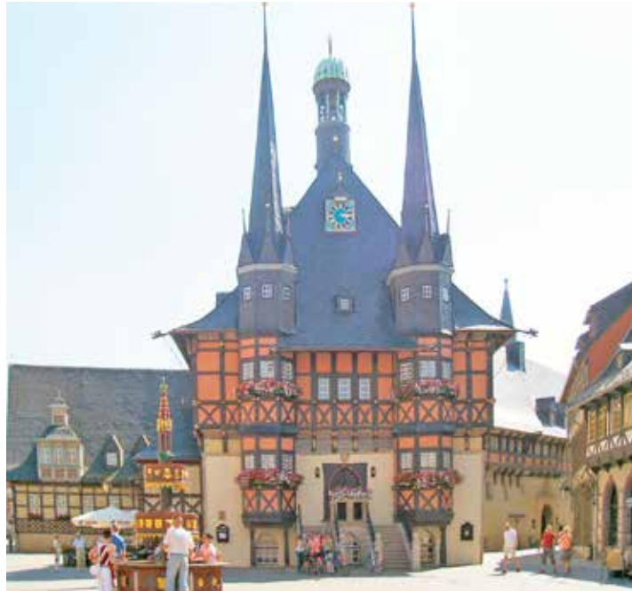
Die Höhepunkte des Harzes entdecken unsere Leser:innen bei zwei großen Panorama-Rundfahrten, u.a. nach Wernigerode.

Oldenburg/Lütjenburg/Lensahn. (t) Unser Sommer-Knüller für unsere Leser:innen zum Superpreis mit Busfahrt direkt ab Oldenburg, Lensahn und Lütjenburg: Entdecken Sie den romantischen Harz mit unserem Komfort-Hotel mit großem Hallenbad und Sauna in traumhafter Lage im berühmten Berg-Kurort Hahnenklee am Blocksberg zu Top-Terminen im Sommer vom 19. bis 22. Juni 2024 und vom 15. bis 18. September 2024 und lassen Sie sich rundum verwöhnen mit einem großen Ausflugs- & Entdecker-Programm mit vielen Höhepunkten, das bereits im Superpreis von nur 333,00 Euro (Einzelzimmer plus 90,00 Euro) komplett enthalten ist. Schlemmen und genießen können unsere Leser:innen an den großen Schlemmer-Buffets während der sehr reichhaltigen Vollpension mit dem großen All-Inklusiv-Getränkpaket ohne Begrenzung von 10 bis 20.30 Uhr im Hotel. Zum großen Leistungspaket der Sonder-Reisen gehören neben der Fahrt im 4-Sterne-Reisebus