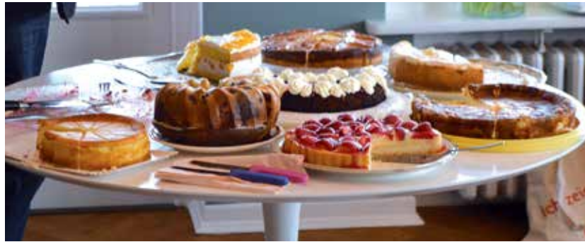
Köstliche Kuchen wurden für die feierliche Spendenübergabe von den Lions Club Mitgliedern liebevoll gebacken.

Personen fortgesetzt werden kann. Unbedingt vormerken sollte man sich schon den 7. und 8. Dezember 2024, denn die Lions Mitglieder sind schon mit Hochdruck dabei, den diesjährigen Weihnachtsmarkt vorzubereiten.