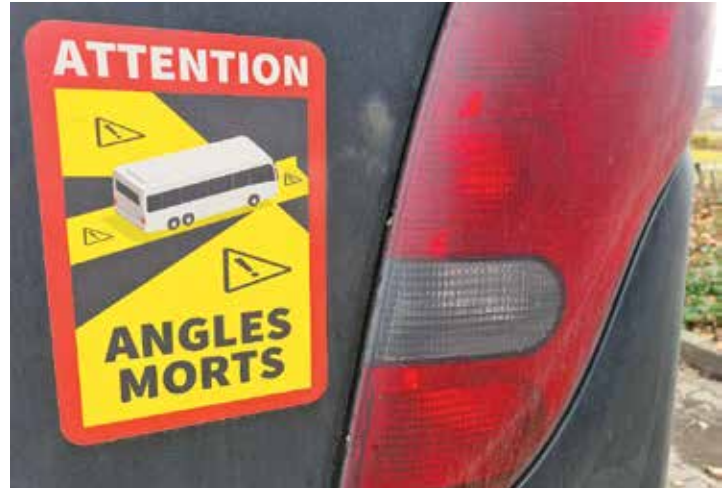
Attention: Angle Morts! So warnen Schilder an Bussen und Lkw vor den Gefahren im Toten Winkel, etwa beim Ampelstopp.

zungen erleiden mussten. Mittlerweile dürfen Kraftfahrzeuge über 3,5 Tonnen beim Rechtsabbiegen innerorts nur noch höchstens Schrittgeschwindigkeit fahren. Außerdem sind viele Lkw und Busse mit aufwendigen Spiegel-, Radar- und Kamerasystemen ausgestattet, damit die Fahrer die Situation unmittelbar