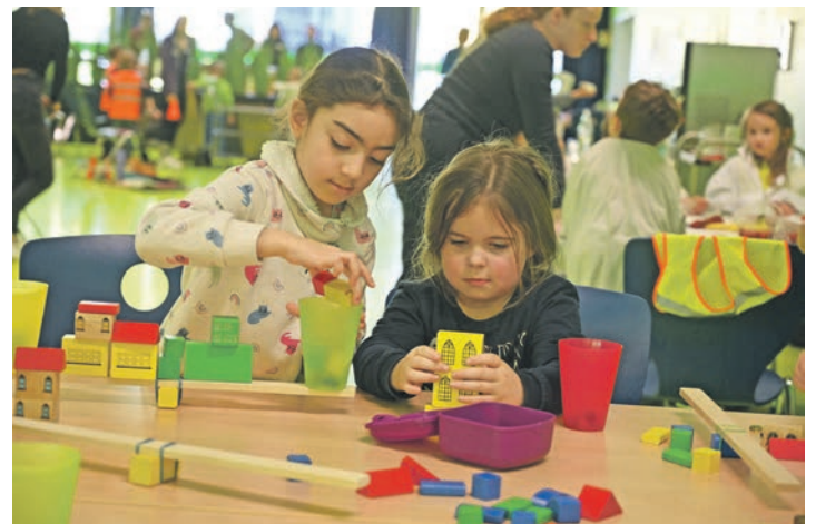
Zwei Mädchen entdecken das Prinzip einer Wippe.

Kindern einen aktiven Zugang zu Themen wie Energie und Klimaschutz schaffen. Mit dem spielerischen Ansatz lassen sich Kinder im Kindergartenalter nachhaltig für diese Themen begeistern und sensibilisieren.