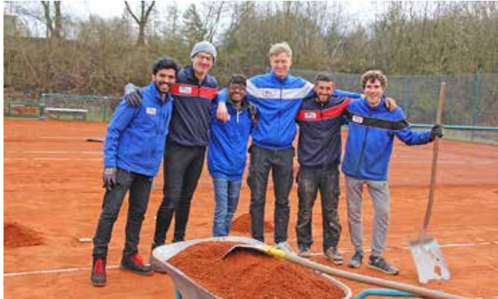
Eine Kieler Firma mit ihren Profis in Sachen Sport- und Tennisplätze schaffte die Voraussetzungen für die neue Tennissaison beim Tennisclub Lütjenburg.

Elf Tonnen roten Sand haben die Profis aufgebracht und sieben Tonnen alten Sand abgefahren.