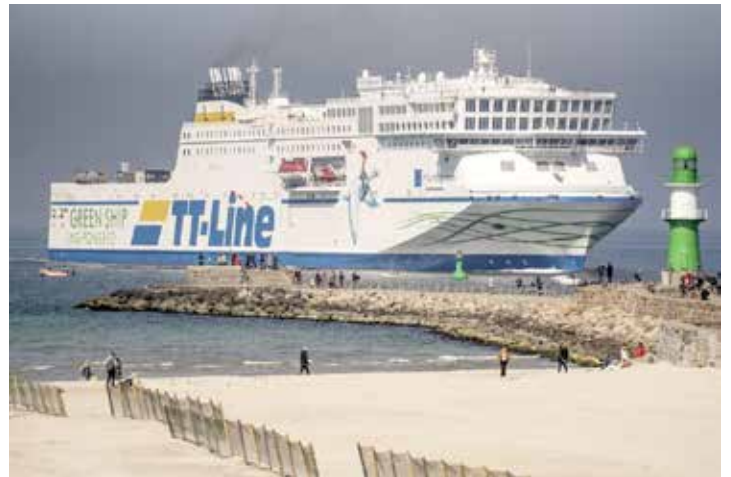
Unterwegs mit den Jumbo-Linern der TT-Line zum großen Jubiläum Kurs Schweden.

buchen für nur 19,90 Euro. Zum großen Leistungspaket zum absoluten Jubiläums-Knüllerpreis „60 Jahre TT-Line“ von nur 225,00 Euro gehören neben der Fahrt im erstklassigen Fernreisebus mit Waschraum/WC und Klimaanlage ab Oldenburg, Lütjenburg und Lensahn die „Ostsee-Kreuzfahrt“ von Trave-