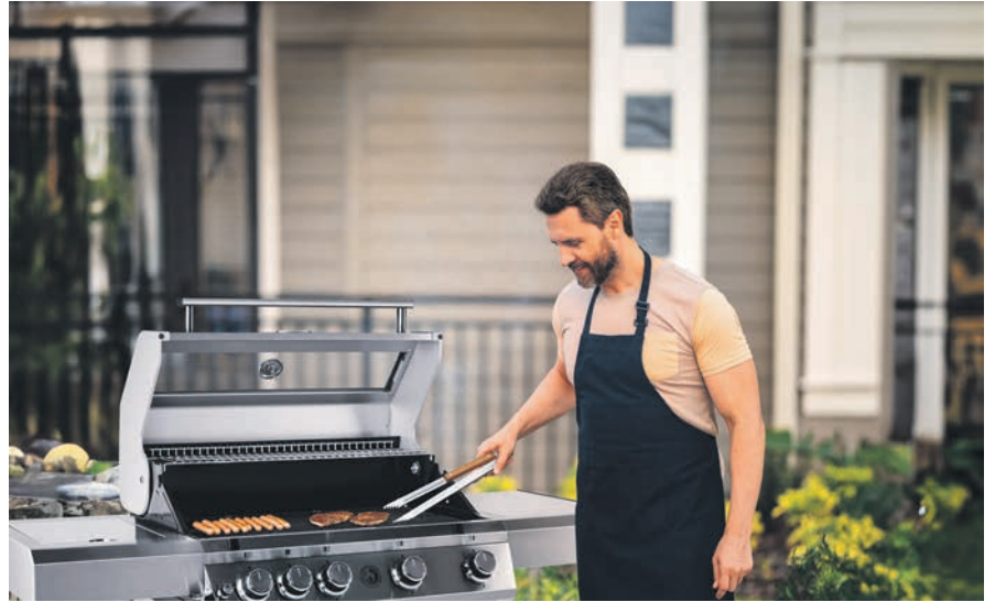
„Ran an den Grill!“ heißt die seit 11. März bei familia und Markant neu angelaufene Treueaktion.

gibt es auf die ausgewählten Artikel bis zu 63 % Rabatt. 5 Euro = 1 Treuepunkt: Kundinnen und Kunden von familia und Markant punkten bei jedem Einkauf. Nach dem bewährten Prinzip erhalten sie an der Kasse für je 5 Euro Einkaufswert einen Treuepunkt zum Einkleben in das Sammelheft. Noch einfacher ist das Sammeln in der