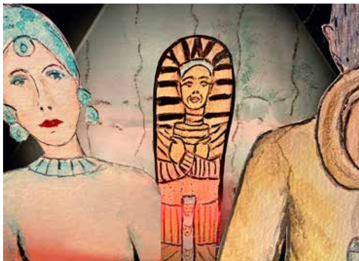
Szenenbild aus „Der Zauber des Prinzen Jussif“.

Sie sich mit den Theaterspielern auf die humorvolle Suche nach dem Zauber des Prinzen Jussif und treffen Sie bekannte Krimifiguren, eine talentierte Krimiautorin und... Prinz Jussif höchst persönlich. Kulissen und Figuren selbst entworfen, live gespielt von Birthe und Sascha Thiel. Eine gelungene Mischung aus traditionellem Papiertheater, Schauspiel und einer Prise Multimedia. Dauer: 30 Minuten, anschlie-