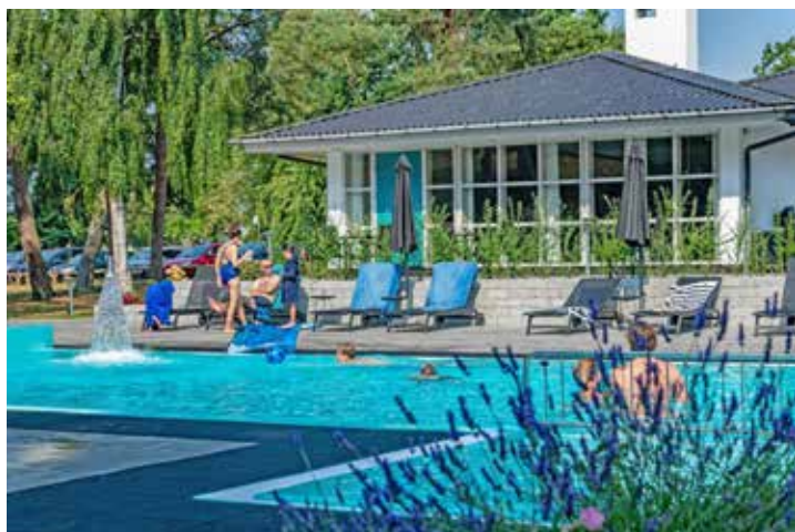
Traumhafte Hotel-Anlage mit großzügigem Pool direkt am Meer.

Anmeldungen sind ab sofort möglich im Leser-Reisen-Büro des Burg-Verlages in Eutin, Lübeck Str. 12, täglich von 9 bis 13 Uhr unter Telefon 04521/7011-30 oder direkt online im Internet unter leserreisen.der-reporter.info .