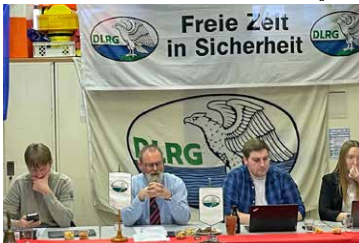
Der Vorstandstisch der DLRG Lütjenburg.