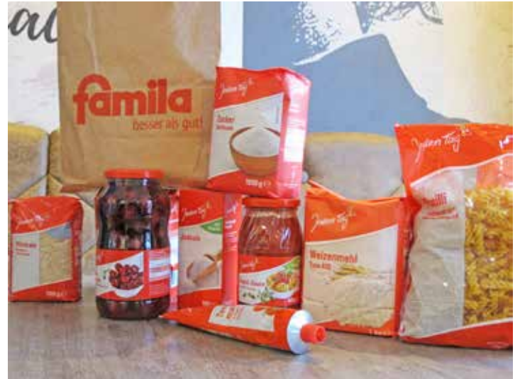
Der Inhalt einer Papiertüte zugunsten der Tafel Lütjenburg gestaltet sich beispielsweise wie dargestellt.