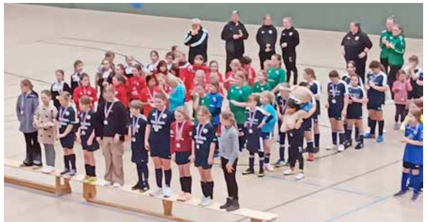
E Mädchen Siegerehrung

Am Sonntag, dem 03.03.24 startete um 10:30 Uhr das D-Mädchen Turnier und im Anschluss daran startete das B-Mädchen Turnier. 7 Mannschaften duellierten sich um den Ball. Am Ende konnte die Mannschaft des TSV Siems das Turnier für sich entscheiden. Herzlichen Glückwunsch! Unser Team vom SV Knudde 88 Giekau konnte das Turnier mit einem großartigen 3. Platz beenden. Veranstaltungsende war schließlich um ca. 18:30Uhr. Wir danken allen fleißigen Helferinnen und Helfern, die mitgeholfen haben,