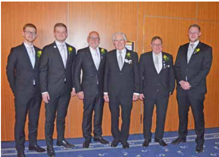
Stolze drei Generationen Familie Anders waren auf der Jahresmitgliederversammlung vertreten

von Olaf Petersen, der bereits die Seite des TSV Lütjenburgs betreut, wird der Auftritt modernisiert, hier sind Vorschläge und Anregungen der Gildemitglieder jederzeit willkommen und erwünscht. Auch die Gildezeitung wird in diesem Jahr in den eigenen Reihen gestaltet und produziert, mit Gildebruder Jörg Beyschlag vom Klopp Verlag hat man hier für die Produktion einen professionellen Partner gefunden.