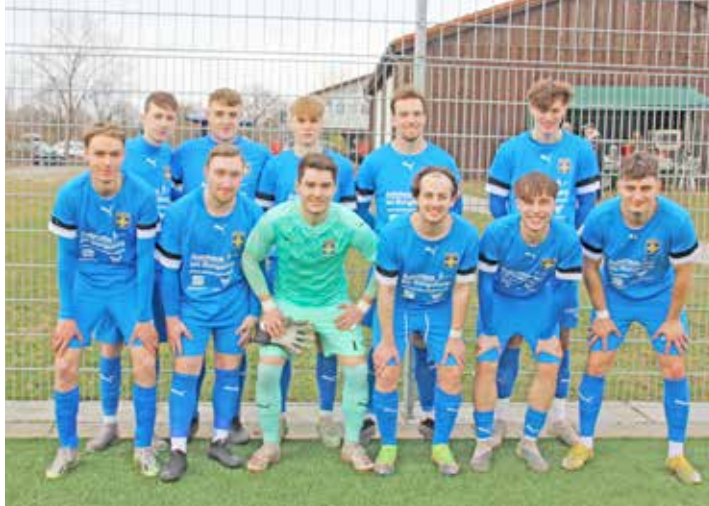
Vor dem Spiel in der Kreisliga in Lütjenburg zeigten sich die Eutiner sehr zuversichtlich.

Noch zwei geplante Sonntagspiele. Der TSV Klausdorf II – U23 musste sich mit der SG Bösdorf/Malente messen und machte den 2:0 Heimerfolg perfekt. Das Spiel der SG Döbersdorf/P'hagen gegen den Ralsdorfer SV fiel jedoch aus. Schlusslicht TSV Stein steht erst am Montag, 1. April vor einer unlösbaren Aufgabe, denn der Tabellenführer Oldenburger SV ist dann der Gegner.