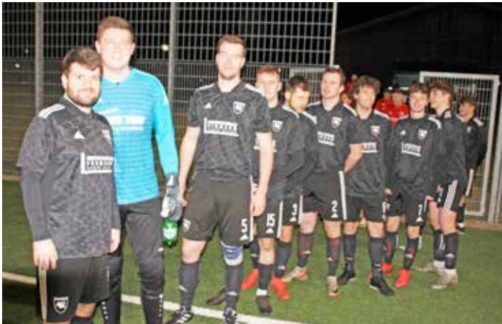
SG Insel Fehmarn musste ein 4:0 für Lütjenburg hinnehmen

SG Insel Fehmarn: Heinecke, Langhoff, Paluczynski (71. Meyer), Blendermann, Gerber, Jacob (68. Vehstedt), Othengrafen, Sylla, Mackeprang (76. Bakabala), Juergens, Demtröder. Tore: 1:0 Schütt (9.), 2:0, 3:0 Zimmermann (14., 61.), 4:0 Tetzlaff.- Schiedsrichter: Hellriegel. .Assi.: Guillon, Schwarz.- Zuschauer: 30.